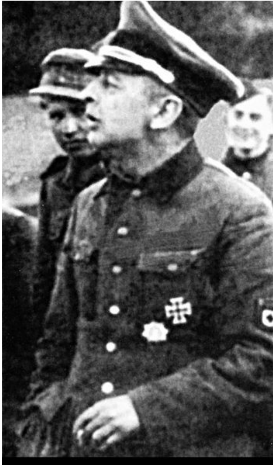
Генерал-майор вермахта и бригаденфюрер СС Б.В. Каминский с бойцами Русской освободительной народной армии

Можно вспомнить и мелких фигурантов. Выше я уже писал об инженере Каминском, создавшем для немцев бригаду СС, «отличившуюся» при штурме Варшавы в 1944 г. А ведь Каминского перед войной вычислили как члена «пятой колонны» и даже посадили, но нена-