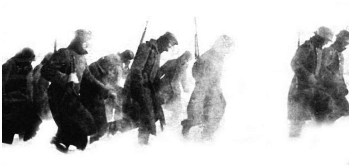
Отступление немцев от Москвы, зима 1941–1942 гг.

Как вы помните из первой части этой книги, гестапо послало гонцов сообщить полякам армии Андерса о том, что польские офицеры расстреляны русскими, еще в декабре 1941 года. У нас обязан возникнуть вопрос: а почему немцы не раструбили об этом на весь мир уже тогда, в конце 1941-го? Причем если бригада Геббельса об этом факте молчит, то уж о следующем молчать не может.