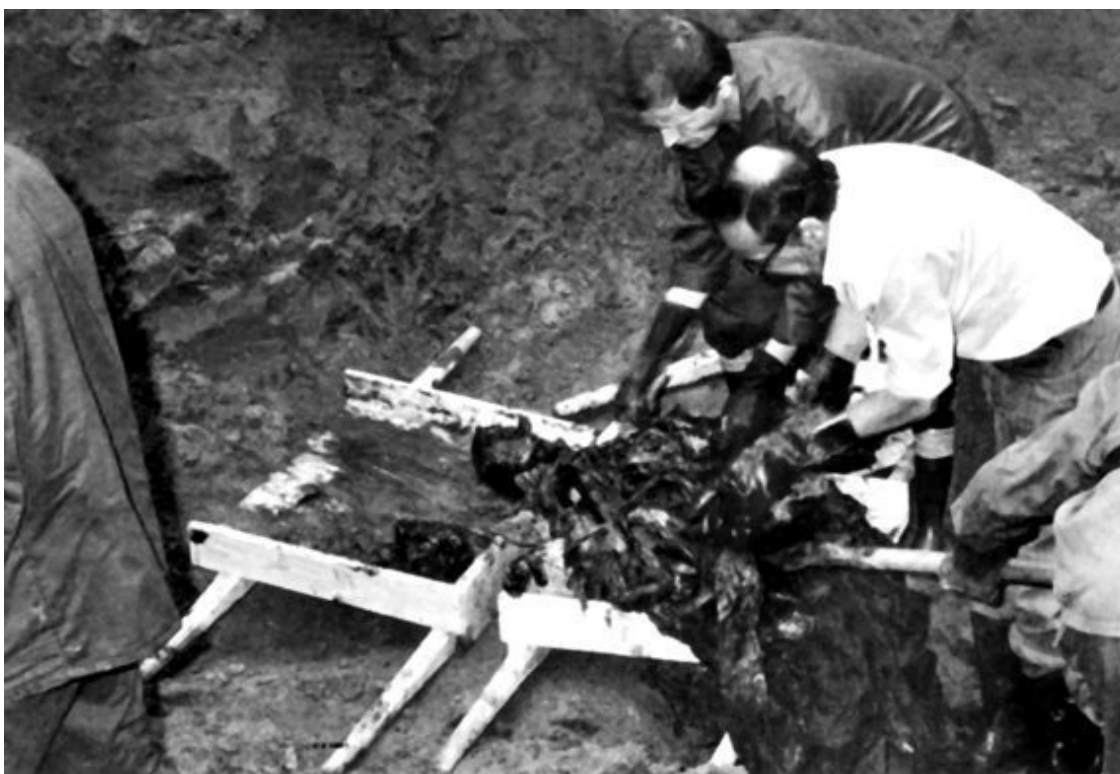
Эксгумация останков в пос. Медном

Но это не самое смешное в этих раскопках, поскольку через пять лет после эксгумации выяснилось, что в могилах, оказывается, было найдено и огромное количество писем, удостоверений, списков расстрелянных и, главное, много газет с первой страницей, по которой было ясно, что пленных расстреляли до лета 1940 г. Понимаете, в могилах от костей ничего не осталось, а список из 46 пленных полицейских с указанием не только их имени, но и имени отца, года рождения, места службы и должности 50 лет пролежал в черной жиже, а читается весь до буквы, и так, как будто вчера написан 62 . Но особенно трогает находка большого количества газет – видать, НКВД с целями коммунистической пропаганды закопало вместе с казненными и избу-читальню с подшивками центральных газет за последние годы.