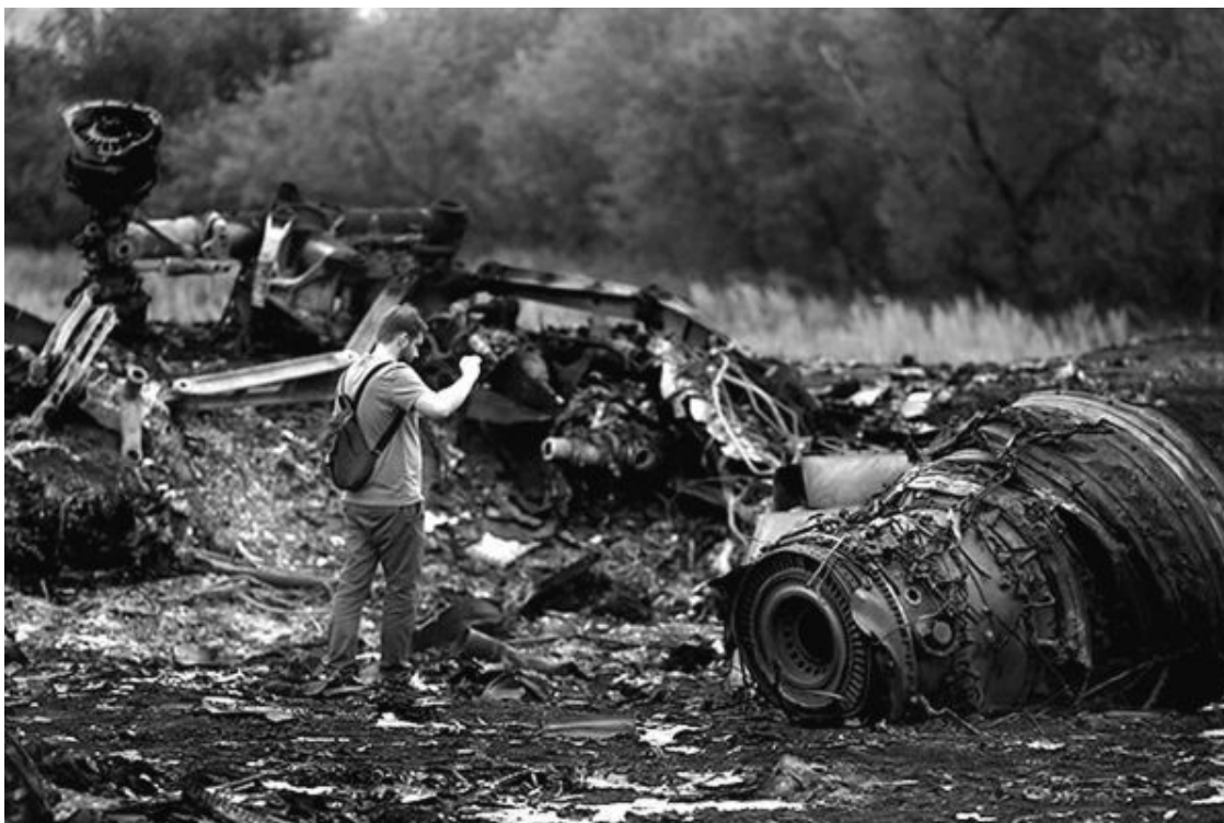
Рис. 16. Детали двигателя «Rolls-Royce Trent 800» без вала, скрепляющего их воедино (на снимке справа)