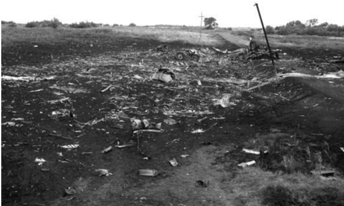
Рис. 9. Место падения малайзийского «Боинга 777» у села Грабово. Снимок с земли

Обе официальные версии инцидента с рейсом МН 17 уверяют нас, что центральная часть «Боинга 777» (почти 300 тонн взлетной массы) упала на автодорогу на окраине села Грабово Донецкой области. По крайней мере, там лежат детали двигателей и шасси, там место, на котором был пожар, там сосредоточено основное количество тел.