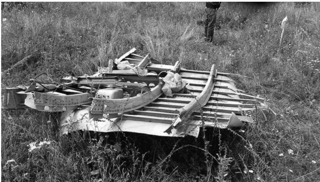
Рис. 31. Фрагменты «Боинга 777» на Донбассе

Вот плоскость самолета, рассчитанная на работу при таких его скоростях, с которыми пуля вылетает из пистолета (рис. 31–34).