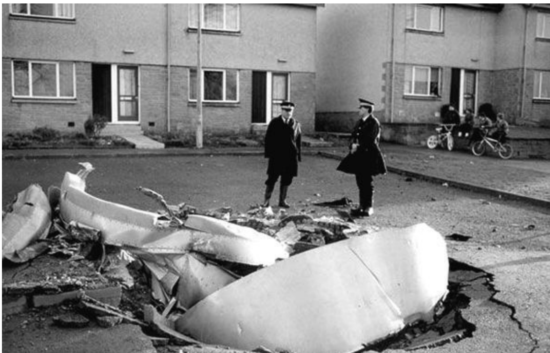
Рис. 11. Один из четырех двигателей «Pratt & Whitney JT9D» «Боинга 747», взорванного над Локерби