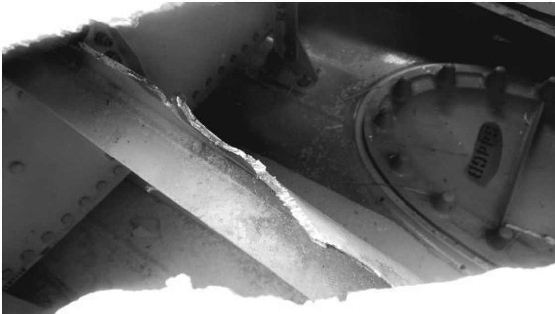
Рис. 38. Структура среза балки

Обломки «Боинга 777» на Донбассе представляют собою небольшие фрагменты, получаемые после разделки корпуса самолетов для его утилизации. Характер обломков и следы режущего инструмента приводят к выводу, что в качестве рабочего инструмента применялись гидронажницы и «болгарки». Поскольку трудно предположить, что стюардессы рейса МН 17 в воздухе разделяли гидронажницами свой самолет на части, то автоматически приходим к выводу, что в Донбассе лежат обломки не рейса МН 17. Там лежат обломки «Боинга 777», взятые со склада металлолома от какого-то другого самолета. От какого?