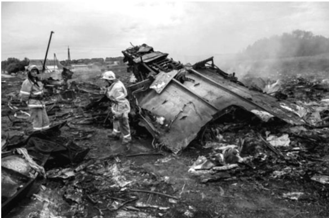
Рис. 13. Практически не обгоревший лист дюралюминия в центре самого большого огня у села Грабово

Да, основным конструкционным материалом планера самолета является прокат (лист, балки, трубы) из легированного алюминия, в основном дюралюминия – сплава алюминия с медью, магнием и марганцем (плотность 2500–2800 кг/м 3 , температура плавления около 650°). При нагревании на воздухе до температуры плавления такой материал может сгореть, но нужно организовать это горение – с пониманием дела нагревать и подавать кислород (воздух). Прежде всего следует организовать как можно большую поверхность окисления (для чего, когда требуется окислить весь алюминий, его измельчают порою в пудру). Ведь у вас на кухне есть и сковородки, и кастрюли из алюминия, а температура голубого пламени конфорки газовой плиты около 2000°. Ну и много ли сковородок у вас исчезло, как «Боинг 777», сгорев на плите? Даже если вы очень постараетесь, то сковородка расплавится, но не сгорит (мною как-то было это нечаянно проверено) – у алюминия сковородок мала поверхность окисления, и та покрывается тугоплавкой окисной пленкой, препятствующей контакту алюминия с кислородом воздуха. А температура горения авиационного керосина в воздухе всего 800°.