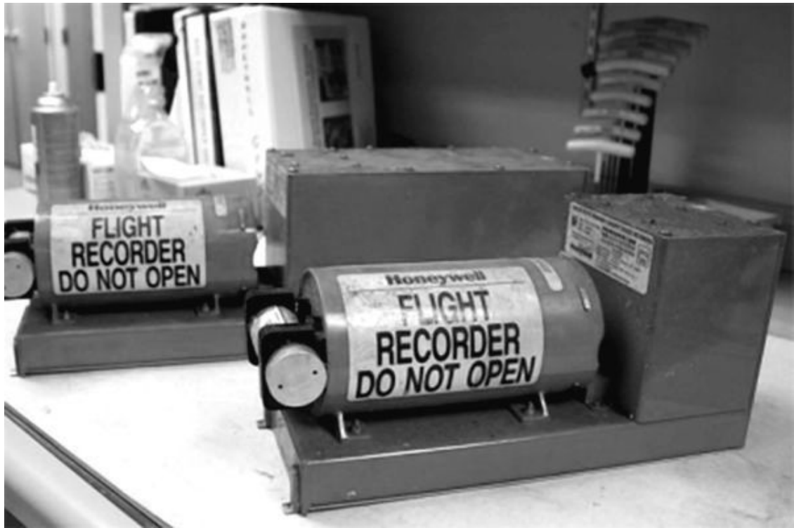
Рис. 47. Черные ящики авиакатастрофы малайзийского «Боинга» с Донбасса