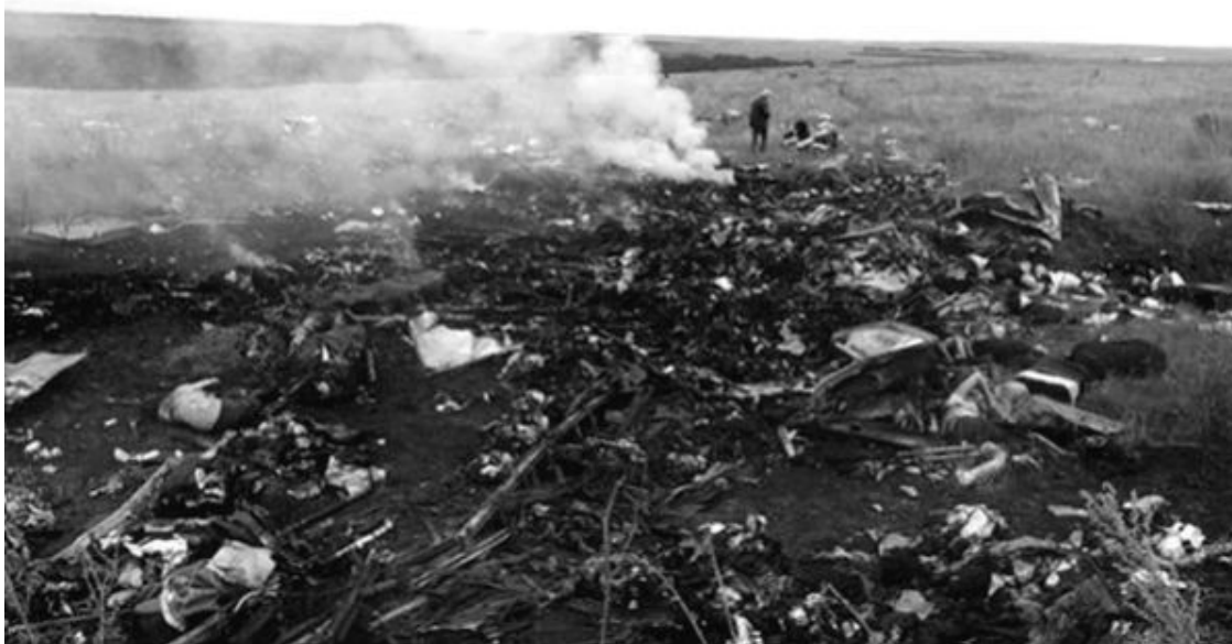
Рис. 14. Практически не обгоревшие тела в центре и по краям второго места пожара

горения керосина топливных баков потерпевших аварию самолетов. Можно согласиться, что, когда самолет целиком падает носом вниз, а на смятую носовую часть падают крыльевые топливные баки, а на них хвостовая часть, то получается хорошо организованный костер, горячие газы от которого поднимаются вверх, втягивая с боков новые и новые порции воздуха. Но и в этом случае алюминий будет в основном плавиться, и уж в любом случае останутся целыми крылья за топливными баками. А по версии нашего случая самолет развалился на куски в воздухе, причем его обломки упали на площади в 50 квадратных километров. То есть можно согласиться с тем, что в местах падения топливных баков некоторая часть конструкций самолета сгорит (окислится), но остальные части планера останутся целыми!