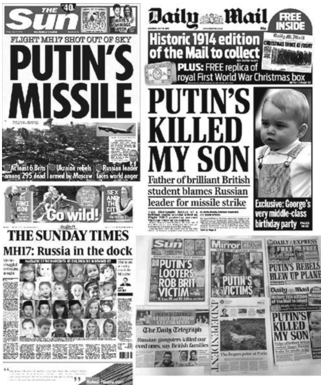
Рис. 1. Анонсы СМИ на Западе

Вкратце о принципе наведения ракеты «Бука» на цель. Она наводится не по тепловому сигналу, как ракеты переносных зенитных комплексов (ПЗРК). После пуска, в начале пути ракету «Бука» ведут к цели по радиокомандам с земли, а на конечном участке ракета сама наводится по отраженному от цели сигналу локатора. Но ракета «Бука» не способна тащить на себе весь локатор, чтобы самой облучать цель, и на ней находится только приемная антенна. А локаторы, облучающие цель, находятся на земле – мощный на СОЦ и слабенький на СОУ. Если они прекратят облучение или отраженный от цели сигнал будет слабый и ракета потеряет его, то она пойдет вертикально вверх и при выработке топлива взорвется.