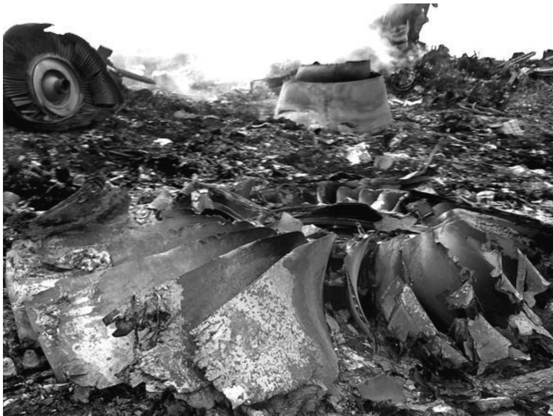
Рис. 21. Повреждения ротора вентилятора двигателя «Rolls-Royce Trent 800»

Наконец, взрыв внутри самолета. Мина будет заложена в какой-то одной части его фюзеляжа, и в месте взрыва ударная волна перебьет балки и сорвет с заклепок листы обшивки. Образуется дыра, и фюзеляж в этом месте разломится, но опять таки на две части, правда, со множеством кусков балок и оторванных листов из места, близкого к расположению мины.