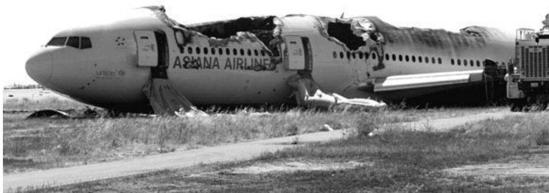
Рис. 45. Боинг 777, потерпевший катастрофу в Сан-Франциско

А чем? Чем могло выдавить не то что металл, а просто остекление иллюминаторов? Ведь на него в полете изнутри давит сила в полтонны избыточного давления в салоне, и ничего с иллюминаторами не происходит – их не выдавливает. При разгерметизации и этой силы уже нет, тогда что выдавило остекление иллюминаторов?