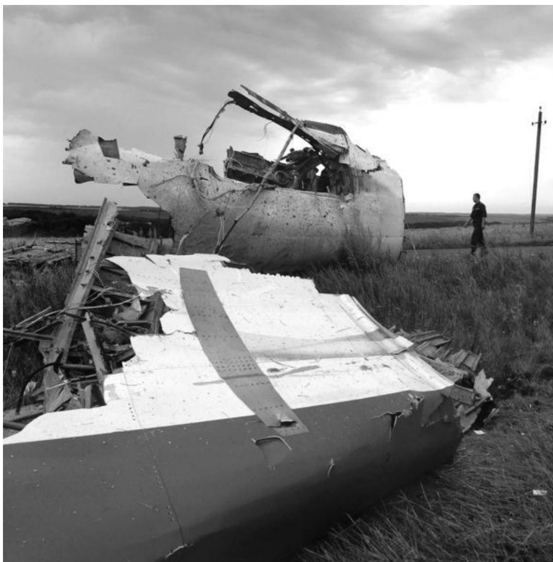
Рис. 37. Ступенеобразные «прокусы» челюстями гидроножниц – левый край, попытка захватить челюстями всю толщину конструкции – продавленный металл «п»-образной формы от давления верхней челюсти правее центра

Это достаточно четкое фото структуры среза (рис. 37).