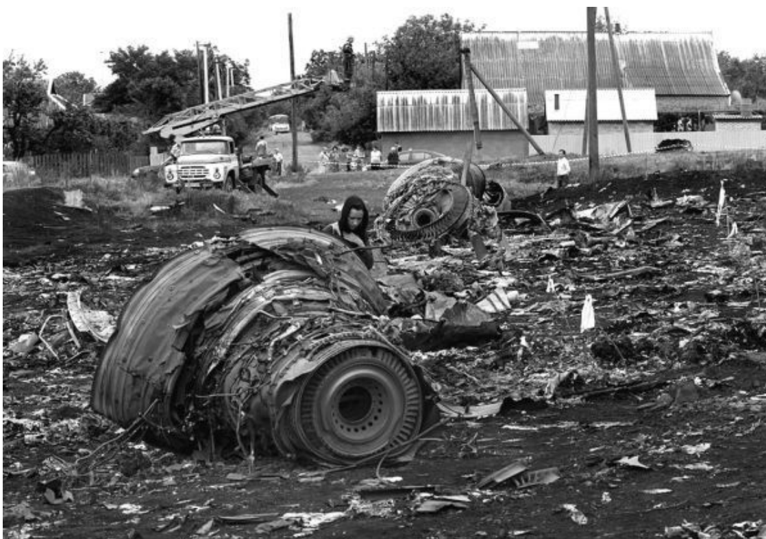
Рис. 17. Детали двигателя «Rolls-Royce Trent 800» без вала, скрепляющего их воедино (на снимке по центру)

В остатках обоих двигателей на месте вала осталось только отверстие, но куда делся сам вал? И кто разобрал в воздухе во время падения самолета на части двигатель, вынув из него