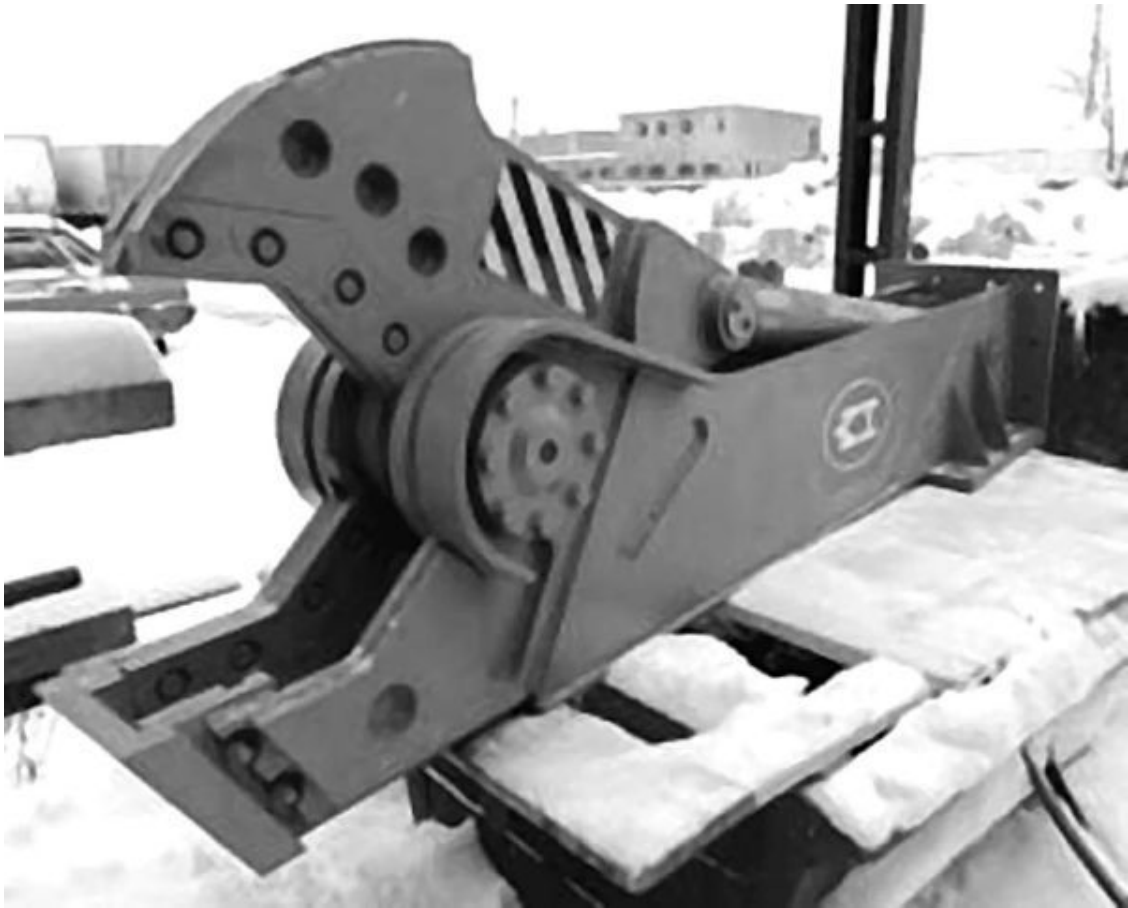
Рис. 27. Рабочий орган машины для разделки машин на металлолом – гидр노жницы

То есть корпус самолета разделяется на части вот такой машиной (рис. 26). Один из вариантов ее рабочего органа – гидравлических ножницы (рис. 27, 28).