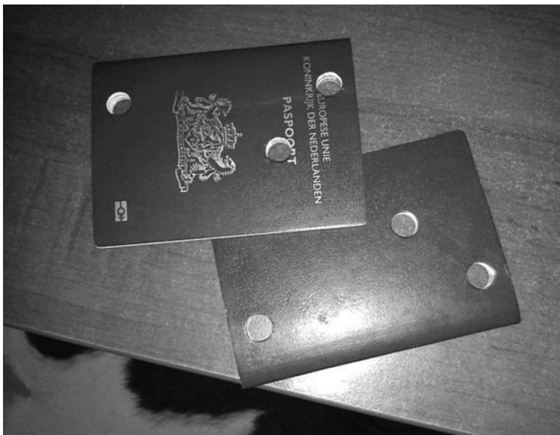
Рис. 49. Отверстия в паспортах, указывающие на их недействительность

И это весь багаж почти 300 пассажиров? Причем, по сообщениям свидетелей, вещи в чемоданах и сумках были неносеными, только купленными. Мне скажут, что багаж разворовали ополченцы. Это вы, будучи на месте катастрофы, обязательно разворовали бы багаж, и я в это поверю. А вот в то, что багаж разворовали ополченцы, перегруженные оружием, бронезилетом и расстреливающие своих товарищей за мародерство, мне не верится.