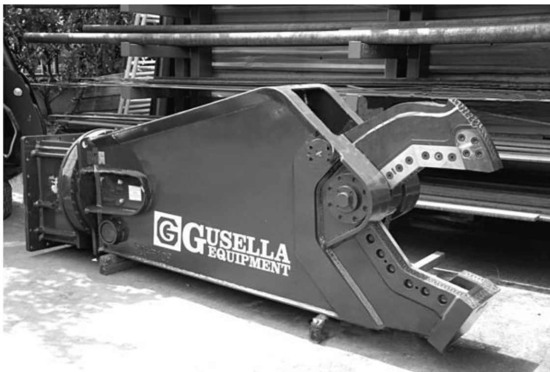
Рис. 28. Рабочий орган машины для разделки машин на металлолом – гидрожницы

Как видите, это огромные ножницы или кусачки, только внизу у них два лезвия, между которыми опускается верхнее. В данной конструкции на верхнем лезвии есть зуб, предназначенный удерживать разрезаемую деталь от выскальзывания из челюстей. Оценим, что если обычные ножницы дают один разрез, то эти как бы вырезают полосу, равную по ширине расстоянию между нижними ножами или ширине верхнего ножа. Есть и варианты конструкции этих ножниц с одной режущей кромкой внизу.