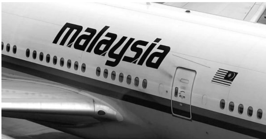
Рис. 42. Фото злосчастного «Боинга 777» рейса МН 17

А вот как это место фюзеляжа выглядит в Донбассе (рис. 43).