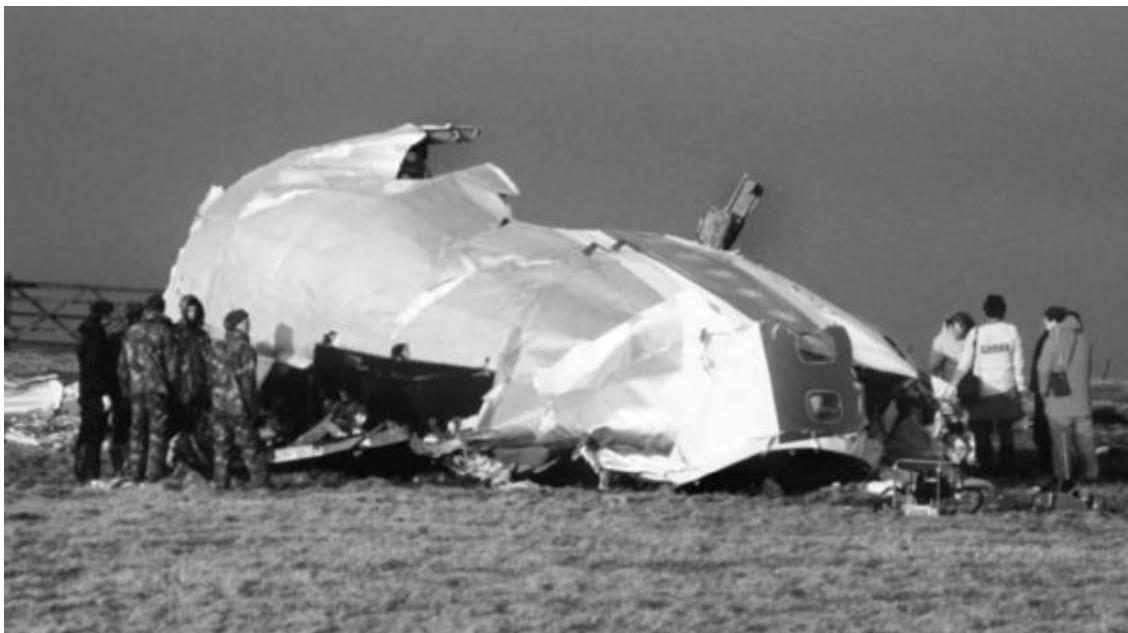
Рис. 24. Еще часть фюзеляжа «Боинга 747», взорванного над Локерби