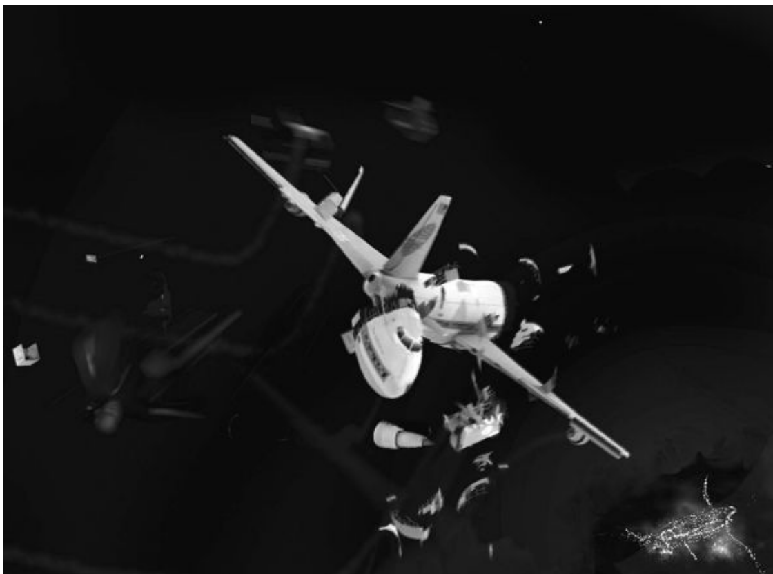
Рис. 22. Реконструкция разрушений «Боинга 747» над Локерби

И только! Самолет не раздробился на мелкие части, как мы это видим на Донбассе. В результате носовая часть упала в 4 километрах от центральной, а 20-метровая хвостовая часть – менее чем в километре (в полумиле). То есть даже взорванный изнутри самолет разделился на три крупные части, которые упали с высоты в 9,5 километра с разносом обломков максимум на 5 километров. Кстати, падал самолет 36 секунд.