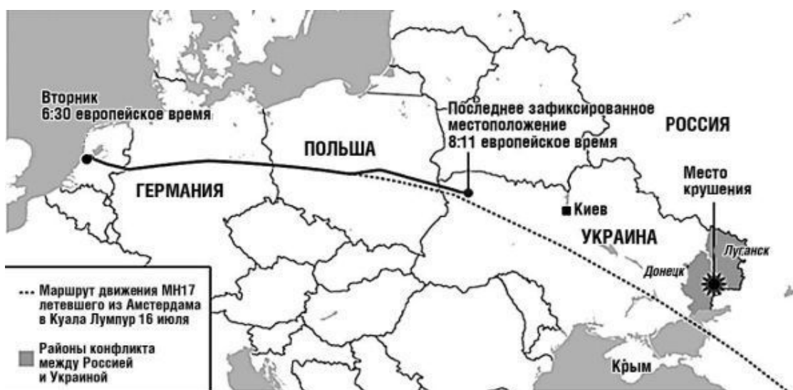
Рис. 4. Маршрут рейса МН 17 16 июля и место нахождения обломков

Мало этого, агентство Рейтер уже на следующий день после инцидента с малайзийским авиалайнером опубликовало карту полета МН 17, из которой ясно, что даже накануне, 16 июля, украинские диспетчеры маршрут этому рейсу прокладывали, минуя Донбасс.