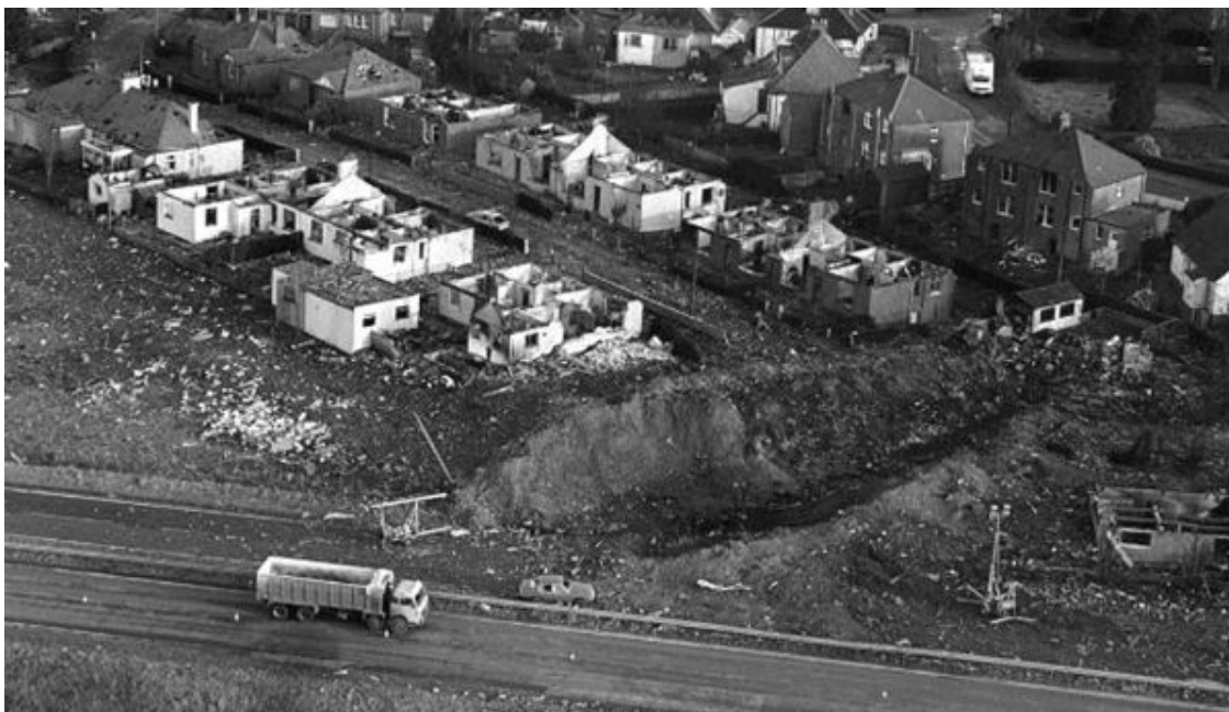
Рис. 7–8. Место падения центральной части «Боинг 747» в Локерби