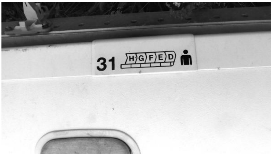
Рис. 41. Способ крепления таблички с номером ряда на багажных полках в обломках

То есть это совершенно иная конструкция багажных секций, явно непохожая на багажные секции рейса МН 17.