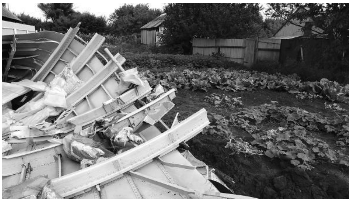
Рис. 40. Ровный обрез шпангоутов

Дело в том, что самолеты – это штучное сооружение, строятся они долго, и даже в одном типе машин и одной серии в каждом самолете могут быть иные детали его конструкции, не влияющие на технико-технические характеристики, – иное планирование салонов, иные кресла, иные светильники, иная раскраска и т. д.