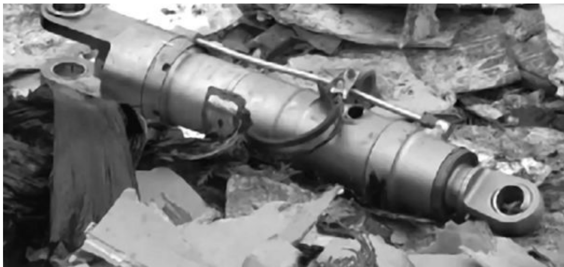
Рис. 20. Гидроцилиндр с извлеченными из проушин пальцами лежит на мелких клочках дюралюминия корпуса самолета

Скажем, у самолета на крыльях есть закрылки, которые выпускаются во время взлета, чтобы увеличить подъемную силу крыла. Эта сила, действующая на крылья, зависит от скорости самолета, а при взлете скорость невысока, поэтому места крепления крыльев к фюзеляжу способны эту силу выдержать. Но был случай, когда у летящего на крейсерской скорости «Ту» вдруг вышли закрылки. Подъемная сила крыльев резко возросла выше пределов, на которые было рассчитано их крепление к фюзеляжу, и крылья оторвались. Однако при таких авариях самолет развалится на крупные фрагменты и крупными фрагментами упадет на землю. Грубо говоря – самолет сломается, как вы руками сломаете игрушечный пластмассовый самолет.