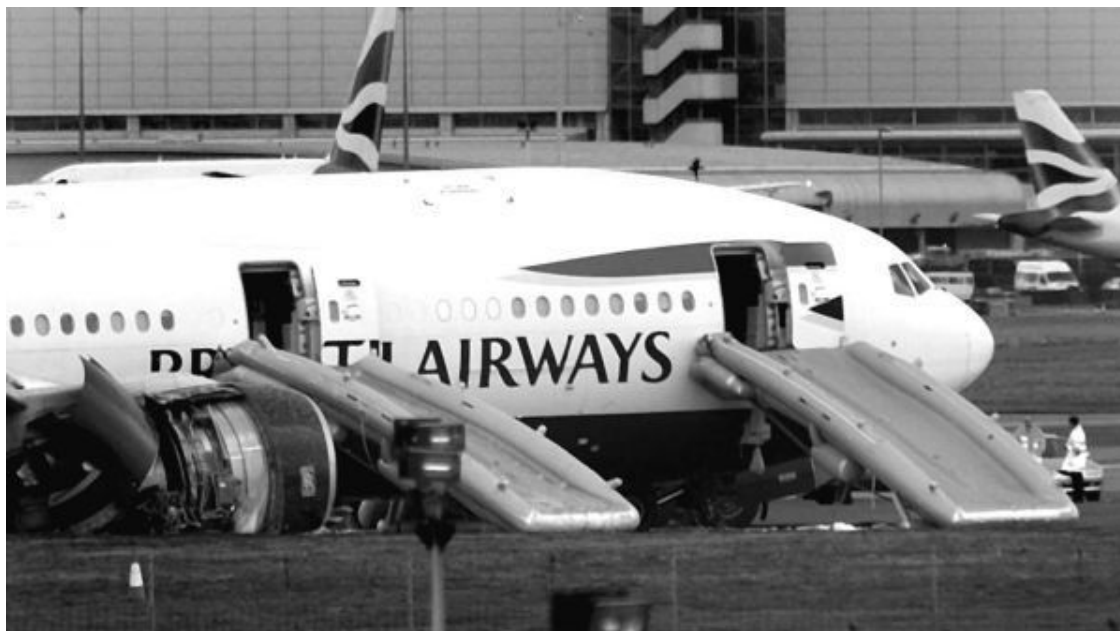
Рис. 44. Боинг 777, потерпевший аварию в аэропорту Лондона

Правда, если вы присмотритесь к четкому фото на рис. 45, то увидите, что и в малайзийском Боинге в этом месте предполагались иллюминаторы, но они были наглухо заделаны и окрашены вместе с корпусом, поскольку в том типе «Боингов 777», который закупила «Malaysia Airlines», всего 300 мест и в этой части салона находятся туалеты.