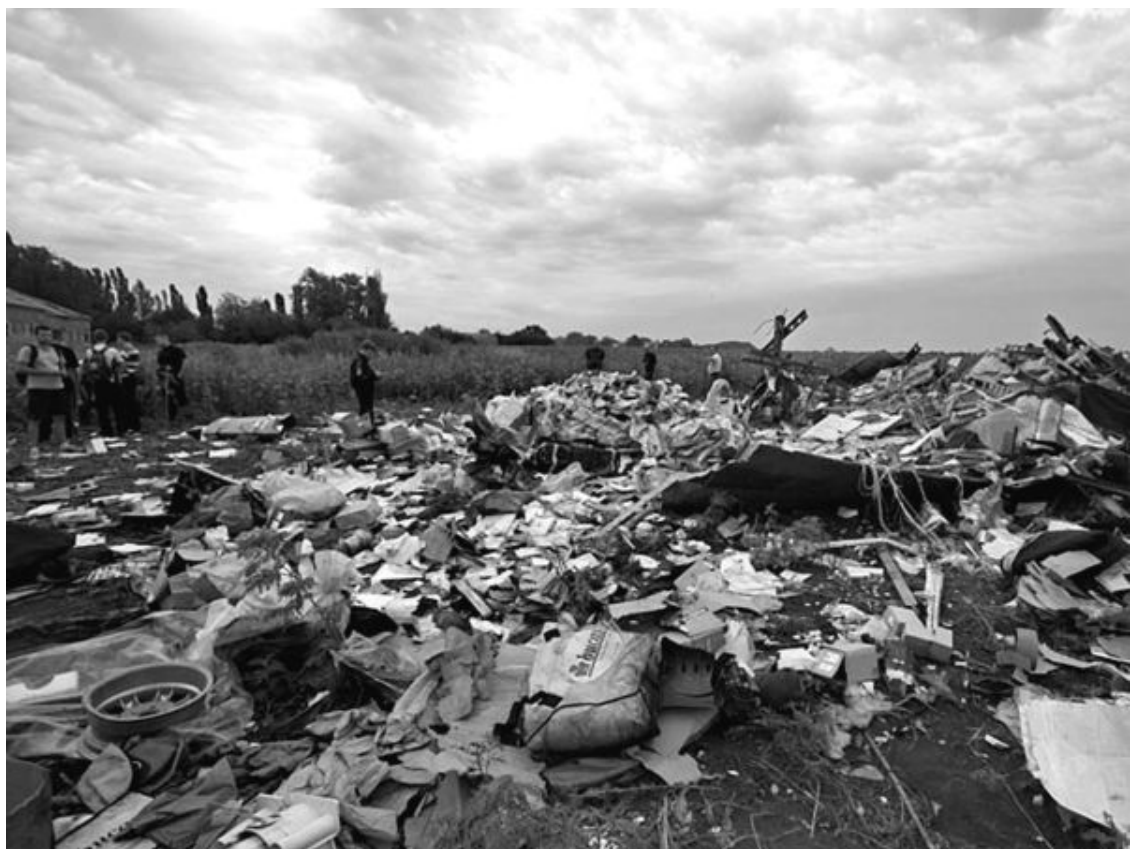
Рис. 48. Содержимое малайзийского Боинга

Если это был пассажирский самолет, то он вез людей и их багаж. Но на фото мы видим кучу, оставляющую впечатление разгруженного мусоровоза (рис. 48).