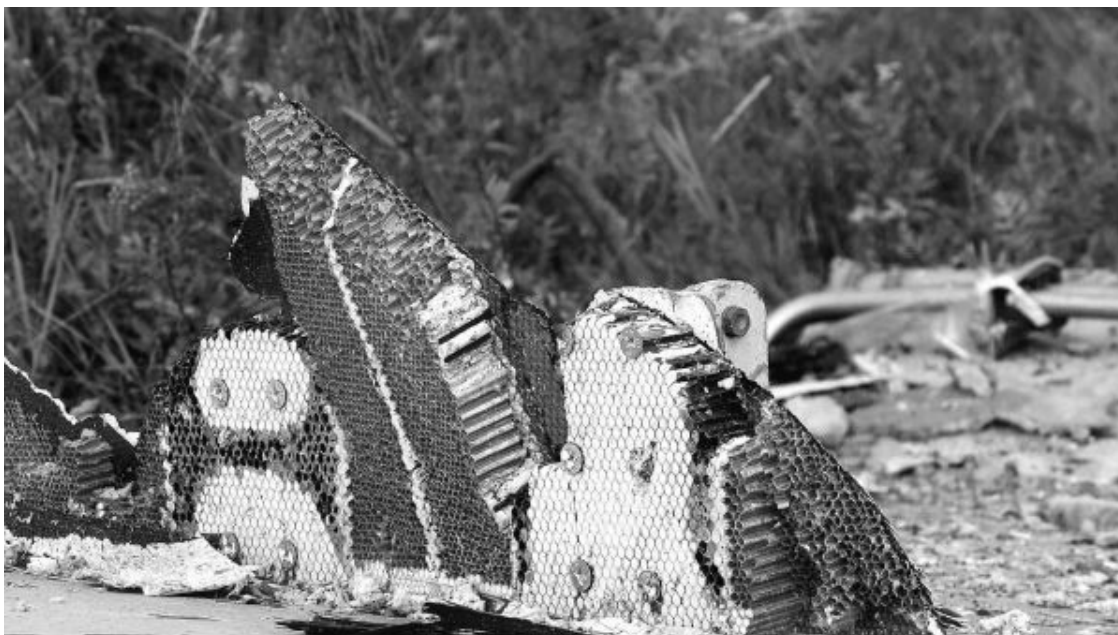
Рис. 35. Фрагмент с внутренней термоизолирующей и несущей обшивкой самолета

Поясню: металлолом предназначен для переплавки, а если в печь попадет вместе с металлом и пластик, то он загрязнит металл вредными примесями. Поэтому на складе металлолома пластик от металла отодрали. Единственный кусок, который на складе металлолома по недосмотру пропустили.