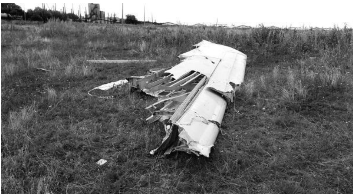
Рис. 33. Часть крыла или хвостового оперения