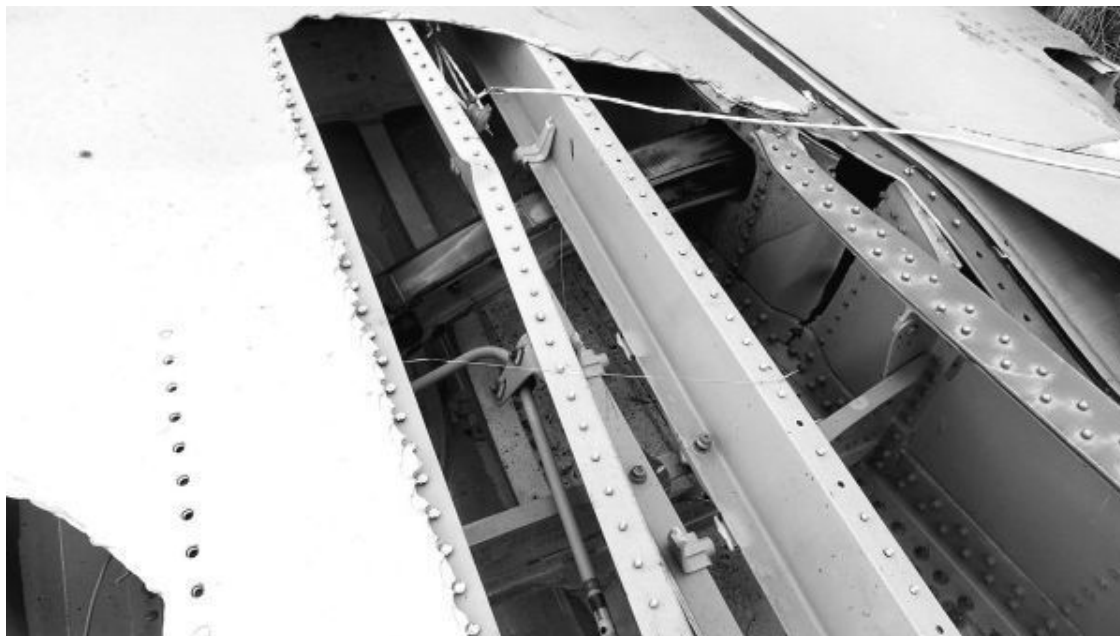
Рис. 34. Повреждения несущей плоскости

Зададим себе вопросы: во-первых, какая сила могла оторвать саму плоскость, во-вторых, какая сила могла сорвать дюралюминиевый лист обшивки с сотен заклепок, разорвать его «по живому» вдоль и, наконец, отломать? Взрыв внутри плоскости? Сила напора воздуха при падении самолета? Глупости! Только клещи гидронежниц при разборке самолета для его утилизации.