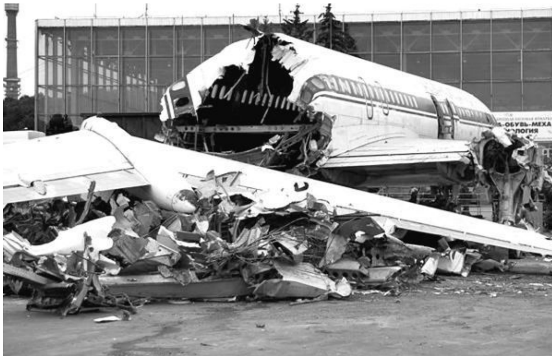
Рис. 29. Разрезка и разрывание самолета на металлолом гидронежницами

Это одно фото из подборки «Утилизация самолетов на ВДНХ» 20 . Причем в рекламных целях тут самолет рвут на очень мелкие части, а по американской технологии самолет рвут всего лишь на крупные куски, достаточные для отгрузки автомобилями на специализированный завод для дальнейшего дробления и переработки этих кусков. Кроме того, самолеты режут на куски и вручную, используя инструмент, который у нас называют «болгаркой».