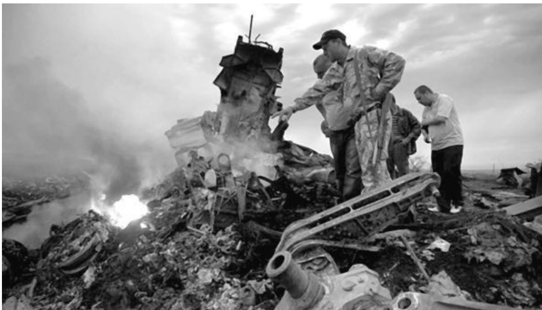
Рис. 19. Оси не вырваны, а вынуты из проушин и посадочных мест

Если мы еще раз взглянем на фотографию гидроцилиндра, то увидим, что он лежит на очень мелких кусочках дюралюминия корпуса самолета. Что его так мелко порвало? Давайте об этом.