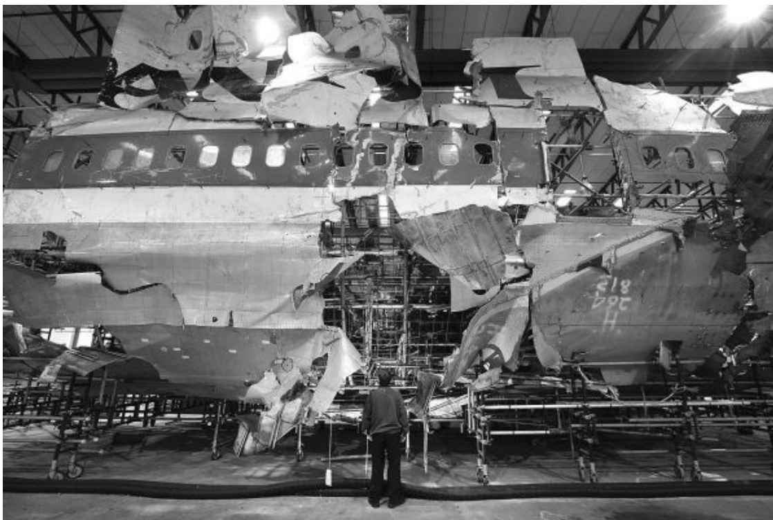
Рис. 25. Восстановление следователями корпуса разрушенного Боинга 747

Размер и вид обломков корпуса, из которых англичане реконструируют весь корпус взорванного «Боинга 747», показаны на рис. 25.