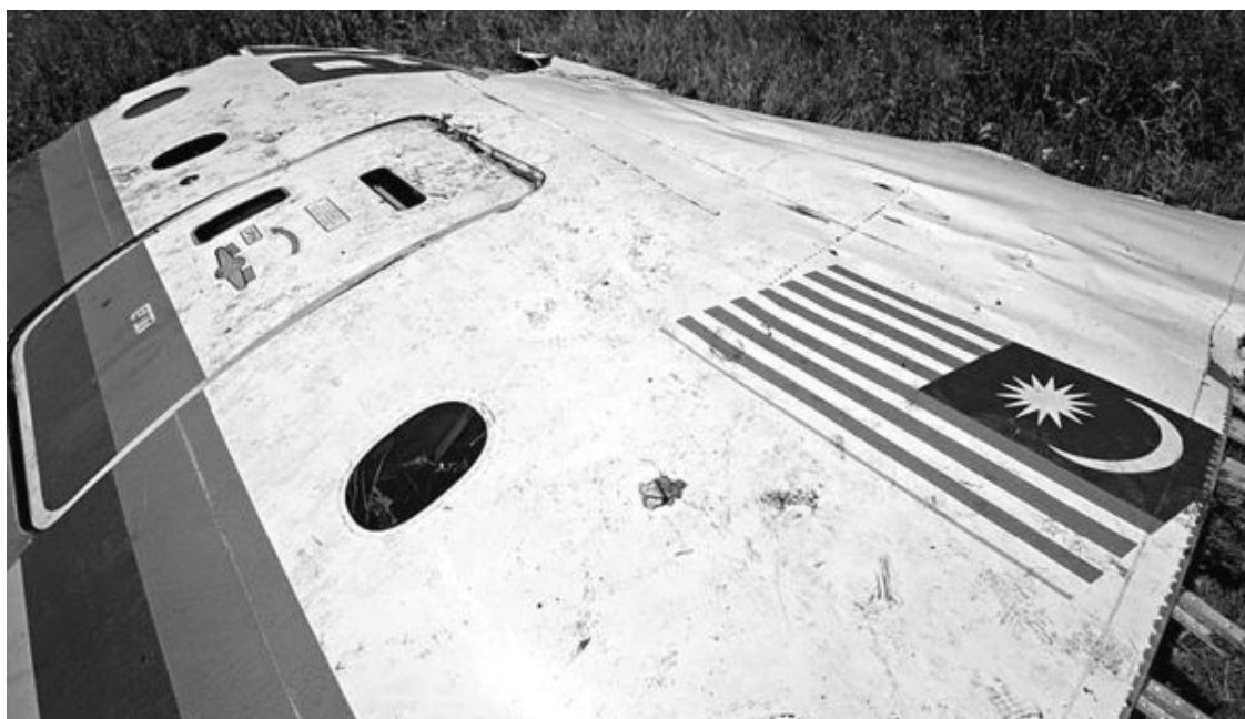
Рис. 43. Дверь «Боинга 777», упавшая на Донбасс

Как видим, буква «а» слова «Malaysia» не доходит до последнего перед дверью иллюминатора, двери имеют еще и горизонтальную темную выемку вверху, под малайзийским флагом появился еще один иллюминатор.