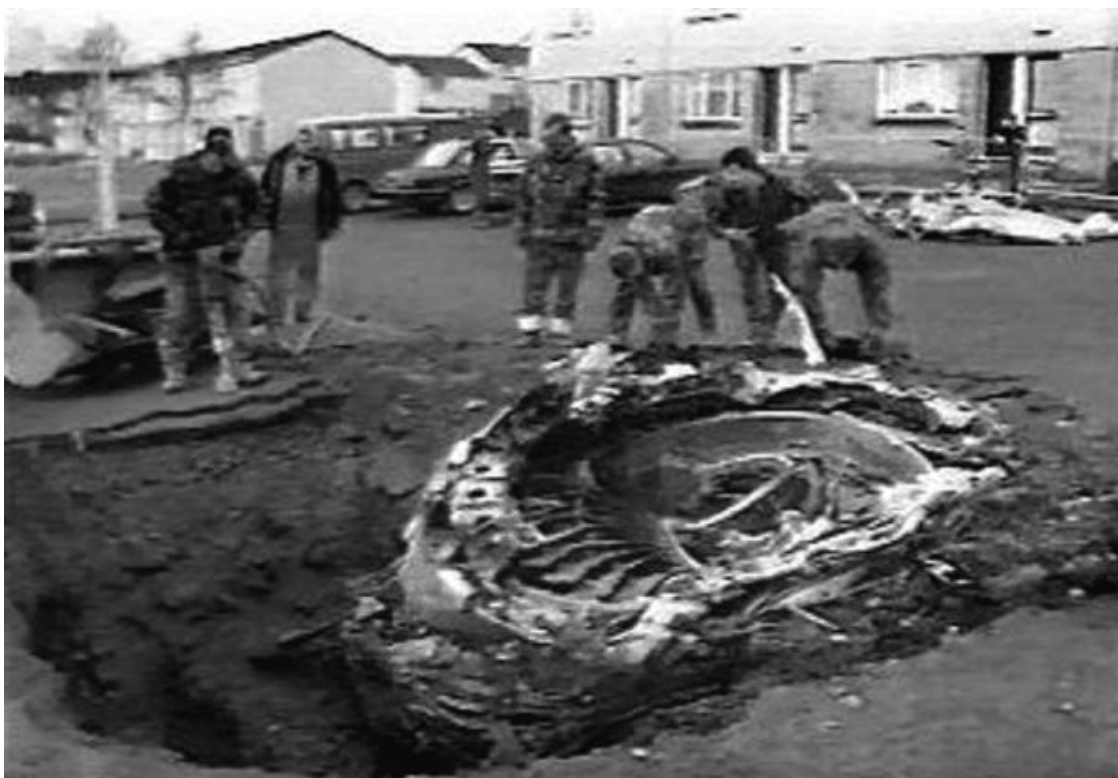
Рис. 12. Второй из из четырех двигателей «Pratt & Whitney JT9D» «Боинга 747», взорванного над Локерби