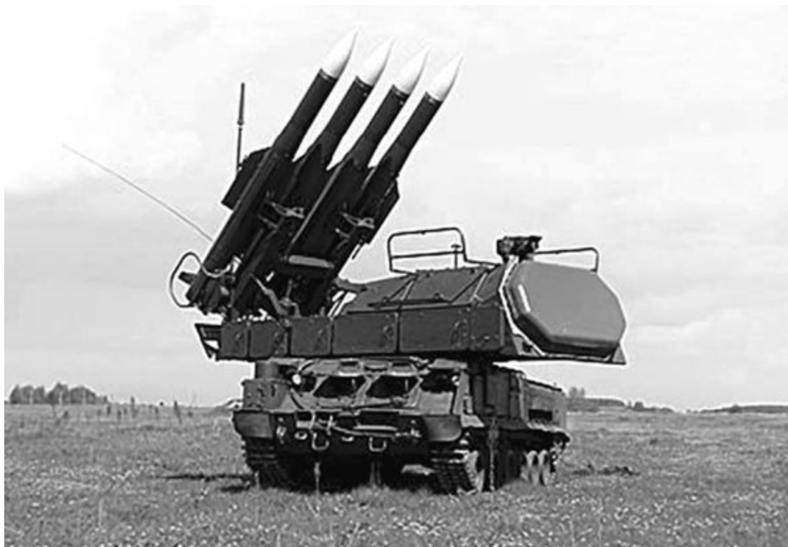
Рис. 2. Самоходная огневая установка зенитного ракетного комплекса «Бук»

Этим локатором очень трудно обнаружить цель и так же трудно облучить ее достаточно мощным сигналом, чтобы ракета «Бука» ее обнаружила и не потеряла. Если в составе батареи СОЦ есть, как у карателей на Донбассе, то ракеты СОУ «Бука» могут поразить даже такую малоразмерную цель, как истребитель, на дальности в 50 км и на высоте в 16 км. Но если СОУ действует в одиночку, как это приписывают ополченцам, то тогда, при высоте целей выше 3 км, ЗРК «Бук» удавалось сбить цель с вероятностью 0,70—0,93 только в случае, если дальность до цели не превышала 20,5 км, а некоторые цели удавалось сбить только при дальности до них 3,4 км.