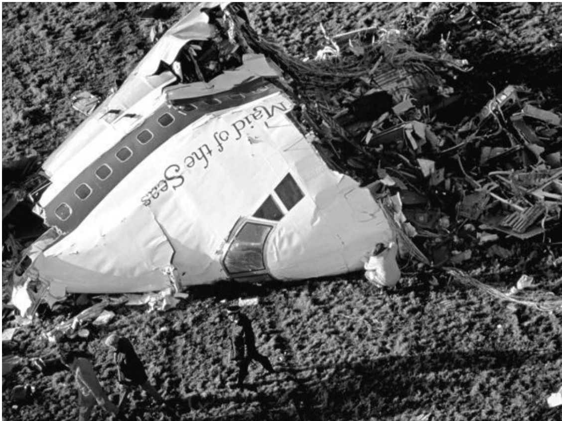
Рис. 23. Носовая часть фюзеляжа «Боинга 747», взорванного над Локерби