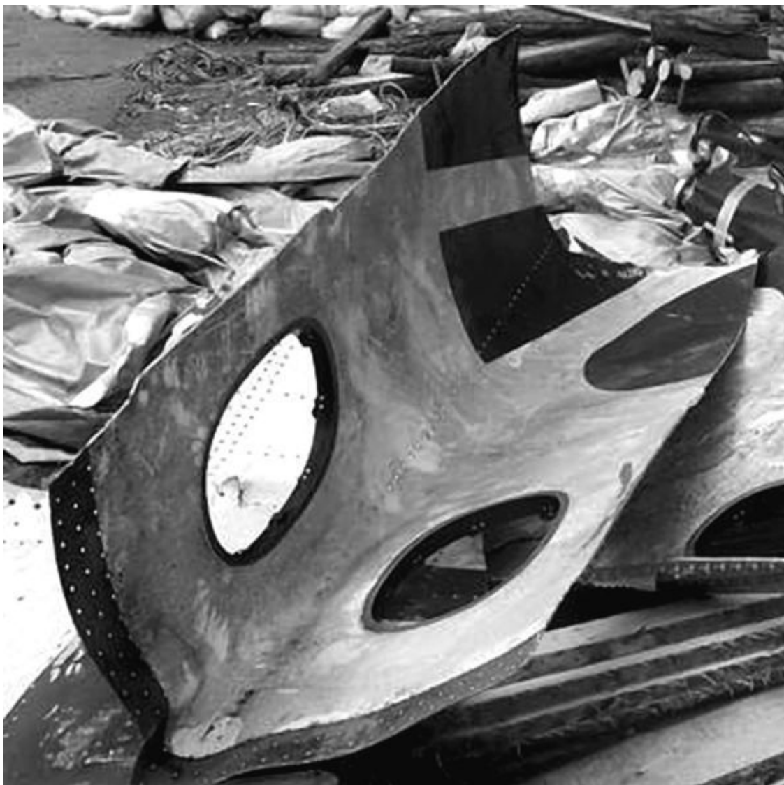
Рис. 32. Фрагменты «Боинга 777» на Донбассе