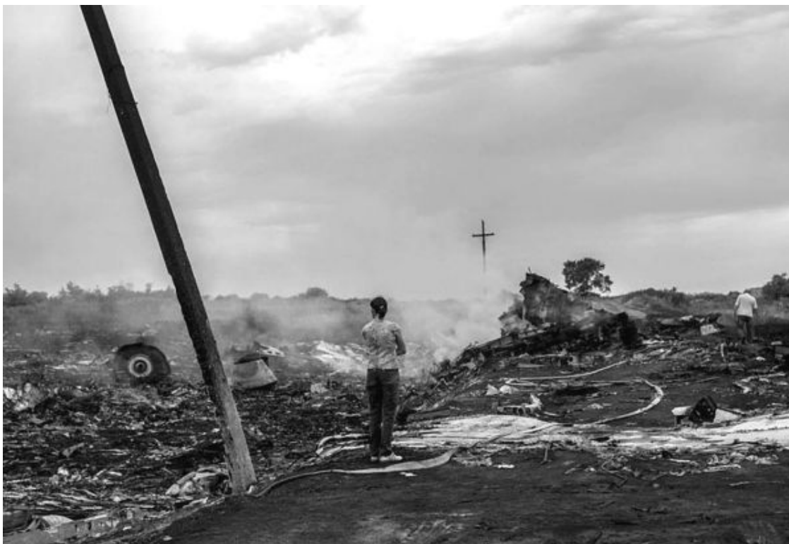
Рис. 10. Место падения малайзийского «Боинга 777» у села Грабово. Снимок с земли

Где на этих фото хоть какой-то след на дороге от удара 300 тонн? Даже бетонный столб, который легко сносит легковой автомобиль, остался целым и лишь слегка наклонился!