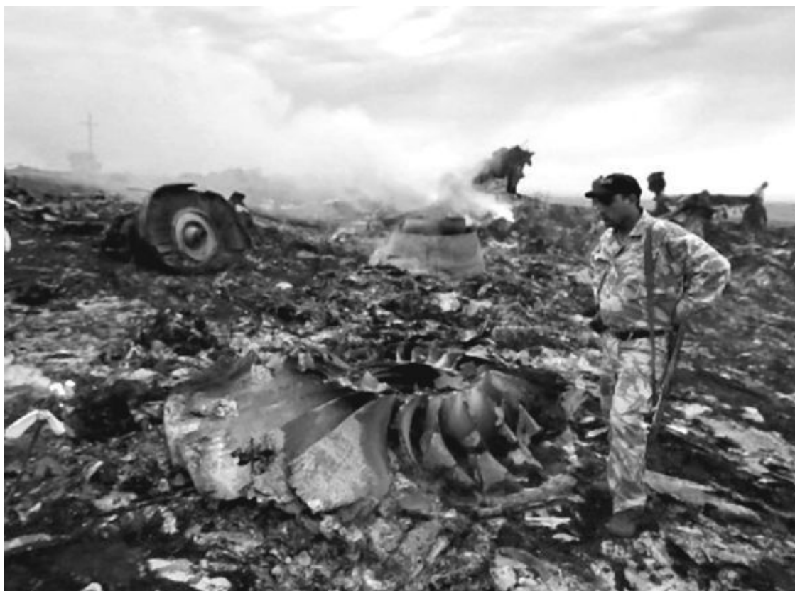
Рис. 18. Детали двигателя «Rolls-Royce Trent 800» без вала, скрепляющего их воедино

Обратим внимание на лопатки. «Они изготовлены из титанового сплава, внутри пустотельные и упрочнены по принципу фермы Уоррена (Warren girder – решетка из равносторонних треугольников). Это делает их прочными, жесткими и одновременно легкими» 16 . Титан (температура плавления 166 °С) концов лопаток выглядит так, как будто он окислен, что возможно только при очень высокой температуре. Но каким образом можно нагреть и так окислить ротор? Если бы ротор вентилятора весь был в огне пожара, то окислились бы лопатки полностью до места их крепления, окислилось бы и само кольцо, в котором они крепятся. Но эти места не повреждены огнем! На мой взгляд, так повредить ротор можно только в случае, если костер специально развести вокруг лежащего на земле ротора, а не положить ротор в костер. Возможно, концы лопаток грели газовой горелкой, возможны и иные рацпредложения, но этот ротор поврежден не пламенем пожара самолета, в противном случае он бы окислился весь.