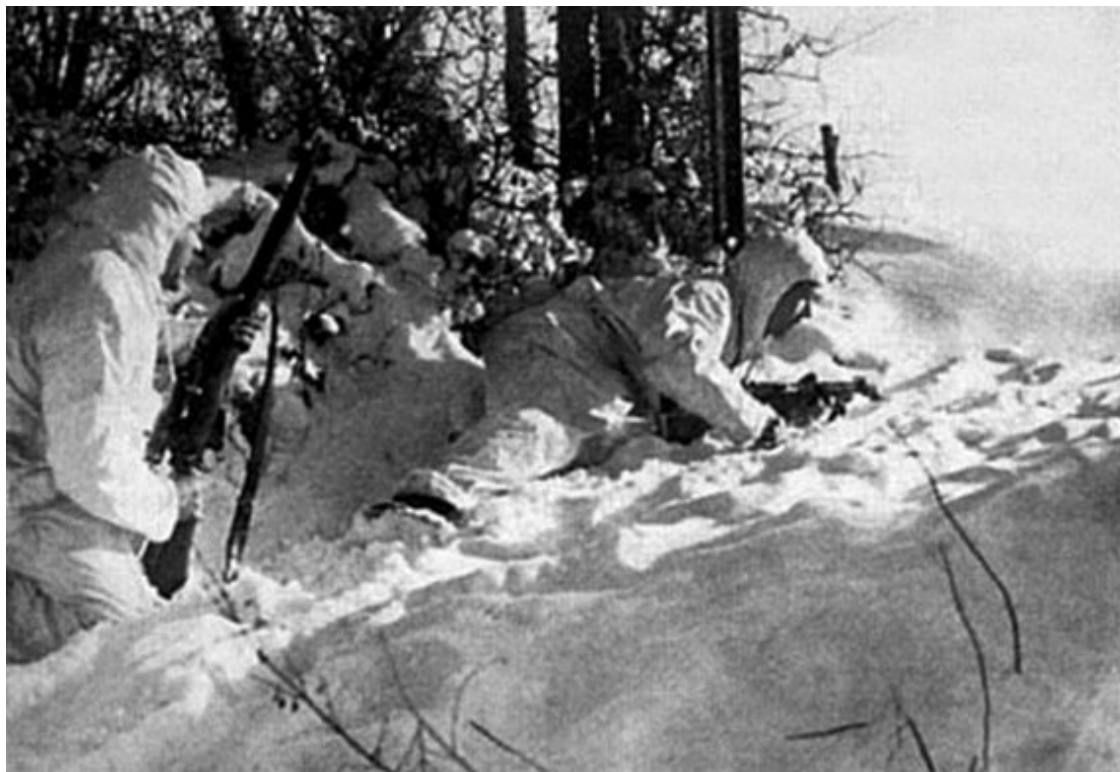
Финская снайперская пара на позиции. Карельский перешеек, 1940 г.

Зато в это же время снайперы входили в моду в стране, практически не применявшей их на фронтах Первой мировой войны, – в России. Большевики ожидали новой интервенции, поэтому активно перенимали боевой опыт западных армий. Уже в 1924 году появляется русский перевод книги Хескет-Притчарта, не оставшейся незамеченной военными специалистами.