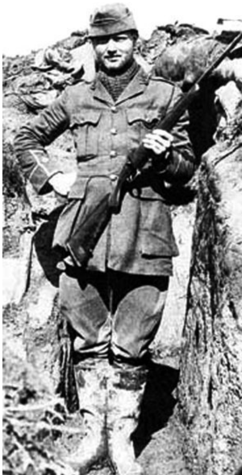
Английский «меткий стрелок». 1916 г.

Вот как описывает действия германских снайперов Э.-М. Ремарк в романе «На Западном фронте без перемен»: «У брустверов стоят несколько снайперов. Пристроив свои винтовки с оптическими прицелами, они держат под наблюдением большой участок вражеских позиций. Время от времени раздается выстрел.