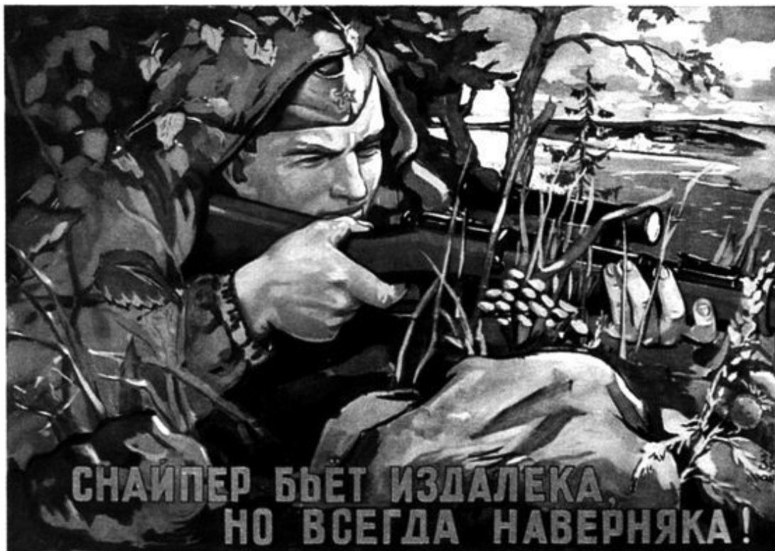
«Снайпер бьет издалека, но всегда наверняка!» Советский плакат. 1942 г.

В первые месяцы войны подготовка лучших стрелков была заботой частей и соединений передовой линии фронта. Обучение шло в запасных учебных частях, на краткосрочных курсах непосредственно в боевых порядках войск, велось путем непосредственного общения лучших снайперов части со своими товарищами и их совместными выходами на боевые позиции. Такая форма общения имела как положительные стороны, так и недостатки. Никакая теория не может заменить практику – работу снайпера в боевых порядках своего подразделения. Процесс приобретения боевого опыта гораздо эффективнее, когда рядом с обучаемым находится опытный наставник.