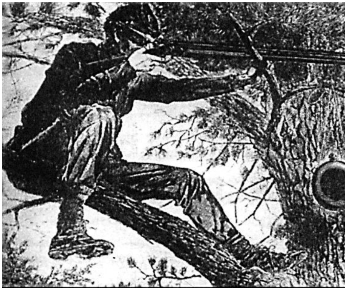
Снайпер с капсюльной винтовкой, оснащенной телескопическим прицелом

Историк оружия В.Е. Маркевич также отводил войне в Южной Африке важную роль в развитии тактики ружейного огня вообще и снайперской стрельбы в частности: «В период бездымного пороха, во время англо-бурской войны (1898–1902) оказалось, что искусные стрелки-охотники буры, защищая свою независимость, наносили английской армии существенный урон преимущественно винтовочным огнем. Совсем не имея штыков, а под конец не имея и артиллерии, они затянули войну на 2,5 года, и только крайнее истощение заставило буров капитулировать перед громадной английской армией.