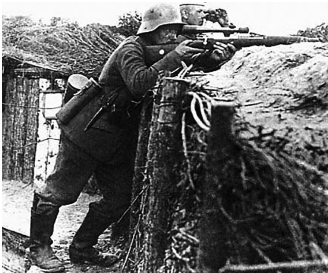
Германский снайпер в передовой траншее. Западный фронт, 1915 г.

В поисках истоков снайпинга можно глубоко забираться в историю, но целенаправленное использование «охотников в униформе» и установка оптических прицелов на винтовки начались только в Первую мировую войну, хотя отдельные случаи использования винтовок с оптическим прицелом имели место еще в русско-японскую. Русская армия, уделявшая «цельной стрельбе» немалое внимание, проявила интерес и к «прицельным ружейным трубам», появившимся в обиходе стрелков-спортсменов и охотников. Незадолго до Первой мировой проводились опыты по приспособлению оптических прицелов Герца на трехлинейку, но никакого решения принято не было. Между тем германцы уже в 1915 году применяли на фронте винтовки с прицелами Цейсса. Союзники России также стали применять подобное оружие и те же приемы. В военном лексиконе утвердилось английское слово «снайпер» – «охотник на бекасов», или «стреляющий из укрытия». Наконец, в начале 1917 года ГАУ дало Обуховскому заводу наряд на прицелы Герца. Но крайне ограниченные финансовые возможности и сырьевая база государства с трудом покрывали даже потребности флота и артиллерии, так что снайперской винтовки русская армия так и не получила.