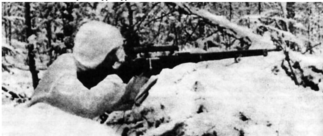
Зимняя маскировка снайпера

Во время финской войны советские командиры столкнулись с необъяснимым и страшным явлением – снайперами-«кукушками». Работа их была необычайно эффективна и признана наиболее результативной снайперской практикой. Боевая тактика снайперов-«кукушек» была непонятной своей нестандартностью, неуставностью и коварством. Финны первыми указали на то, что запрещенных приемов в снайперской практике нет. Приемам этим не было числа, и они мало повторяли друг друга.