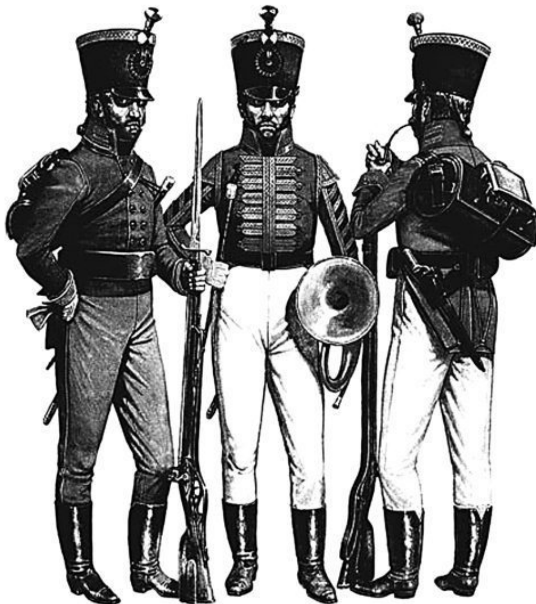
Егеря, вооруженные нарезными ружьями. Россия, XIX в.

новка требовала «легкой и способнейшей пехоты для употребления ее с авантажами по военному искусству, на тамошней земле, состоящей из великих каменных гор, узких проходов и больших лесов...». Такие части, сформированные и обученные по методике Панина, получили название «егерские». После того как сформировали первый опытный егерский батальон, было принято решение о создании специального егерского корпуса численностью 1650 человек. По указанию Панина в егеря отбирались только люди малорослые – не более 2 аршин и 5 вершков (около 167 см), способные к самостоятельным действиям в рассыпном строю и хорошего здоровья.