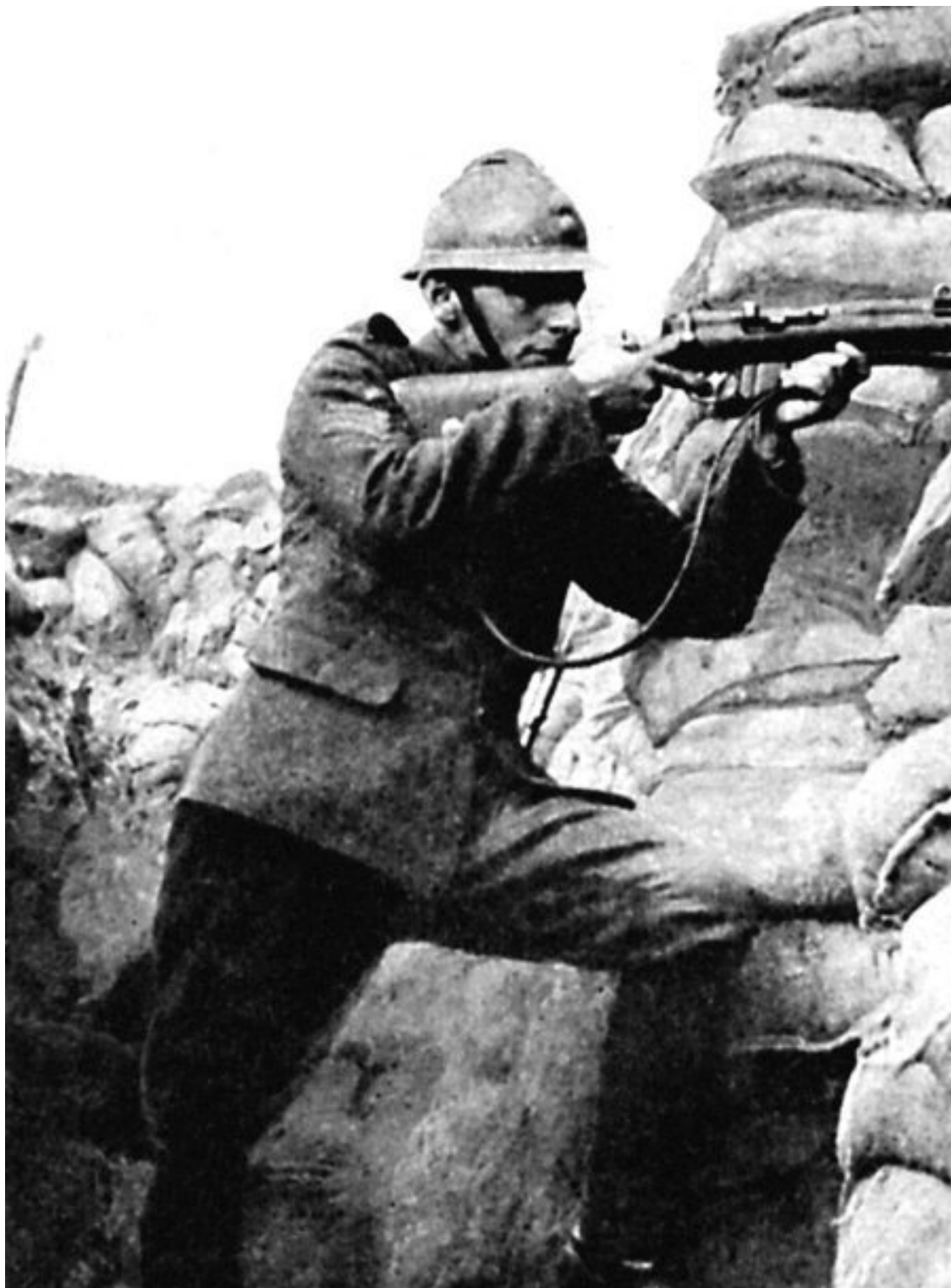
Французский снайпер поджидает жертву. 1916 г.

Правда, в начале 1914 года, т. е. еще до вступления России в мировую войну, на полигоне Офицерской стрелковой школы в г. Ораниенбаум был испытан на трехлинейной винтовке оптический прицел системы Герца. Однако только в конце 1916 года прицелы этой системы, производившиеся на Обуховском заводе, были признаны пригодными для использования в войсках. Первые 20 изготовленных прицелов передали для «обкатки» в ту самую роту Измайльского полка, которая была первым в мире подразделением автоматчиков, име-