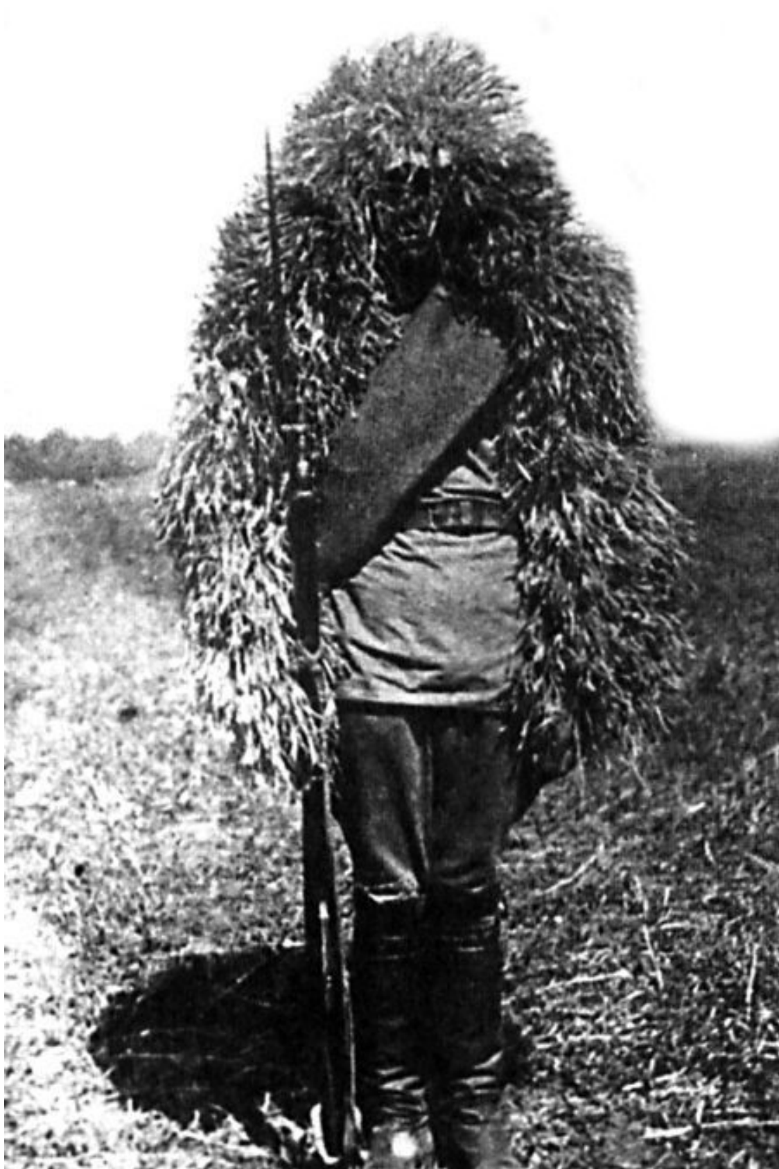
«Маскировочная накидка». СССР, 1932 г.