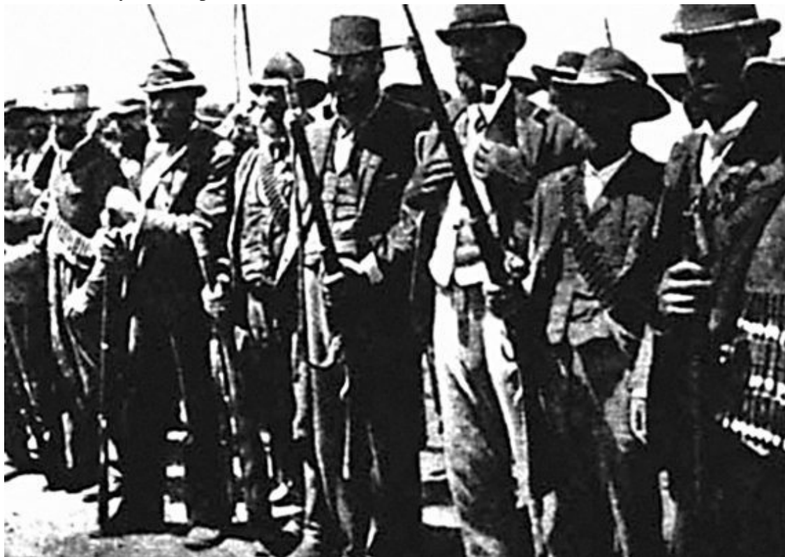
Бурские стрелки со своими дальнобойными винтовками. Южная Африка, 1900 г.

Как уже отмечалось выше, «снайпер» означает «меткий стрелок по летящим уткам». Когда-то в Англии так называли удачливых охотников. Потом так стали называть бурских стрелков. И этому были причины.