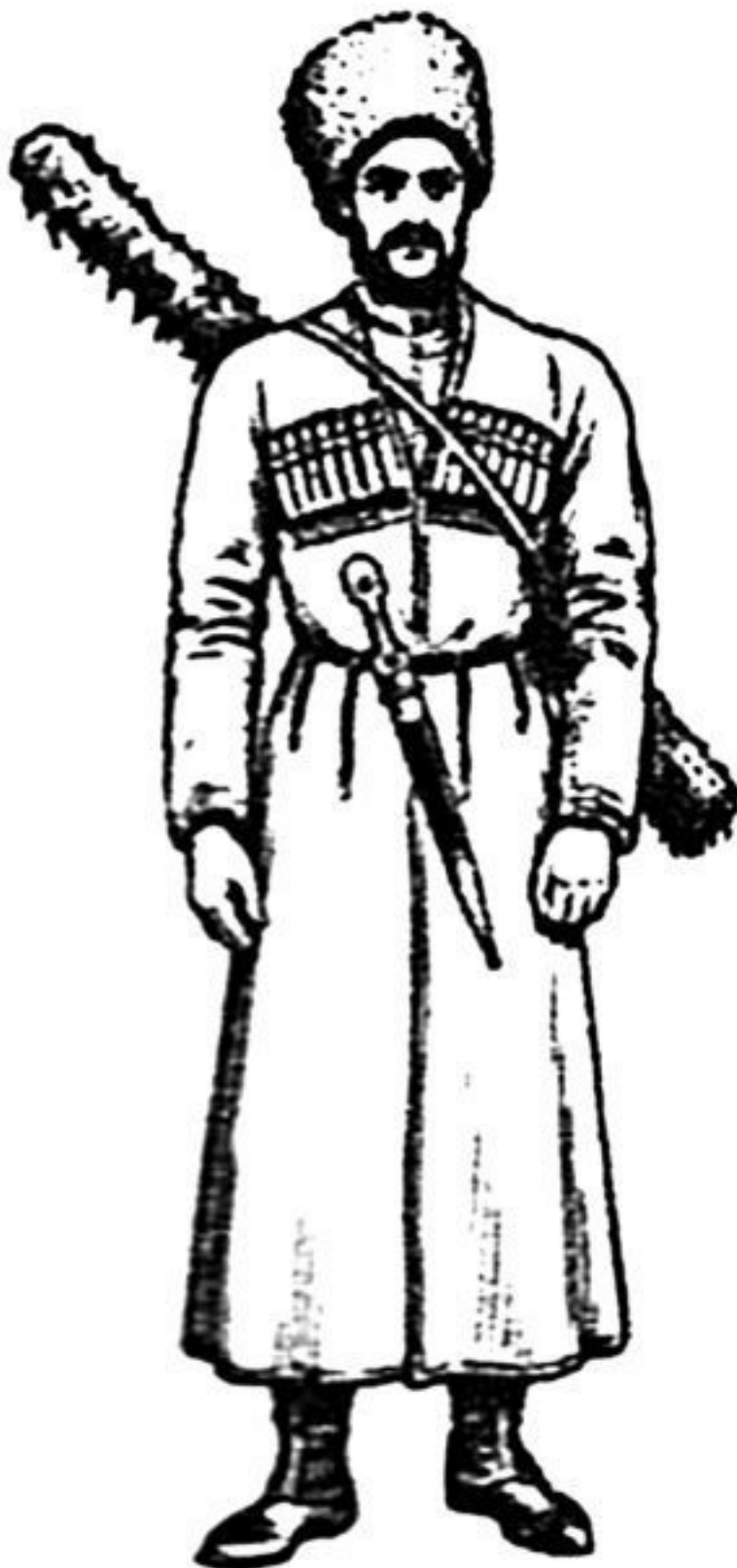
Казак-пластун Черноморского войска. Россия