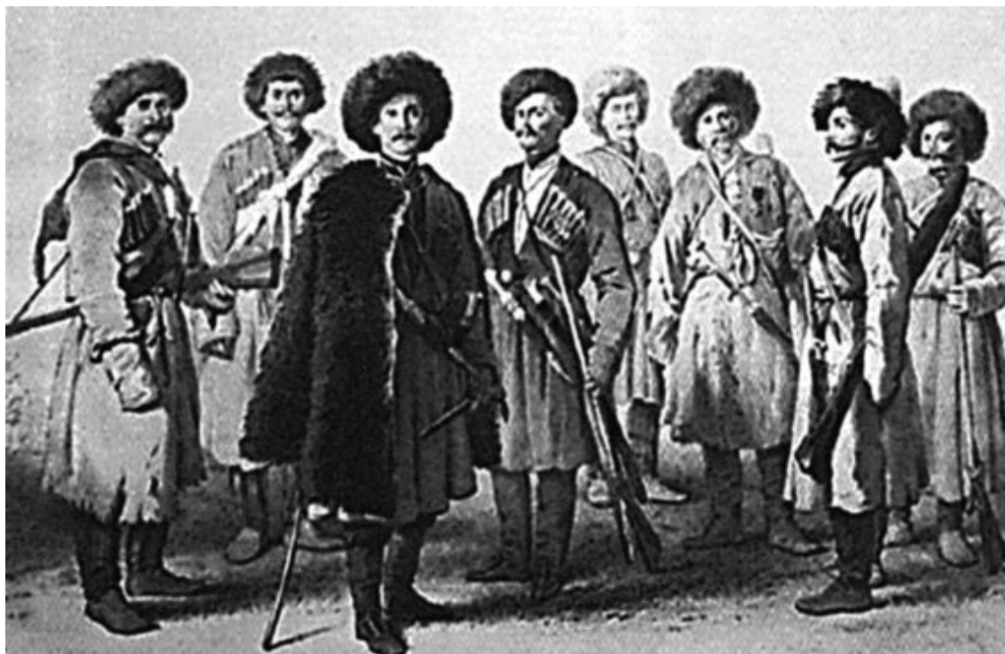
Пластуны. Россия, 1842 г.

Только в середине XIX века русская армия получила штатную 6-линейную пехотную винтовку образца 1856 года. Она, правда, как и раньше, предназначалась для оснащения только отборных стрелков, но все равно это был большой шаг вперед. Прицельная дальность винтовки – до 1200 шагов. Кстати, именно в 1856 году введено официальное название нарезного ружья – «винтовка».