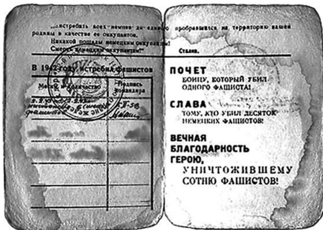
Снайперская книжка. РККА. ВОВ

В другом случае разведгруппа, ползавшая каждую ночь по нейтральной полосе, обнаружила в небольшой заброшенной траншее за мелким кустарником стреляные гильзы, утоптаный грунт и карточку огня с нанесенными на ней ориентирами на нашей стороне и обозначенными дистанциями до них. На всякий случай возле этой позиции задержались, и не напрасно – перед рассветом туда приполз немецкий снайпер, которого повязали и притащили на свою сторону. Его напарника тихо зарезали рядом на запасной позиции, которая тоже была отмечена на карточке огня. Немец для облегчения своей работы оставлял такие карточки на каждой позиции, чтобы не таскать их с собой, и составлял их очень пунктуально, что и подвело его напарника. На позиции нельзя оставлять ничего привлекающего внимание, даже стреляных гильз. На карточках огня запрещается делать обозначения чего-либо, находящегося на своей стороне. Нельзя все время выходить на одну и ту же позицию. Но не только наши захватывали немецких снайперов при ночных выходах. Немало и советских, не придавших таким вещам никакого значения (это русская ментальность), попало в плен именно таким образом. Однажды наш снайпер выбросил ненужную ему примитивную карточку огня с обозначенным на ней немецким наблюдательным пунктом. Карточку подобрал немецкие разведчики, и через сутки этот снайпер попал в немецкую засаду, устроенную перед этим наблюдательным пунктом. Следует запомнить: на войне нет мелочей ни в чем. Случайность – это следствие оплошности.