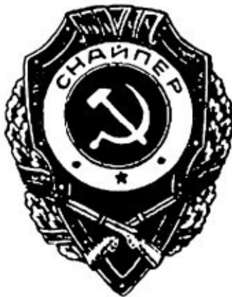
Советский нагрудный знак «Снайпер»

В книге В. Зайцева описан момент, как 13 наших снайперов загнали назад в окопы атакующий немецкий батальон. А также как наши снайперы обороняли Мамаев курган. А вот другой случай.