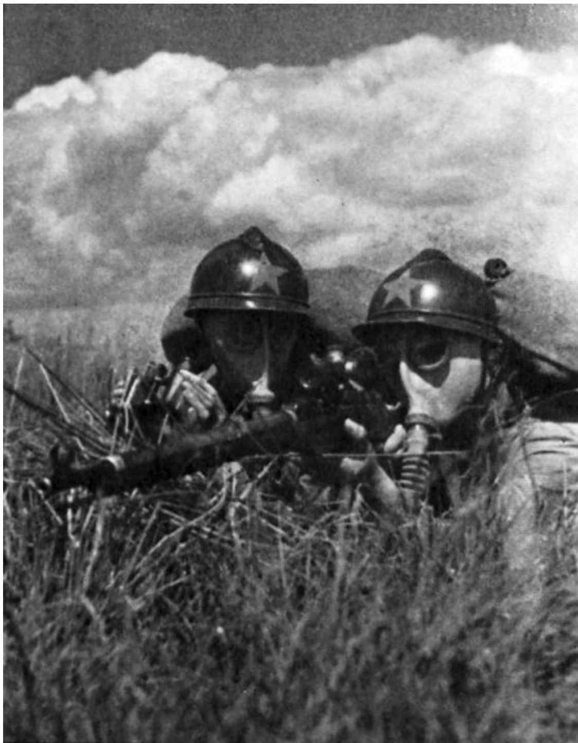
Снайперский расчет РККА отражает «химическую атаку» противника. Маневры 1934 г.

Интересно, что с учетом низкого образовательного уровня красноармейцев для решения задач по выбору точки прицеливания по различным целям на разные дистанции в наставлении рекомендовалось изготовление макета средних траекторий в натуральную величину – от 200 до 1000 метров. Провешивалась линия, на которой через каждые 50 метров в створе друг с другом вбивались стойки; на каждой стойке на определенной высоте, соответствующей средней траектории пули на этой дистанции, имелся гвоздик с надписью – каково превышение и