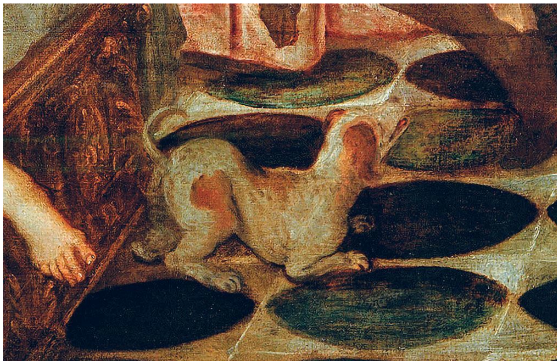
Тинторетто. Венера и Марс, застигнутые Вулканом. Около 1555 Фрагмент