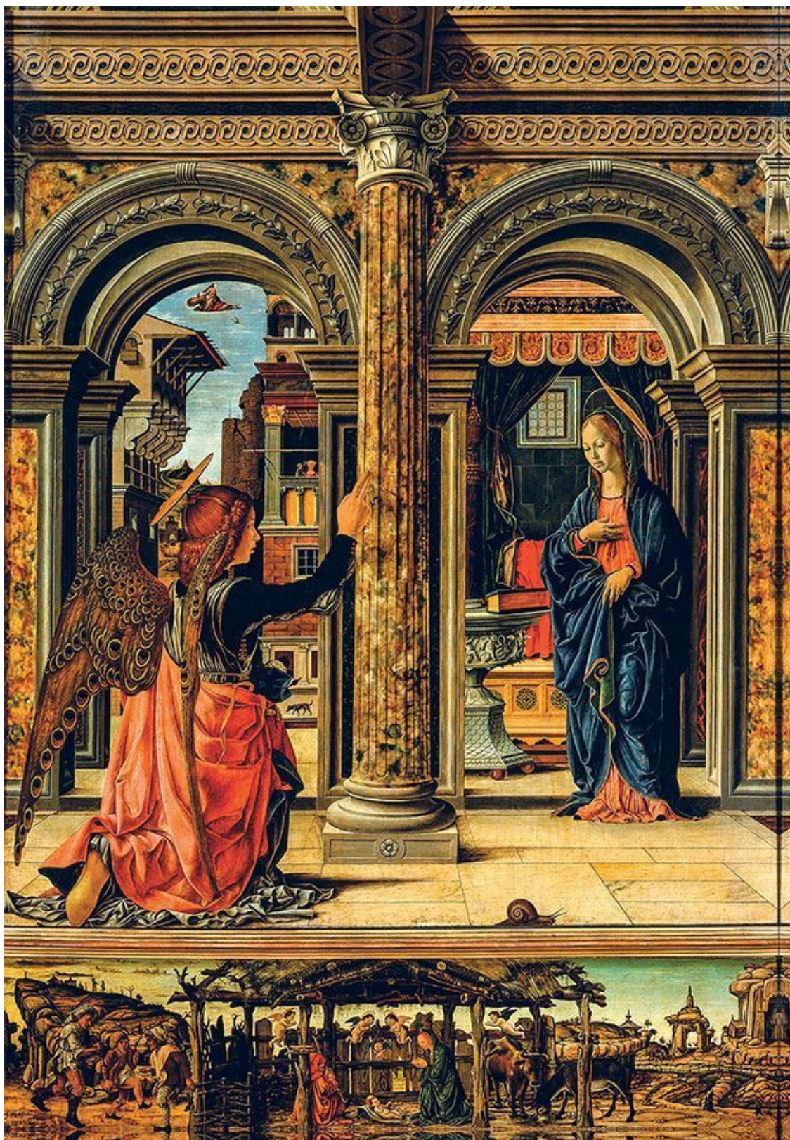
Франческо дель Косса. Благовещение. 1470–1472. Дерево, темпера. 139 × 113,5. Картинная галерея, Дрезден