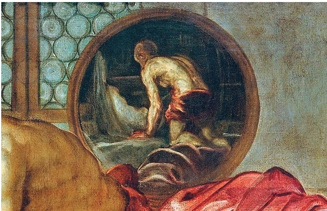
Тинторетто. Венера и Марс, застигнутые Вулканом. Около 1555 Фрагмент

Что в действительности происходит с Вулканом на картине? Он явился, чтобы прервать утехы Венеры и Марса (впрочем, даже еще не начавшиеся). Но вместо того, чтобы прислушаться к лаю собаки, он ищет между ног супруги доказательство возможной неверности. Но то, что Вулкан видит в туалетном зеркале, вынуждает его обо всем позабыть.