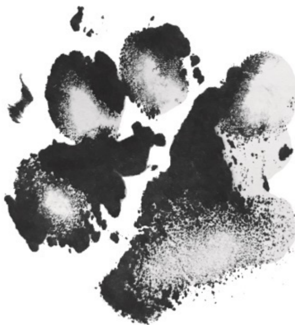
ОТПЕЧАТОК ЛАПЫ ТАКСЫ КАПЫ