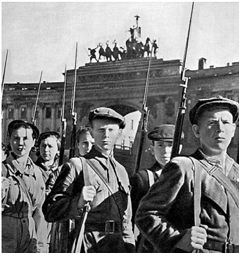
Защитники Ленинграда на Дворцовой площади. 1941 г.

✓ «Директива начальника штаба военно-морских сил Германии об уничтожении г. Ленинграда 22 сентября 1941 г., г. Берлин Секретно