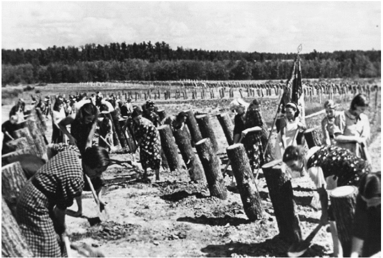
Строительство оборонительных сооружений. 1941 г.

сооружения протяжённостью 175 километров и общей глубиной 10–15 километров. Днём и ночью работали здесь ленинградцы, в основном женщины и подростки.