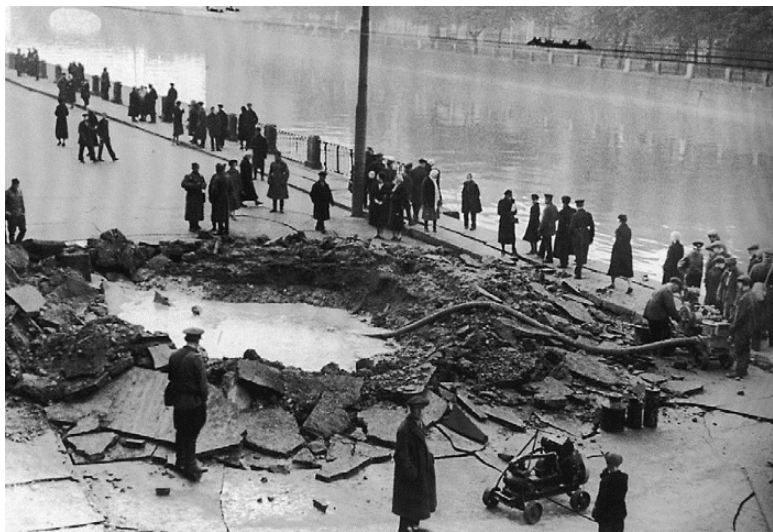
Воронка от бомбы на Фонтанке. 9 сентября 1941 г.