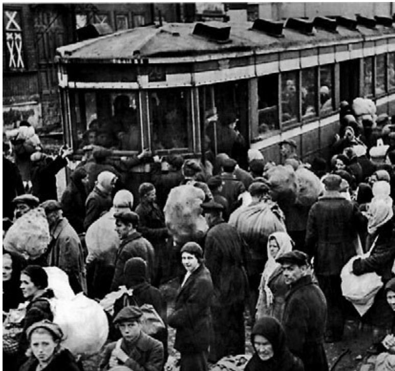
Посадка на трамваи эвакуирующихся жителей Кировского района Ленинграда, подвергшегося наиболее сильным немецким артобстрелам