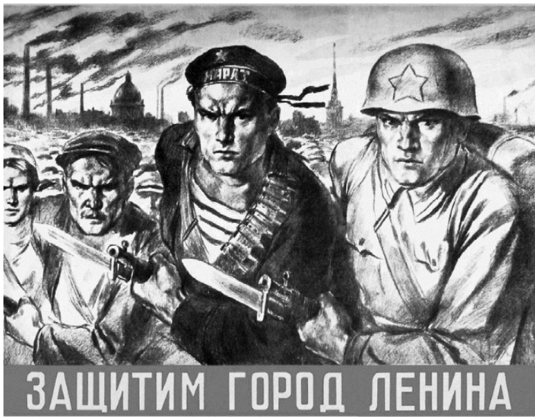
Плакат. 1941 г.

✓ Иосиф Сталин отослал телеграмму командованию Ленинградского фронта: “Федюнинскому, Жданову, Кузнецову. Судя по вашим медлительным действиям, можно прийти к выводу, что вы все еще не осознали критического положения, в котором находятся войска Ленфронта. Если вы в течение нескольких ближайших дней не прорвете фронта и не восстановите прочной связи с 54-й армией, которая вас связывает с тылом страны, все ваши войска будут взяты в плен.