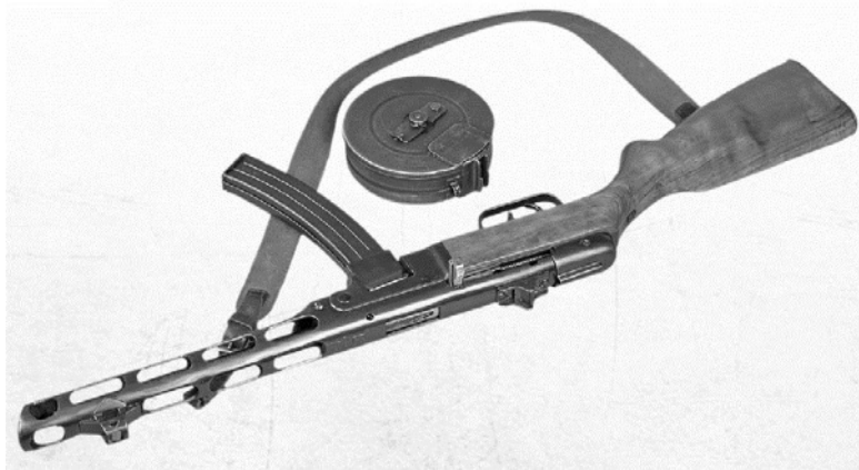
Советский пистолет-пулемет системы Шпагина образца 1941 г.