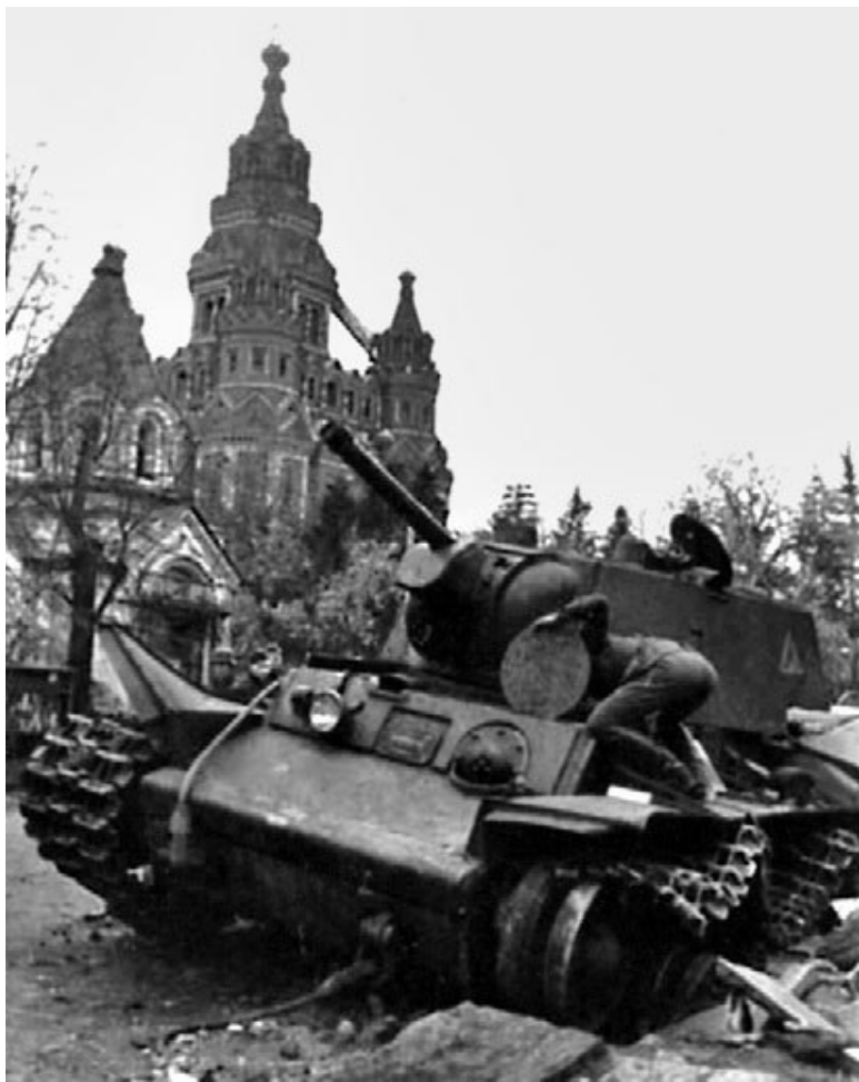
Немецкие солдаты осматривают подбитый советский танк. Петергоф. 1941 г.