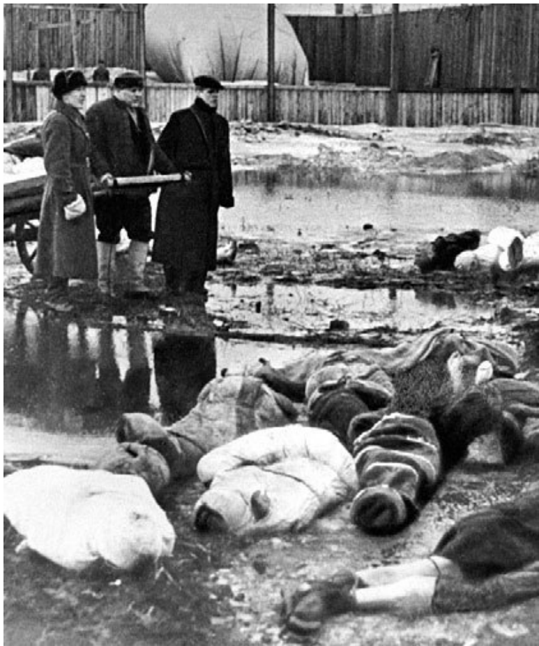
Трое мужчин хоронят умерших в дни блокады в Ленинграде. Волково кладбище.