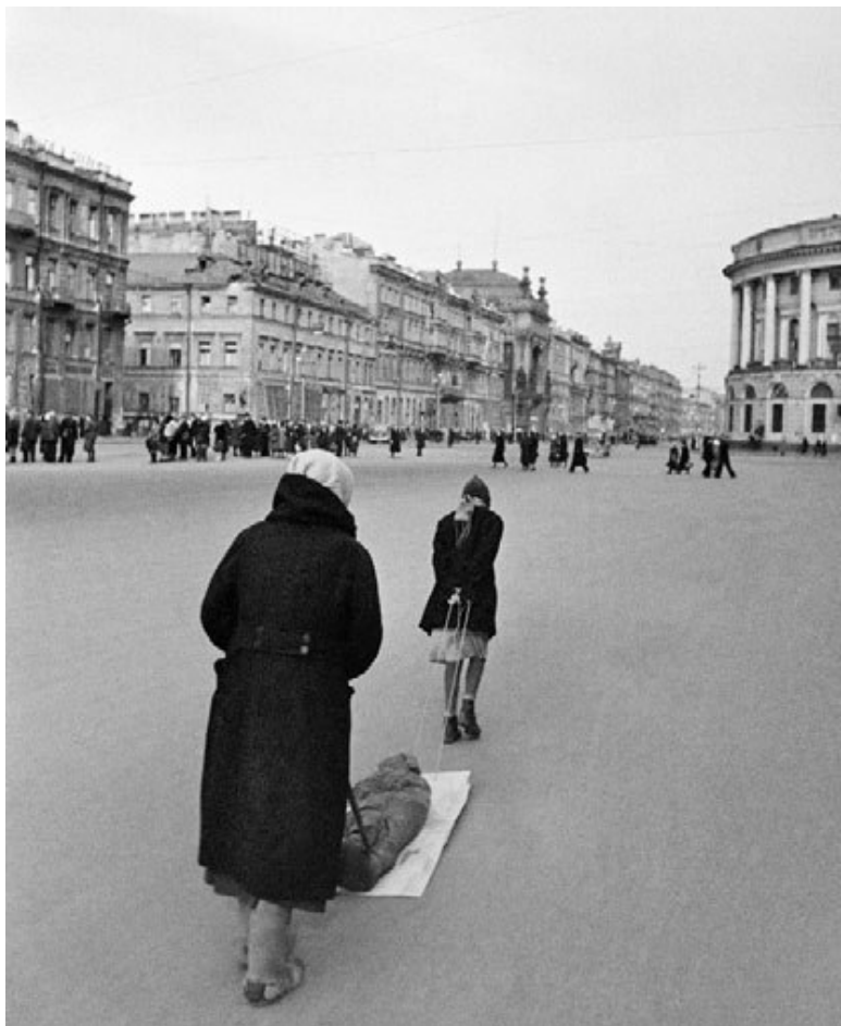
Женщина и девочка-подросток тащат завернутый в одеяло труп по Невскому проспекту.