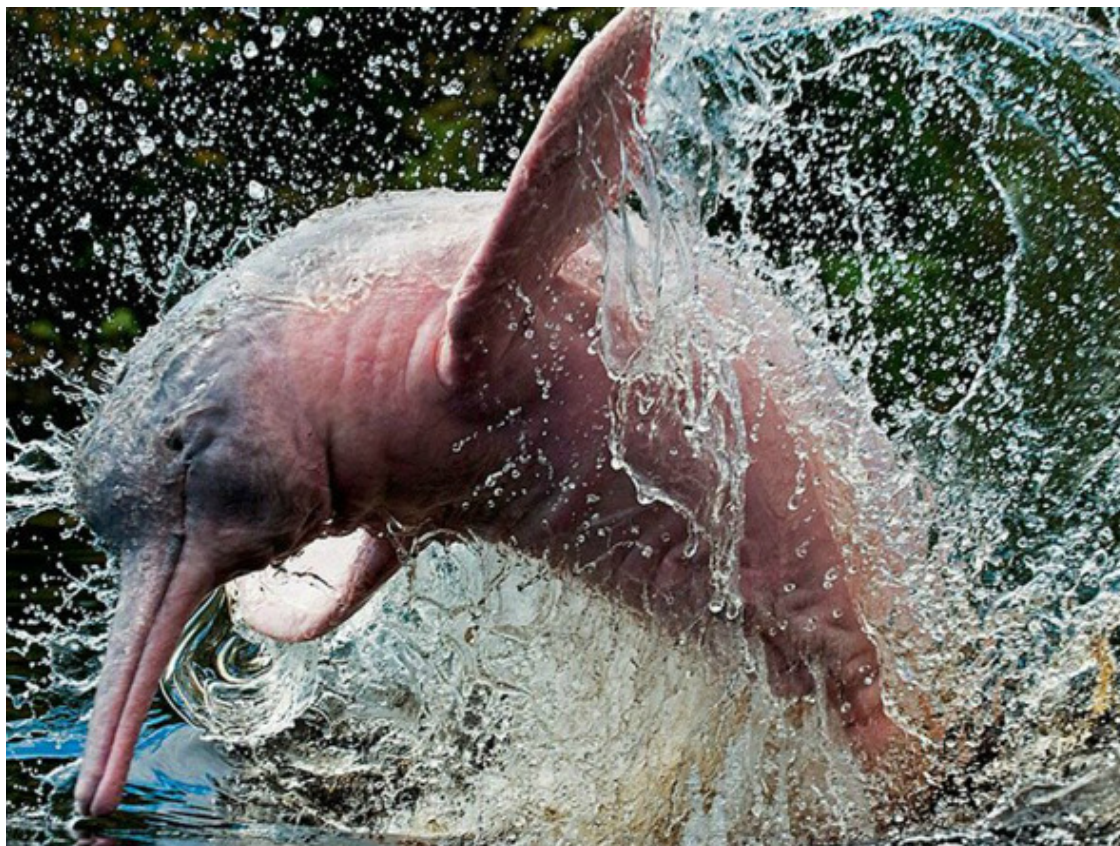
Розовый дельфин Амазонки – иния.

Ото всех этих дельфинов я, простите, почти очумела. Ни на одном море столько не видела. Тем не менее немного расстроилась, когда свернули с Амазонки и пошли по притоку Момон. Дельфинов здесь уже не было, но с удовольствием обнаружила, что скучать мне не придётся.