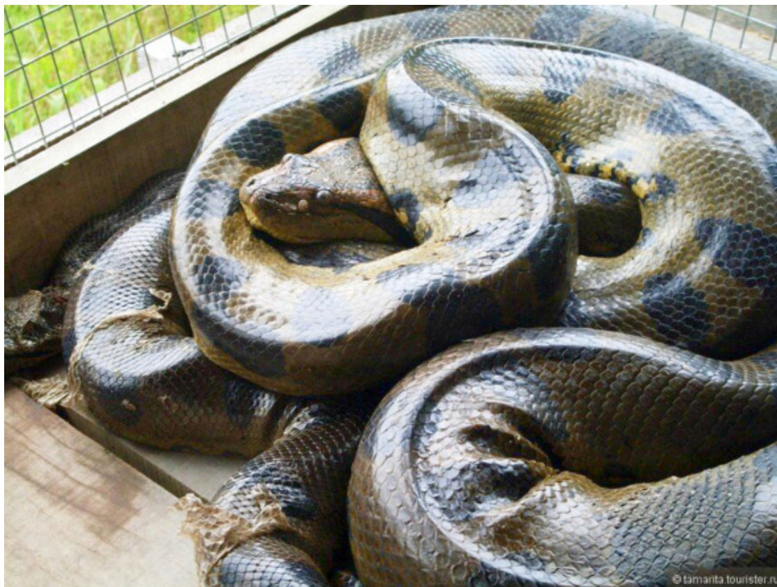
Анаконда длиной в пять метров

На территории звериного приёмника в тот момент находилось много животных, о существовании которых я не знала. Таким удивительным экземпляром стала для меня доисторическая реликтовая черепаха, что живёт и размножается только в Амазонке.