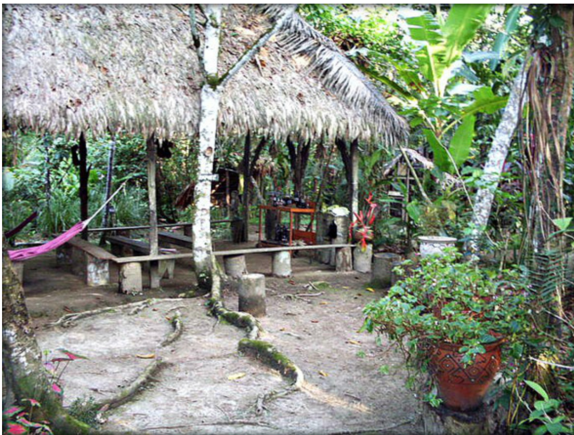
В саду у шамана

вяное дерево с соком цвета крови, йодное дерево, что используют, как антисептик, и молочное дерево, сок которого не отличить от сладкого молока.