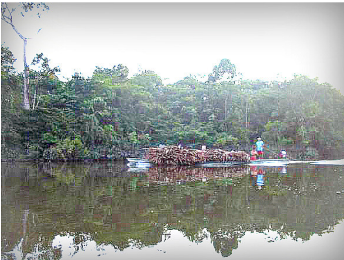
На реке Момон

Туристов в домиках на тот момент было восемь человек вместе со мной. Почти все бунгало стояли пустые. Не очень-то стремится народ в эти места, чтобы удивиться. А ведь здесь созданы максимальные условия для комфортного проживания. На окнах в домиках установлены москитные сетки, но комаров пока не встретила даже на воде. Для этого случая с собой у меня репеллент и охотничья шляпа с сеткой, но она сейчас не требовалась. Все домики для приезжих комфортно оборудованы ванными комнатами, благо воды тут немерено.