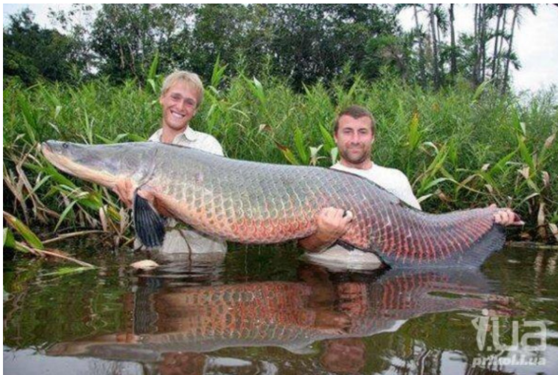
Арапаима – одна из самых крупных пресноводных рыб.

Пираруку обожает притоки Амазонки с почти стоячей, но свежей водой. Не нравится ей сильное течение. Удивительно то, что эта рыба имеет орган, напоминающий лёгкие, а поэтому может дышать воздухом до двадцати минут!