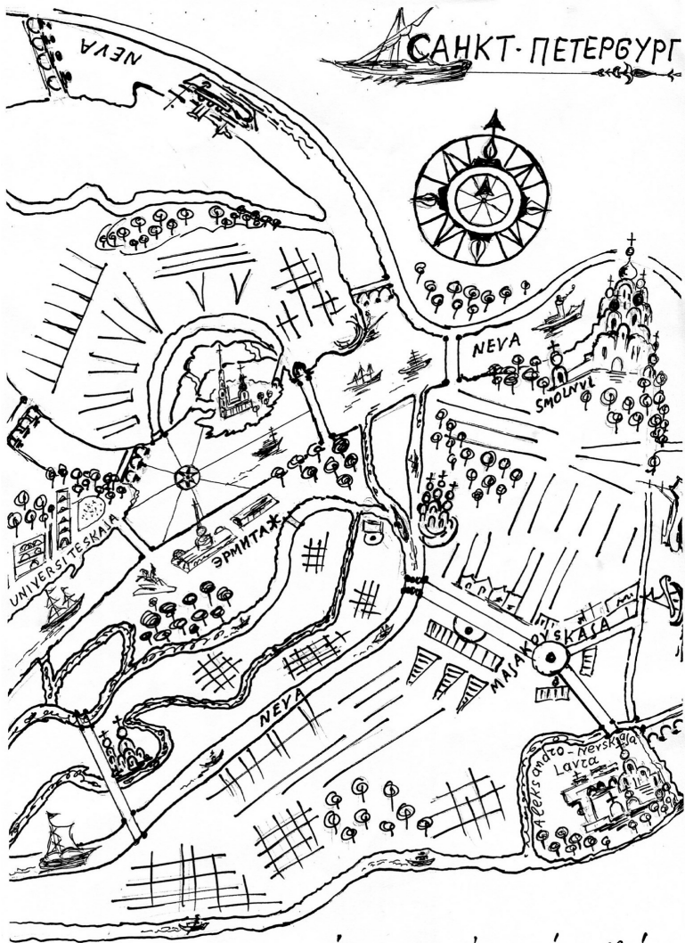
Χάρτης της πόλης για χιόνος από τον Μηδρίσι