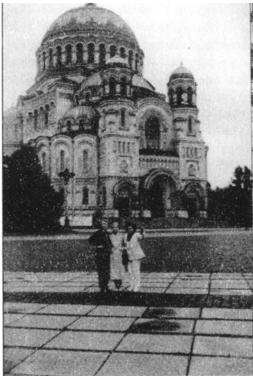
Konstadt - Αγία - Σοφία