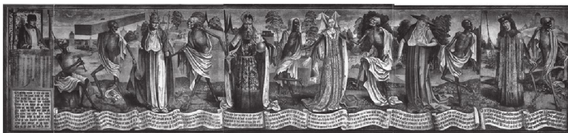
«Таллиннская пляска смерти» церкви Святого Николая в Таллине – изображение XV века из серии т. н. «Плясок смерти»

Несмотря на то что слово «мифологический» несёт в себе негативный оттенок, ибо ассоциируется с фантастическим, нереальным и выдуманным, я употребляю его здесь исключительно в позитивном смысле, учитывая тот бесспорный факт, что мифология сыграла очень важную роль в процессе познания такого сложного феномена как «смерть». Ведь именно мифологии удалось впервые антропологизировать и конкретизировать смерть, сделав её объяснимым, доступным и понятным явлением. Поэтому для нас очень важно обратиться к анализу мифологической интерпретации смерти, которая внесла значительный вклад в её понимание и осознание.