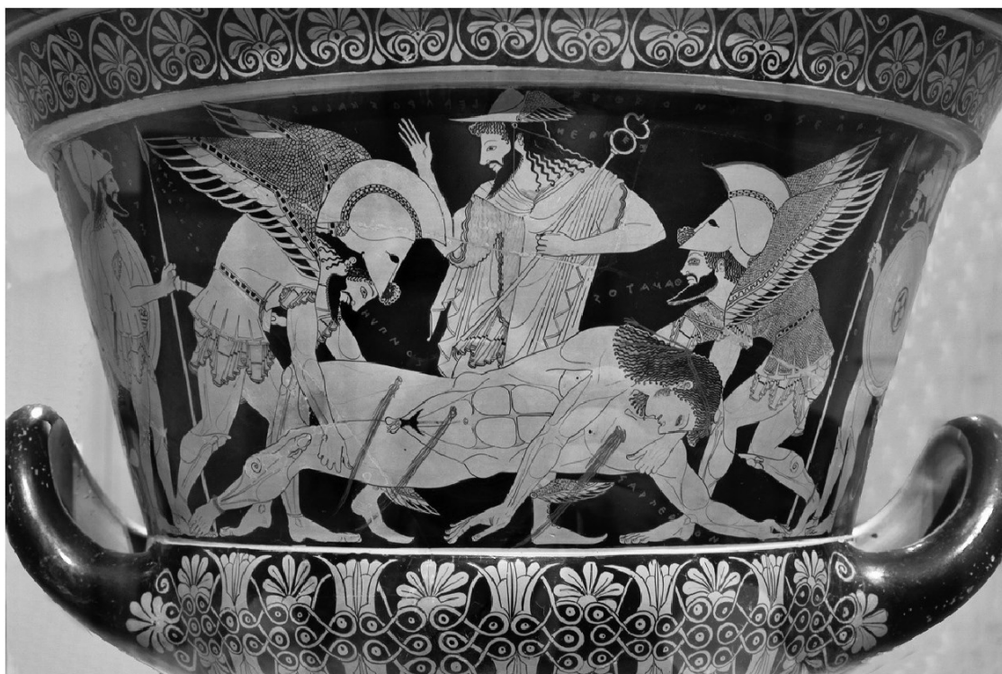
Танатос и Гипнос под наблюдением Гермеса уносят Сарпедона (сцена на мотивы древне-греческой мифологии)