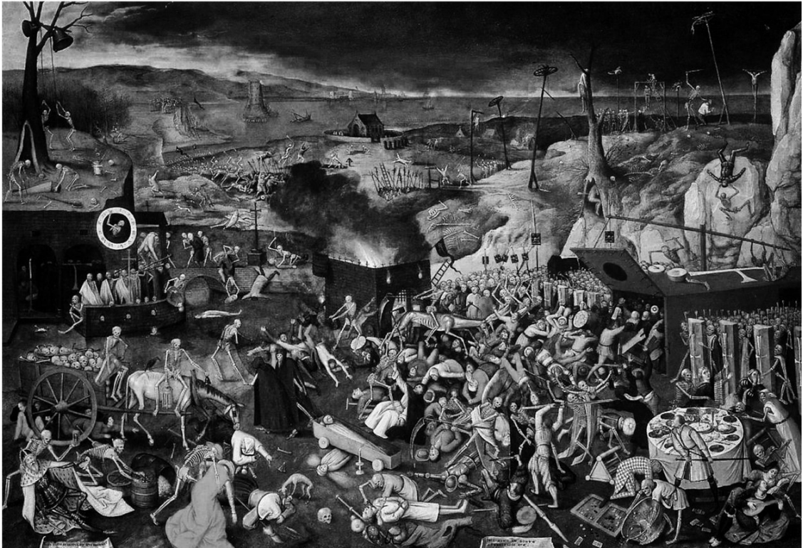
«Триумф смерти» – картина Питера Брейгеля Старшего, написанная около 1562 года

и дисциплин. В результате этой долгой и кропотливой познавательной работы человеку удалось создать неповторимую и многогранную культуру смерти. Надо сказать, что эта культура настолько богата и разнообразна, что никакой исследователь-одиночка не в состоянии изложить и описать её всесторонне – одной человеческой жизни на это просто не хватит. Но я тем не менее посчитал необходимым предоставить читателю краткий очерк культурной истории смерти, который позволил бы ему, хотя и поверхностно, но прикоснуться к различным граням и аспектам этой сложной темы.