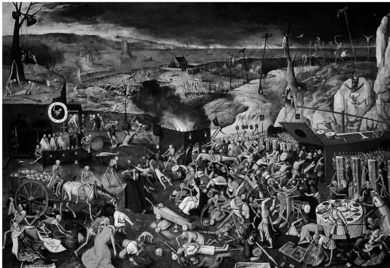
«Триумф смерти» – картина Питера Брейгеля Старшего, написанная около 1562 года