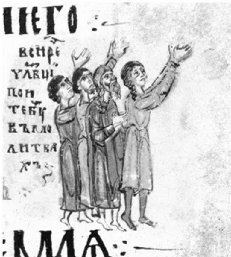
9. «Человеци поют Богу в молитвах». Иллюстрация к Псалму 99. Миниатюра Симоновской Псалтири. Вторая чет-