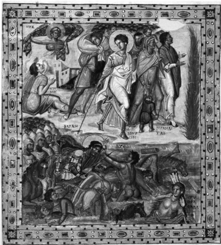
1а. Переход через Черное море. Иллюстрация к Песни Первой, Моисея. Миниатюра Парижской Псалтири. X в.

тирована фронтально, но отдельные фигуры чуть повернуты влево, к Аарону, прикладывающему руку к груди.