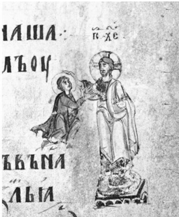
6. Христос и человек. Иллюстрация к Псалму 123. Миниатюра Симоновской Псалтири. Вторая четверть XIV в. ГИМ, Хлуд. 3. Л. 242.