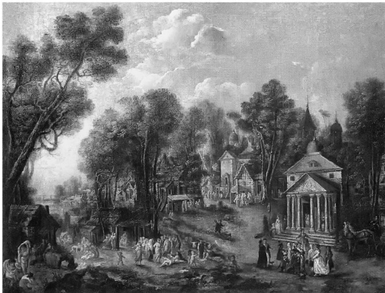
И. М. Танков. Храмовый праздник. 1784. Х., м. ГТГ

Выразительный каскад подобного рода мизансцен дан в «Храмовом празднике» (1784, ГТГ). На почетном месте пространства обширной сцены, чуть ли не на переднем плане, экспонирована церемонная встреча двух дворянских семей на фоне храма с классицистическим портиком. Слева от них, рядом уже с другой «архитектурной» постройкой, напоминающей ветхий деревянный сарай, дана картинка иного рода: самозабвенное крестьянское веселье, «жертвой» которого стала упавшая на землю девушка с соблазнительно задрав-