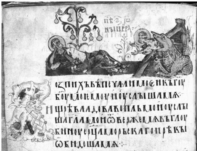
56. Пророк Иона. Иллюстрация к Песни Шестой, пророка Ионы. Миниатюра Симоновской Псалтири. Вторая четверть XIV в. ГИМ, Хлуд. 3. Л. 280 об.

Чем объяснить такой иконографический выбор? Только тем, что в Новгороде в распоряжении местных художников имелись соответствующие образцы, а именно: некая иллюстрированная рукопись Псалтири, вероятно, XI в., миниатюры которой – во всяком случае, иллюстрации к Библейским песням – воспроизводили византийскую иконографию IX–XI вв. Предполагаемая нами лицевая Псалтирь XI