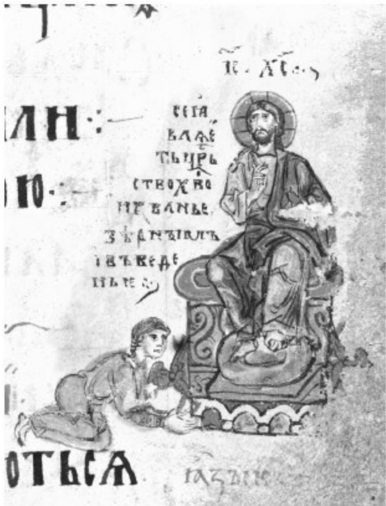
13. Спас на престоле и «язык». Иллюстрация к Псалму 98.