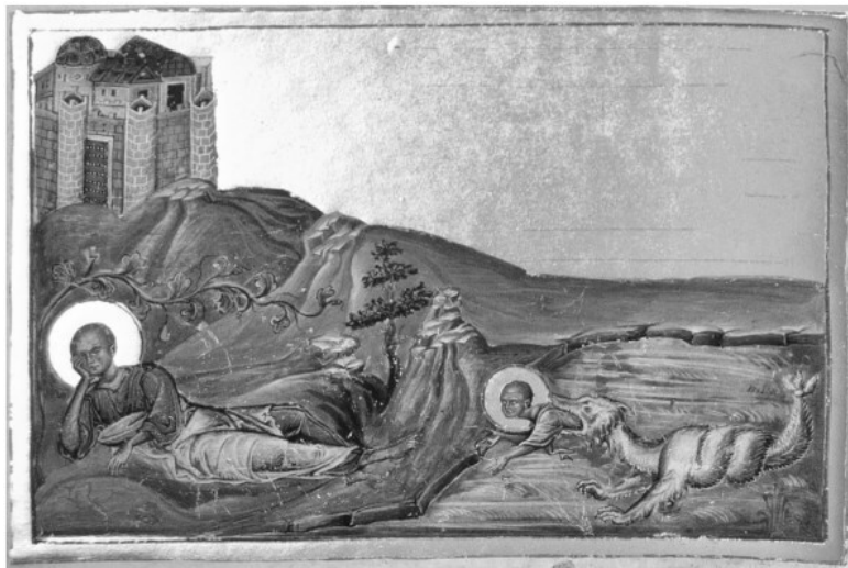
5а. Пророк Иона. Миниатюра Менология Василия II. Первая четверть XI в. Ватиканская библиотека, cod. gr. 1613. Fol. 59. По кн.: Galavaris G. Greek Art. Byzantine Illuminated Manuscripts. Athens, 1995. Fig.50