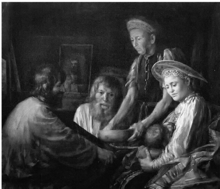
М. Шибанов. Крестьянский обед. 1774. Х., м. ГТГ

Будучи выходцем из крестьянского сословия, Михаил Шибанов изображает знакомые ему по бытовым деталям сцены словно бы изнутри, не как свидетель, а словно бы участник события, суть которого ему разьяснять не нужно.