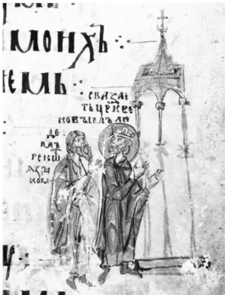
12. Царь Давид и «язык». Иллюстрация к Псалму 95. Ми-