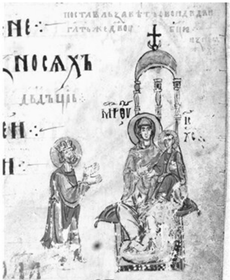
7. Богоматерь с Младенцем и пророк Давид. Иллюстрация к Псалму 131. Миниатюра Симоновской Псалтири. Вторая