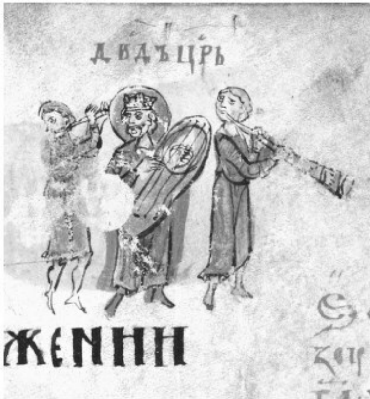
11. «Единого разумеите Бога – Троицу Святую». Иллюстрация к Псалму 150. Миниатюра Симоновской Псалтири. Вторая четверть XIV в. ГИМ, Хлуд. 3. Л. 270.