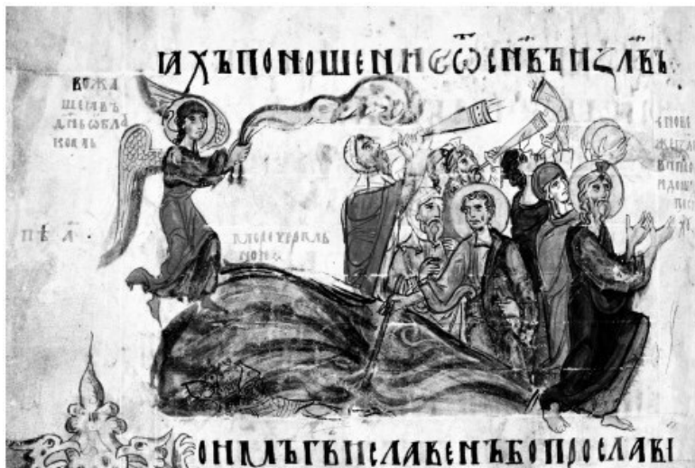
16. Переход через Черное море. Иллюстрация к Песни Первой, Моисея. Миниатюра Симоновской Псалтири. Вторая четверть XIV в. ГИМ, Хлуд. 3. Л. 270 об.

Слева от группы израильтян – засохшее дерево с обломанными ветвями, но с красными цветами. Левее дерева изображена сидящая крылатая аллегорическая фигура, написанная серой краской. Она держится за дерево. Рядом надпись: «ПОУСТЫНИ ПРОЦВЕТЕ ЯКО КРИНЬ».