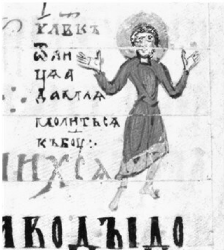
8. «Человек от лица Адама молится Богу». Иллюстрация к Псалму 68. Миниатюра Симоновской Псалтири. Вторая чет-