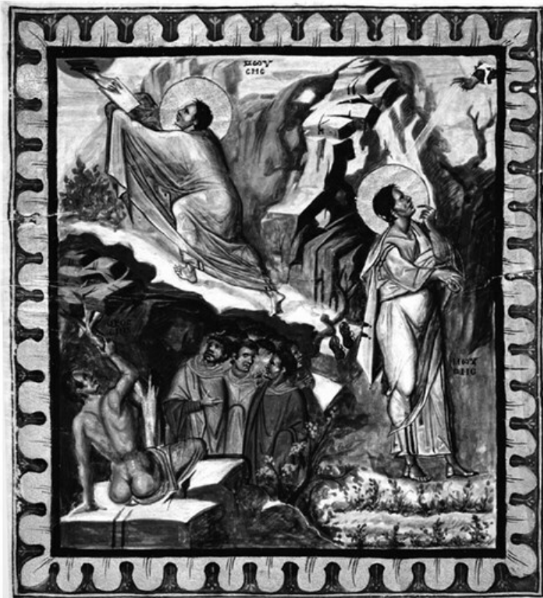
2а. Моисей принимает Скрижали Закона и поучает народ. Иллюстрация к Песни Второй, Моисея. Миниатюра Парижской Псалтири. X в. BNF, cod. gr. 139. Fol. 254. По кн.: The Glory of Byzantium. Art and Culture of the Middle-Byzantine Era. A.D. 843–1201 / Ed. by H. C. Evans, W. D. Wixom. New