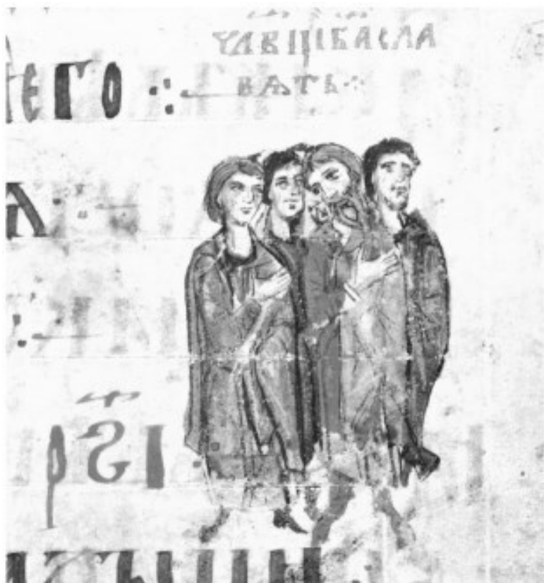
10. «Человеци Бога славят». Иллюстрация к Псалму 116. Миниатюра Симоновской Псалтири. Вторая четверть XIV в. ГИМ, Хлуд. 3. Л. 214.