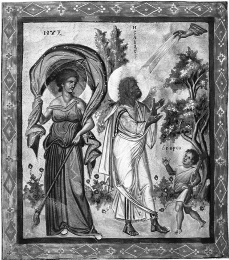
4а. Пророк Исаия с аллегорическими фигурами Ночи и Утра. Миниатюра Парижской Псалтири. X в. BNF, cod. gr. 139. Fol. 435 v. По кн.: Galavaris G. Greek Art. Byzantine Illuminated Manuscripts. Athens, 1995. Fig. 22