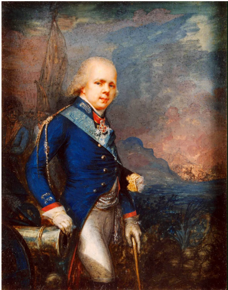
Константин Павлович на фоне битвы при Нови 1799 г.