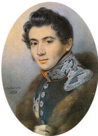
Никита Михайлович Муравьев

Работа над Конституцией, программным документом Северного общества, отбирала много сил у Н. Муравьева. Как это сказалось на заговорщической деятельности?