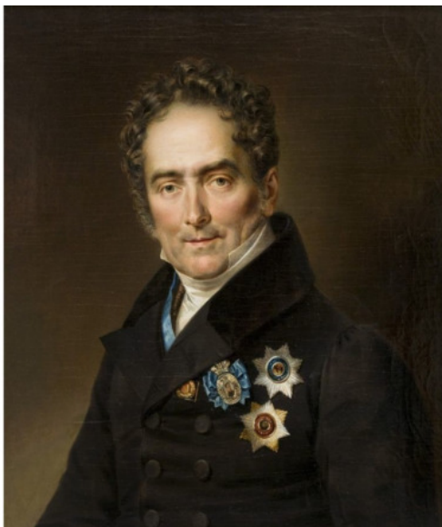
Виктор Павлович Кочубей

В.П.Кочубей приходился правнуком знаменитому писарю Василию Леонтьевичу Кочубею, казненному Петром I за «ложный» донос на Ивана Мазепу. Виктор Павлович родился в знаменитом селе Полтавской губернии, которое пожаловал их семье Мазепа. Как оно называлось?