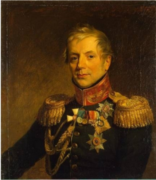
Пётр Петрович Коновницын. Художник Джордж Доу

Генерал возвратил освобожденному «ключ—городу» Смоленску икону Смоленской Божьей Матери, которой перед битвой освящали Бородинское поле.