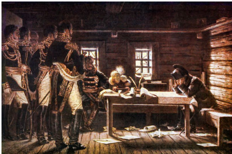
Совет в Городне. Художник А. Аверьянов

Пока Наполеон завершал кампанию 1812 г., в Париже едва не произошел государственный переворот генерала Мале. Получивший известия император запечатлен на картине Верещагина « На этапе. Дурные вести из Франции ». Уставший и разочарованный, облокотившийся на маленький, забитый бумагами письменный стол, он поднял наполненный горечью взгляд куда—то вверх... Действие происходит в сельской церкви неподалеку от Смоленска. Какая деталь картины написана Верещагиным с оригинальной вещи