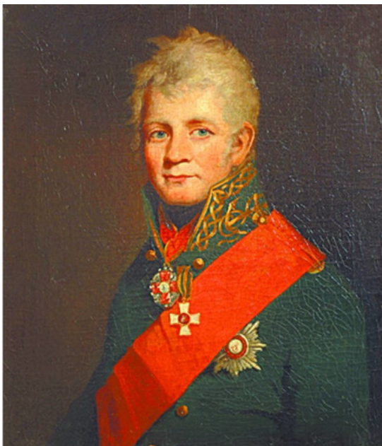
Павел Васильевич Чичагов

В 1814 г. Павел Чичагов навсегда покинул Россию, стал английским подданным и занялся составлением небезынтересных мемуаров, так и не дождавшись должного признания на родине. В памяти потомков остался лишь словами морали: «Беда, коль пироги начнет печи сапожник, // А сапоги тачать пирожник».