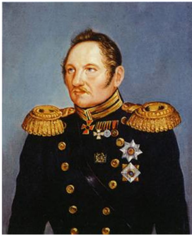
Фаддей Фаддеевич Беллинсгаузен

В то же время, к северу от Антарктики, открыли архипелаг Южных Шетландских островов. В честь каких событий начала XIX в. они получили название?