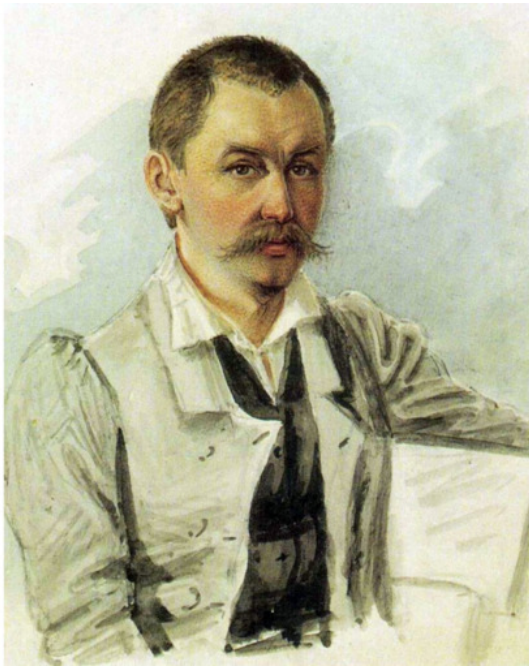
Михаил Сергеевич Лунин

На следствии у Лунина поинтересовались, откуда он взял вольный образ мыслей. Что отвечал декабрист?