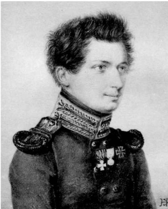
Иван Дмитриевич Якушкин