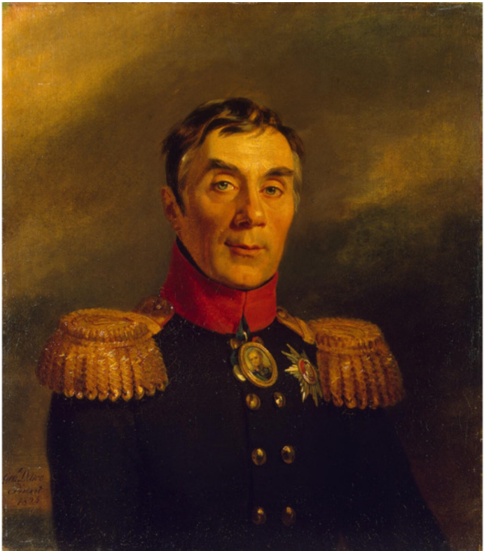
Алексей Андреевич Аракчеев. Художник Джордж Доу

Ничто не предвещало головокружительной карьеры Аракчеева. Юношу готовили в подьячие, но в 1782 г. произошло событие, перевернувшее жизнь. Какое?