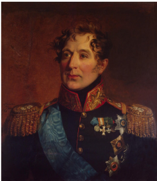
Михаил Андреевич Милорадович. Художник Джордж Доу

Солдаты сравнивали Милорадовича с французским маршалом Мюратом. В чем?