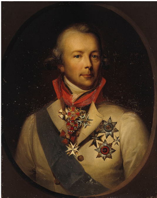
Пётр Алексеевич Пален

Как Пален убедил Александра вступить в заговор против отца?