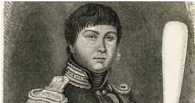
Александр Самойлович Фигнер

от немецкого города Дессау, отряд Фигнера попал в окружение, и Александр Самойлович бросился в Эльбу с надеждой ее переплыть, но погиб. Образ храброго лазутчика увековечил декабрист Федор Глинка в произведении «Смерть Фигнера»: «... О, Фигнер был великий воин, // И не простой... он был колдун!.. // При нем француз был вечно беспокоен... // Как невидимка, как летун, // Везде неузнанный лазутчик, // То вдруг французам он попутчик, // То гость у них: как немец, как поляк...».