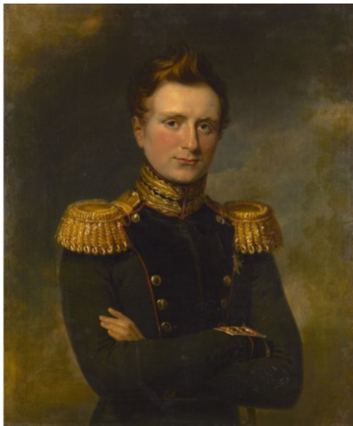
Михаил Павлович. Художник Джордж Доу

Потомки великого князя продали Михайловский дворец в казну, а Николай II увековечил память почившего в бозе батюшки, открыв в великолепном творении Карло Росси «Русский музей императора Александра III» .