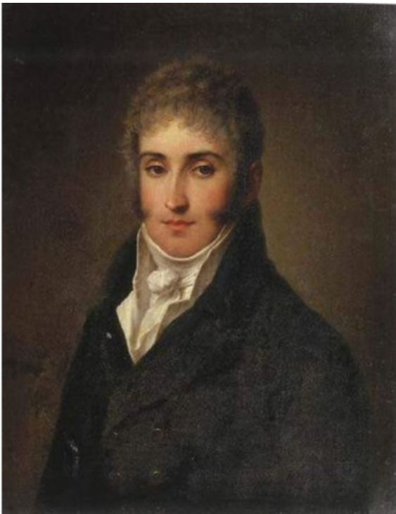
Адам Ежи Чарторыйский

Чарторыйского вызвали в Петербург из Италии 17 марта 1801 г. Но поехал он не сразу, поскольку захотел осмотреть эту достопримечательность.