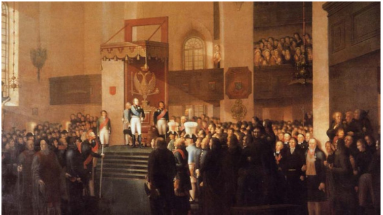
Александр I открывает Боргоский сейм. Художник Э.

« Старая Финляндия » – финские земли Западной Карелии, перешедшие от Швеции к России после завершения Северной войны (1721) и заключения Абоского мирного договора (1743). В 1809 г. присоединились остальные финские территории – « Новая Финляндия ». Воссоединение двух финских территорий ознаменовало образование единого Великого княжества Финляндского.