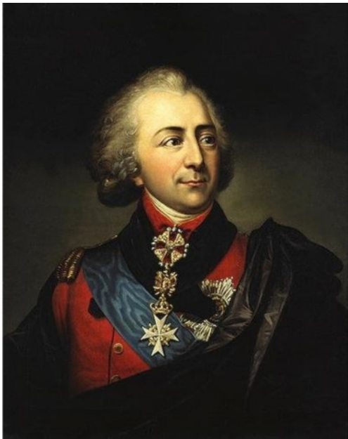
Иван Павлович Кутайсов

В 1798 г., благодаря штыкам французской армии, старый порядок Швейцарской конфедерации рухнул. Кто некоторое время возглавлял новообразованную Гельветическую республику?