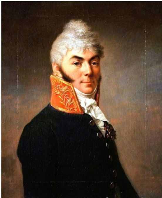
Николай Николаевич Новосильцев

Гроза поляков и друг великого князя Константина Павловича, Новосильцев ведал делами рекетмейстерской конторы. Что это за орган?