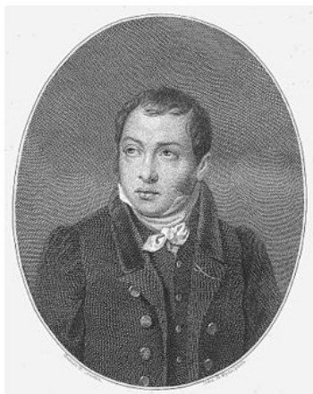
Фаддей Венедиктович Булгарин

ребезчику, после разгрома французов, вернуться в Петербург, заняться активной издательской деятельностью, стать тайным осведомителем Третьего отделения и дослужиться до чина действительного статского советника. Мало того, Булгарин активно писал, вошел в историю литературы как автор романа « Иван Выжигин ». После нарочитой рекламы собственных произведений в « Северной пчеле », эпиграммой на Булгарина отозвался молодой поэт Михаил Лермонтов: « Россию продает Фаддей // Не в первый раз, как вам известно, // Пожалуй, он продаст жену, детей // И мир земной, и рай небесный, // Он совесть продал бы за сходную цену, // Да жаль, заложена в казну ».