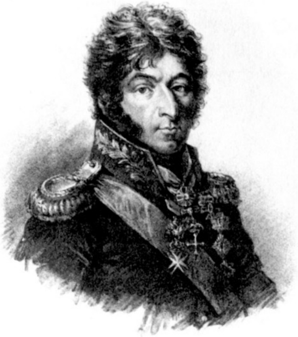
Петр Иванович Багратион

ководца перенесли из церкви в селе Сима на Бородинское поле.