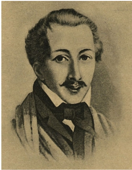
Пётр Григорьевич Каховский

Долгое время считалось, что Каховский был крайне одинок, поэтому и вызывался убить царя, на следствии его никто не навещал. Но личные письма выявили сердечную привязанность. К кому?