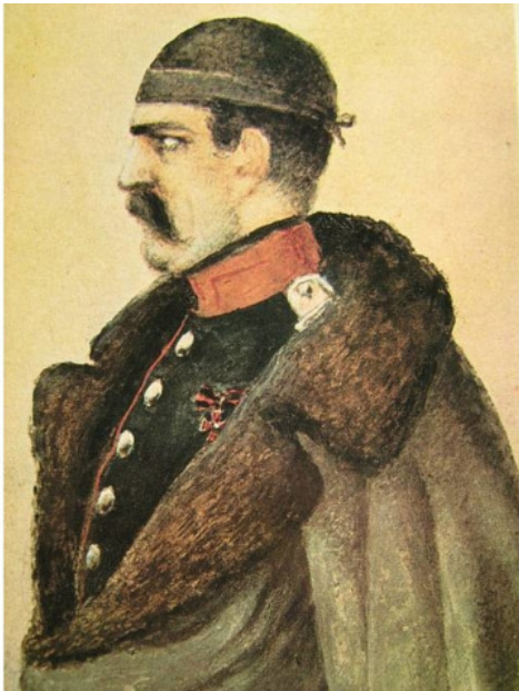
Александр Иванович Якубович

Высокорослый Якубович отважно сражался с горцами и был тяжело ранен в лоб. Что с тех пор присутствовало на его выразительном лице?