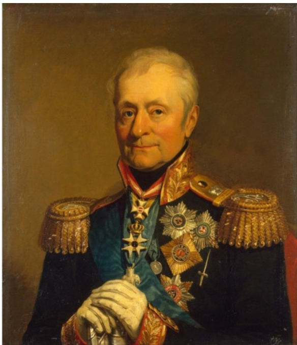
Леонтий Леонтьевич Беннигсен

Какой немец называл Беннигсена «длинный Кассиус»?