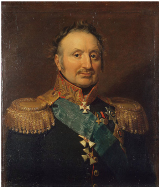
Пётр Христианович Витгенштейн

рехвата французских войск при Березине не пошатнула авторитет военачальника, все шишки посыпались на Чичагова.