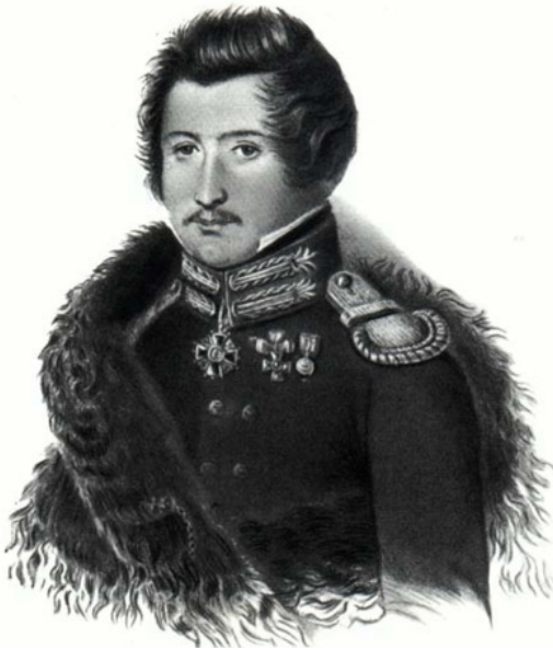
Сергей Иванович Муравьев-Апостол

Как, библейски обыгрывая фамилию декабриста, назвал Н.Я.Эйдельман книгу о Муравьеве-Апостоле? «Апостол Сергей».