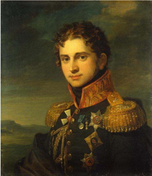
Павел Александрович Строганов

«Это самый невежественный, самый бесчестный и самый тупоумный класс».