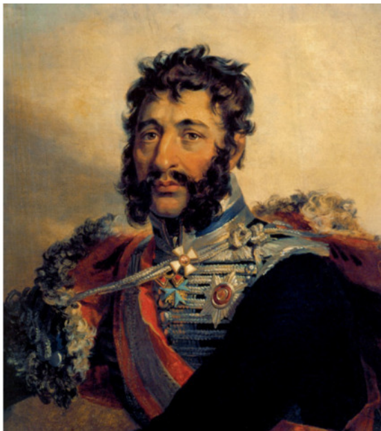
Яков Петрович Кульнев. Художник Джордж Доу

Он порвал с невестой, просившей Якова Петровича уйти в отставку.