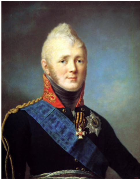
Портрет Александра I. Художник С. Щукин

«Всю жизнь свою провел в дороге, простыл и умер в Таганроге» , – писал Пушкин об Александре I. Как оценивал великий поэт правление державного тезки?