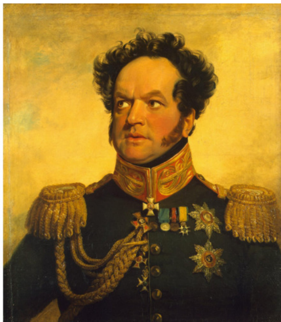
Павел Васильевич Голенищев-Кутузов. Художник

Речь идет о генерал—лейтенанте Павле Васильевиче Голенищеве—Кутузове, герое Отечественной войны и Заграничных походов. В награду за принесение светлой вести, Голенищев—Кутузов получил от столичного купечества серебряное блюдо и кружку с четырьмя тысячами червонцев. Средства переправили в Сословие призрения разоренных от неприятеля жителей.