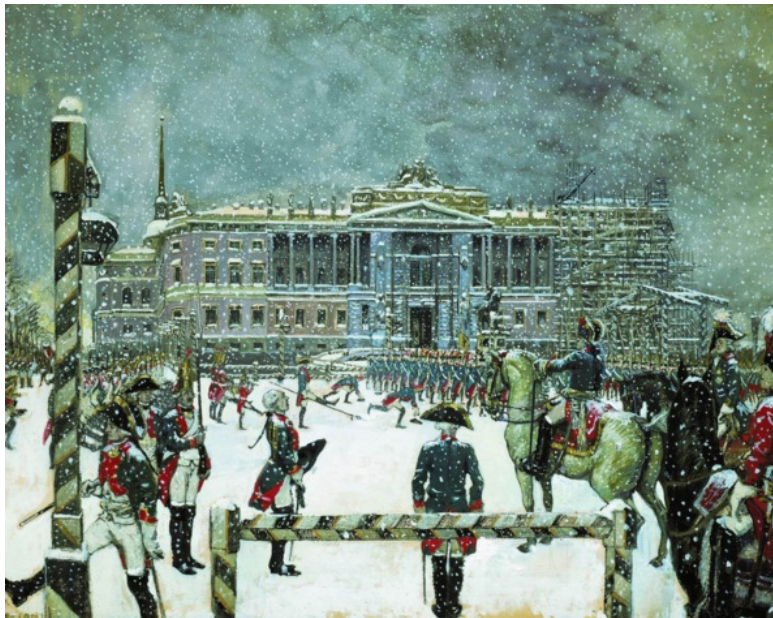
Парад при Павле I. Художник А. Бенуа

Почему Павел I повелел «бывший летний дворец называть Михайловским дворцом»?