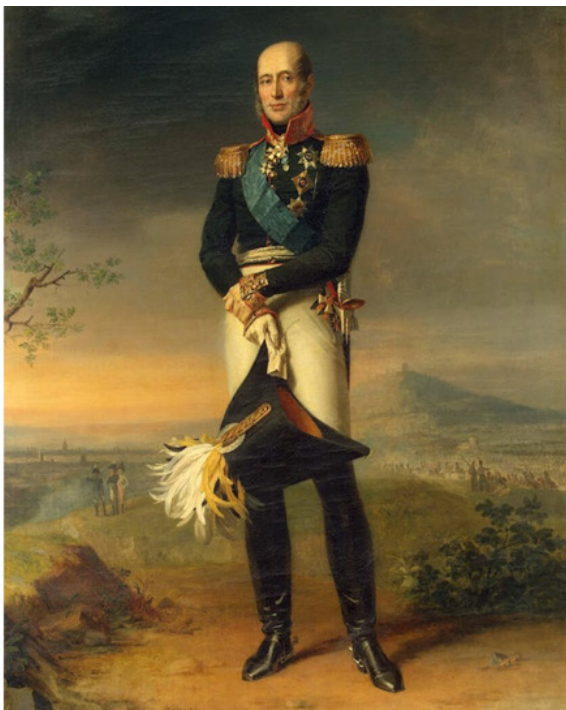
Михаил Богданович Барклай-де-Толли

«... О вождь несчастливый! // Суров был жребий твой: // Все в жертву ты принес земле тебе чужой. // Непроницаемый для взгляда черни дикой, // В молчанье шел один ты с мыслию великой, // И в имени твоём звук чуждый невзлюбя, // Своими криками преследуя тебя, // Народ, таинственно спасаемый тобою, // Ругался над