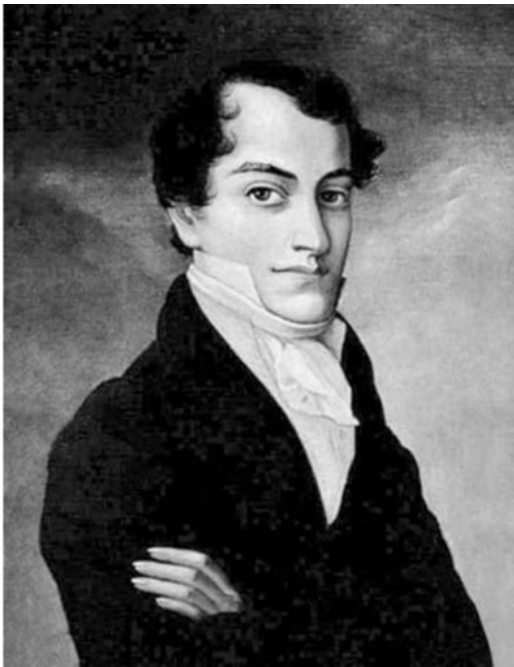
Кондратий Фёдорович Рылеев