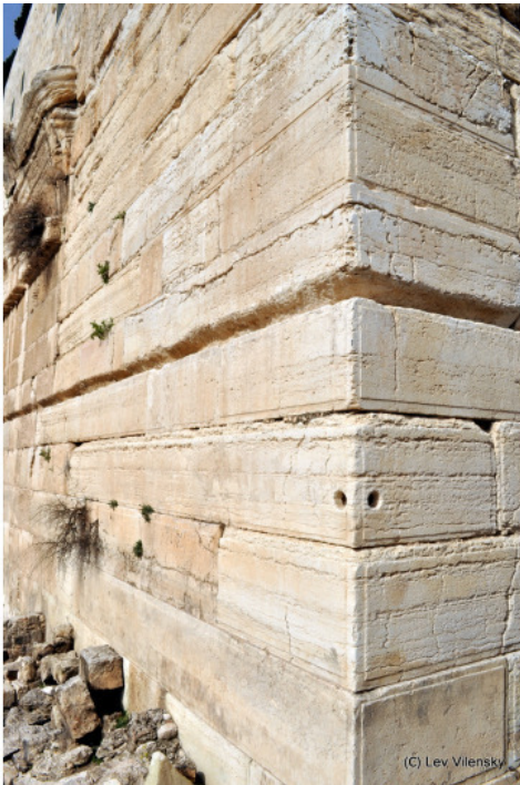
Угол Западной (слева) и Южной стен Храмовой горы.