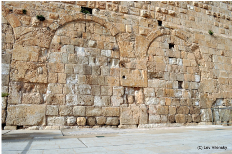
Заложенные камнями Ворота Хульды

в которые когда-то десятками тысяч входили наши предки для принесения жертв и молитвы. Подняться и положить руку на камни Южной стены, вытесанные руками евреев две тысячи лет назад.