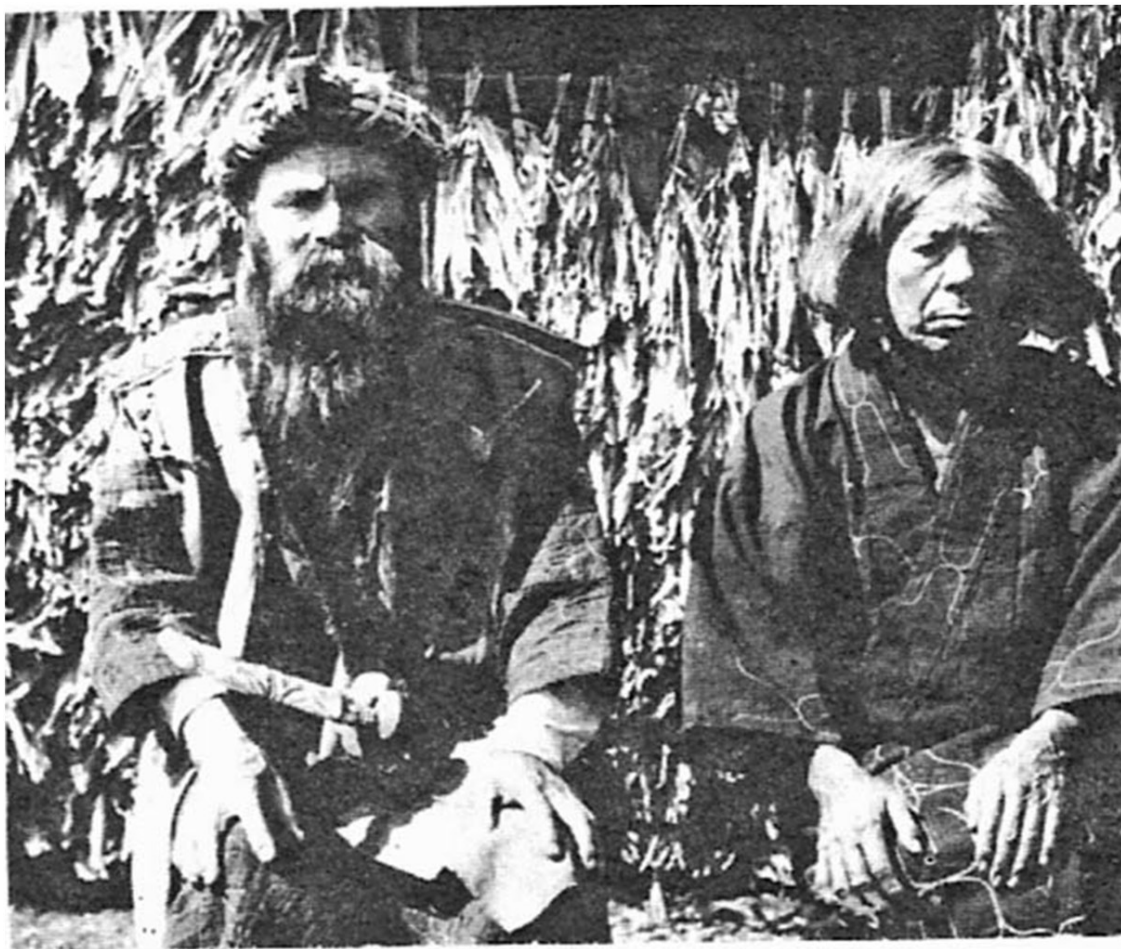
Айны с острова Хоккайдо (Япония)

Это – о характере, о внешности же их – тех, которых Чехов встречал на Сахалине, – он пишет следующее: «черты лица крупны, грубоваты, но в них, по выражению моряка В. Римского-Корсакова, нет ни монгольской приплюсности, ни китайского узкоглазия. Находят, что бородатые айно очень похожи на русских мужиков.»