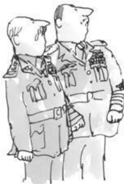
Главнoкoман- дующиe армией и авиацией