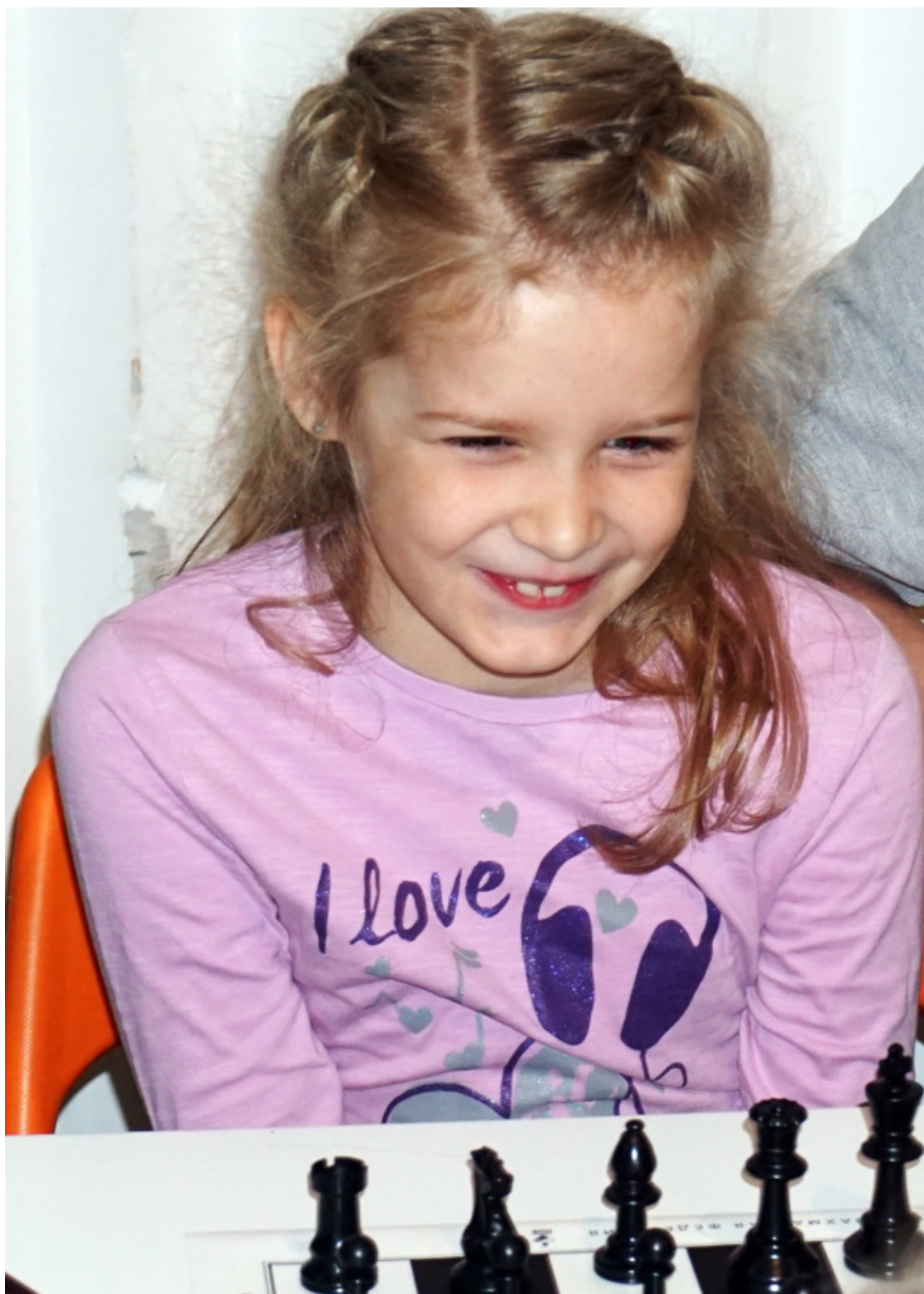
(a1) а-один, (b7) бэ-семь, (c8) цэ-восемь, (f4) эф-четыре и (h2) аш-два!..