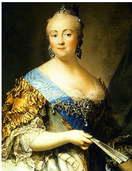
Портрет императрицы Елизаветы Петровны. Вигилиус Эриксен. 1757 год. Холст, масло. ГМЗ «Царское Село».

Как напишут потом историки, народ с восторгом сказал: «Да здравствует императрица Елизавета Петровна!»