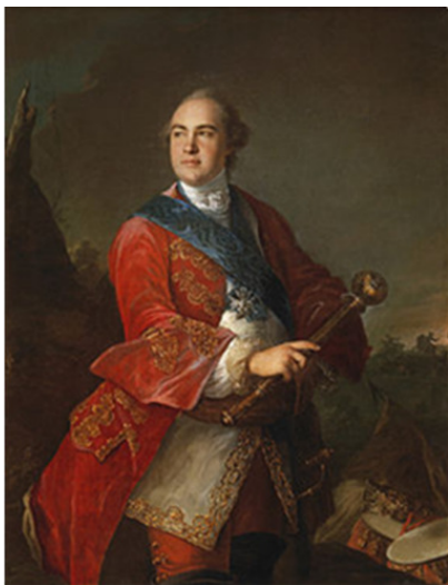
К. Г. Разумовский с гетманской булавой.

Вспомнили тогда о его меньшом брате, Кирилле, пастушке из провинции.