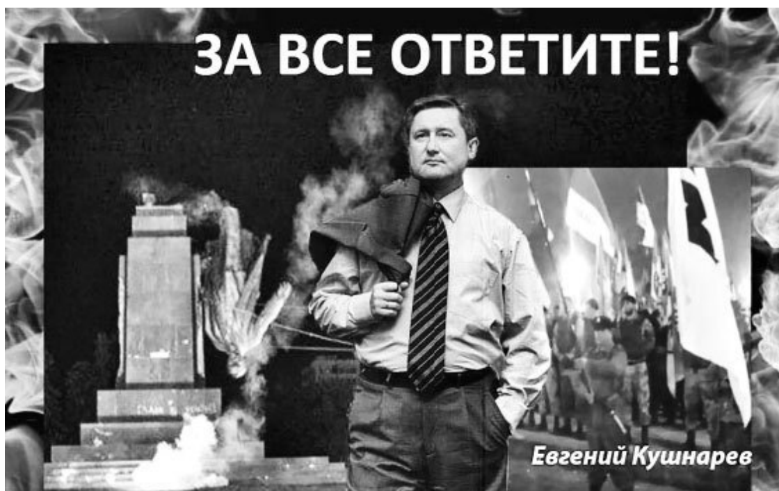
Стикер-демотиватор, разработка автора, 2015 г.

Евгений Петрович почувствовал, что нужно народу, но он опередил время и был, по сути, одинок на политическом олимпе, когда его в 2005 году стали преследовать, инкриминируя сепаратизм; остальные «соратники» из ПР (Партии регионов) сделали нужные выводы и поспешили побыстрее забыть Северодонецк. Если бы Евгений Петрович был жив, то история Украины пошла бы по-другому руслу, возможно по менее кровавому.