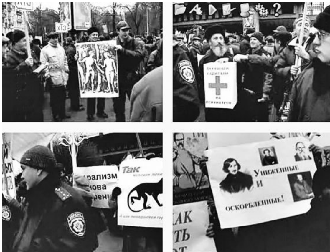
Первый антимайдан, декабрь 2004 г.

Сначала было десять человек, двадцать, сто... через две недели уже стояли тысячи людей, десятки тысяч людей, гораздо больше, чем собрал оранжевый майдан в Харькове.