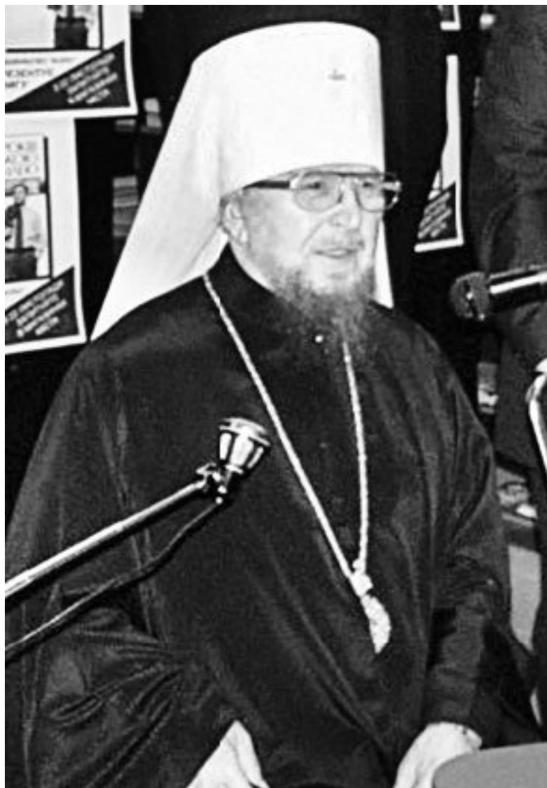
Владыка Харьковский и Богодуховский Никодим