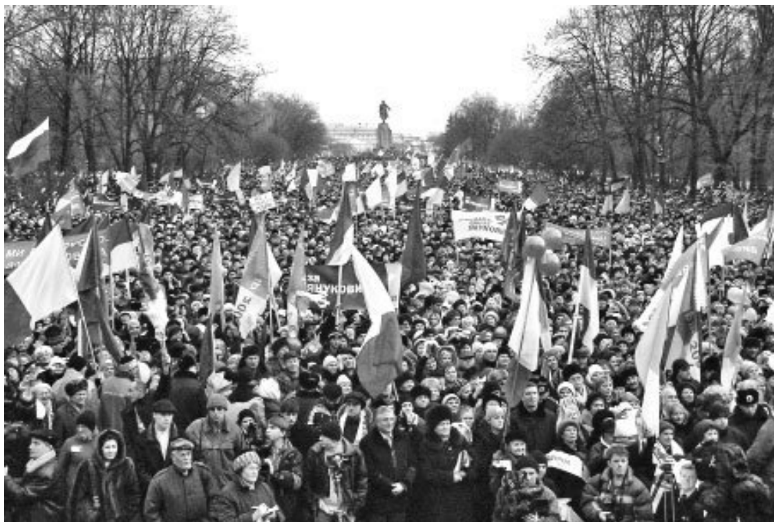
В 2004-м Харьков поднялся против «оранжевой чумы»