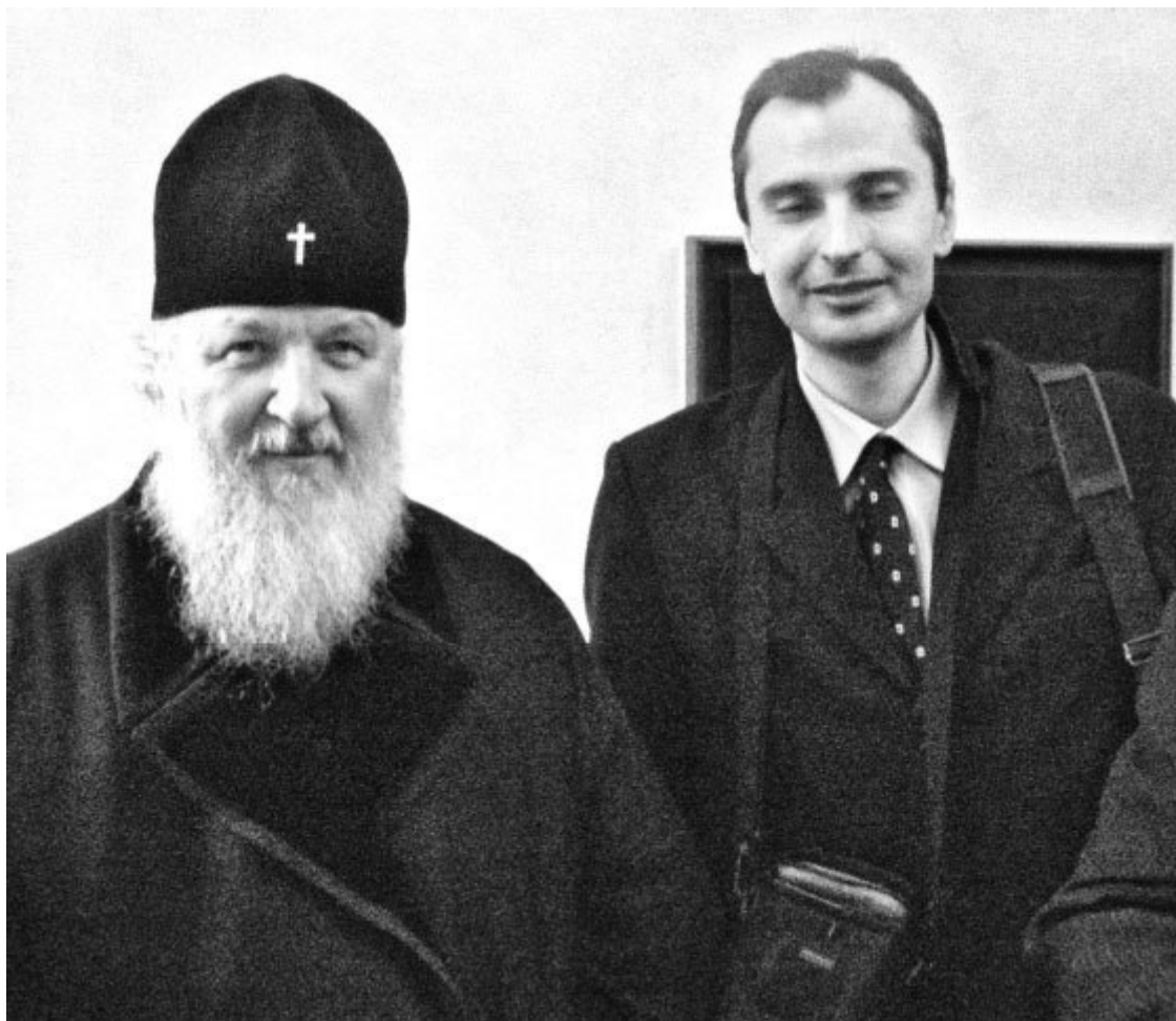
С будущим патриархом всея Руси. Рождественские чтения, январь 2008 г.

Митрополит Кирилл сказал мне, что храм восстанавливать надо, но время для этого еще не пришло.