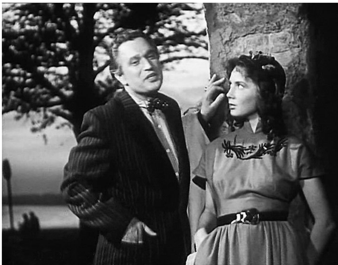
С Николаем Гриценко, фильм «Большая семья»

В это же время в Театре Вахтангова ею была блистательно сыграна не главная, но запоминающаяся роль Октавии в спектакле «Антоний и Клеопатра» в постановке Евгения Симонова. Ее партнерами в этом спектакле были Василий Лановой, Юлия Борисова и Михаил Ульянов. Роль Октавии особенно играть Добронравовой не пришлось. Она очень походила на свою героиню. Чувство гордости и собственного достоинства значило для нее гораздо больше, чем любое романтическое чувство. Столь же убедительно и вдохновенно сыграла Елена Борисовна Бетси Тверскую в спектакле «Анна Каренина» в постановке Романа Виктюка. Играть княгиню для Добронравовой не составило большого труда, ибо она играла саму себя. Обожаемый мною Роман Григорьевич Виктюк рассказывал мне, каким удовольствием для него была работа с Добронравовой на репетициях «Анны Карениной». Они очень подружились, Роман Григорьевич назвал Лену святой, ибо ни разу, по его словам, она не переступила через себя, никогда никому не угождала и не раболепствовала – в общем, поступала так же, как и ее папа – несравненный Борис Георгиевич Добронравов.