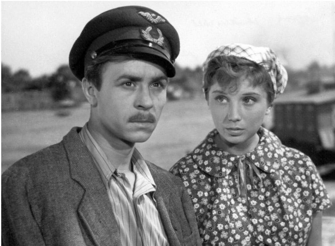
С Олегом Борисовым в фильме «Город зажигает огни»