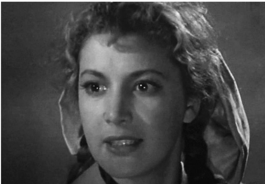
К/ф «Долгий путь»

«Тихом американце», Оксана в «На хуторе близ Диканьки» – эти работы актрисы были многообещающими.