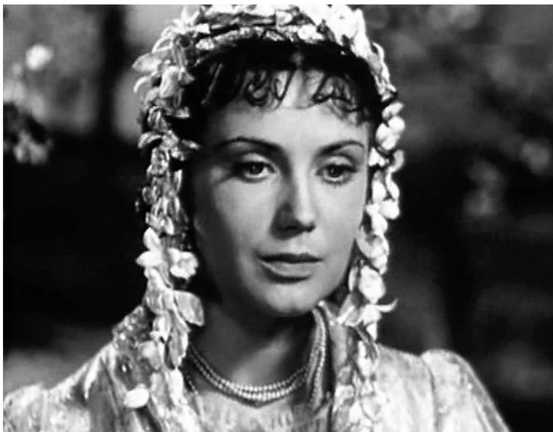
К/ф «300 лет тому...»