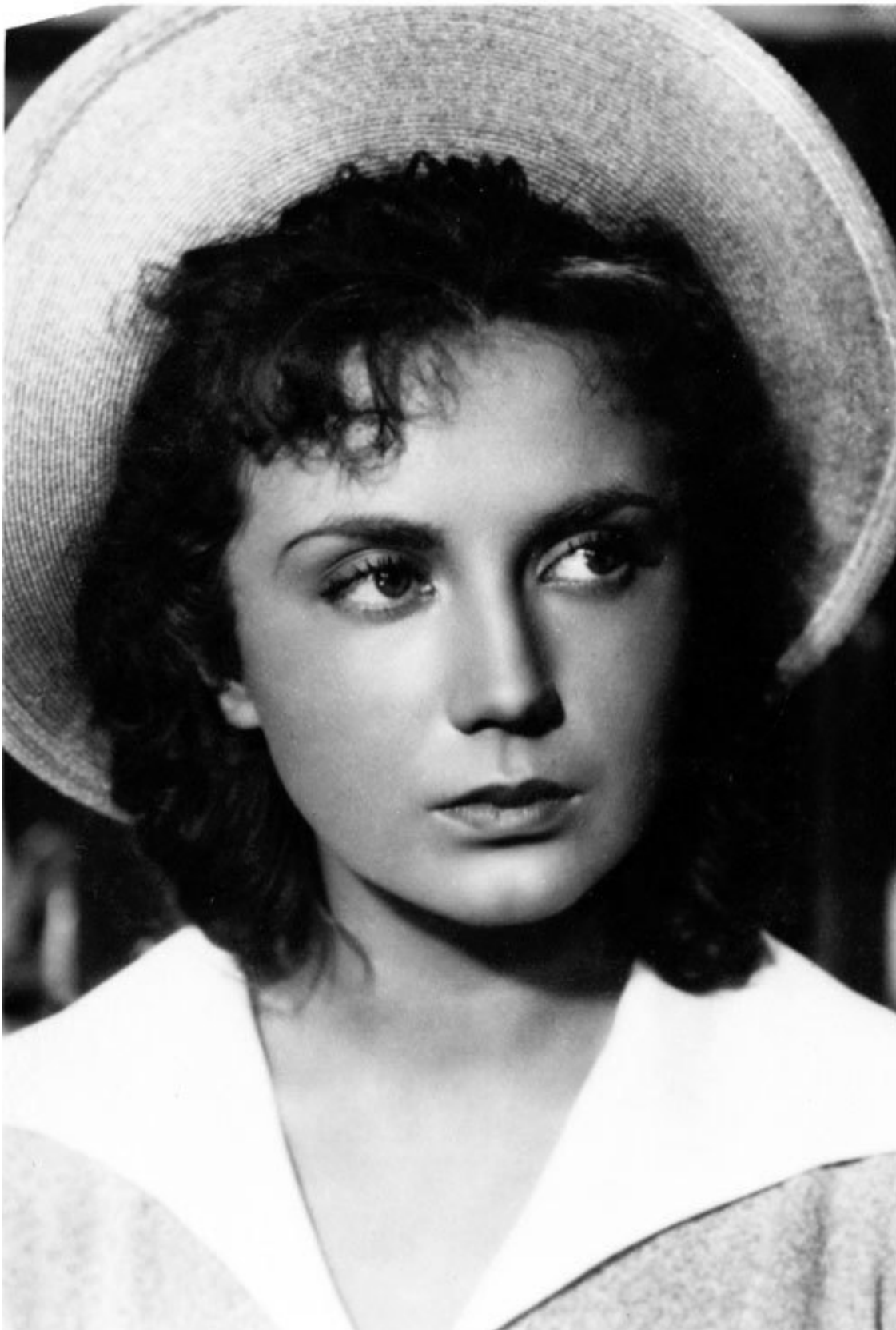
К/ф «Большая семья»