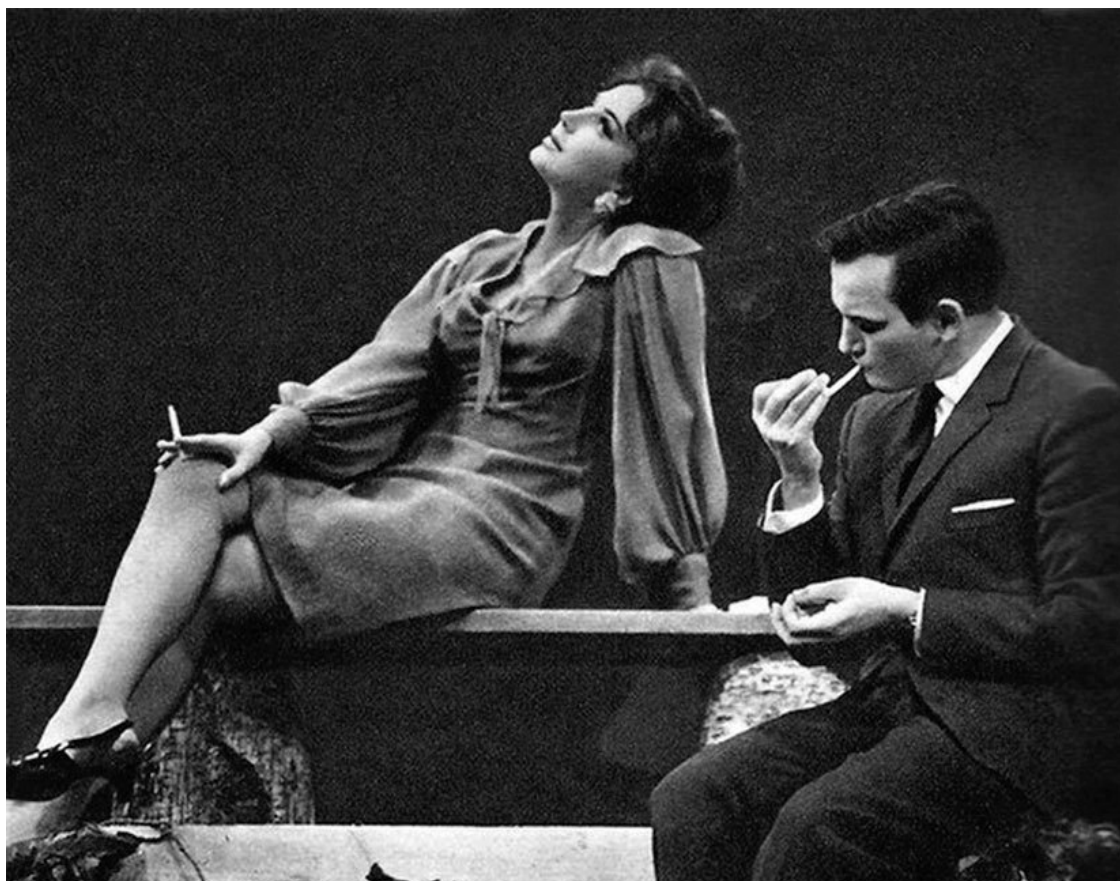
С Василием Лановым в спектакле «Коронация» в Театре Вахтангова

в отношении Татьяны Евгеньевны Самойловой у Добронравовой никогда не было. Самойлова не интриговала, не рвалась к этой роли. Калатозов увидел Веронику в ней, а не в Лене, которая всегда говорила о своей коллеге Самойловой только с уважением. Далеко не у каждой актрисы есть те принципы, которыми руководствовалась Елена Борисовна. Она по-настоящему испытывала огромное уважение к талантливым людям. Слова Антона Павловича Чехова о том, что «нужно уважать талант, который встречается так редко», были твердо усвоены ею еще в юности. Другое дело, что отнюдь не таланты часто переходили ей дорогу.