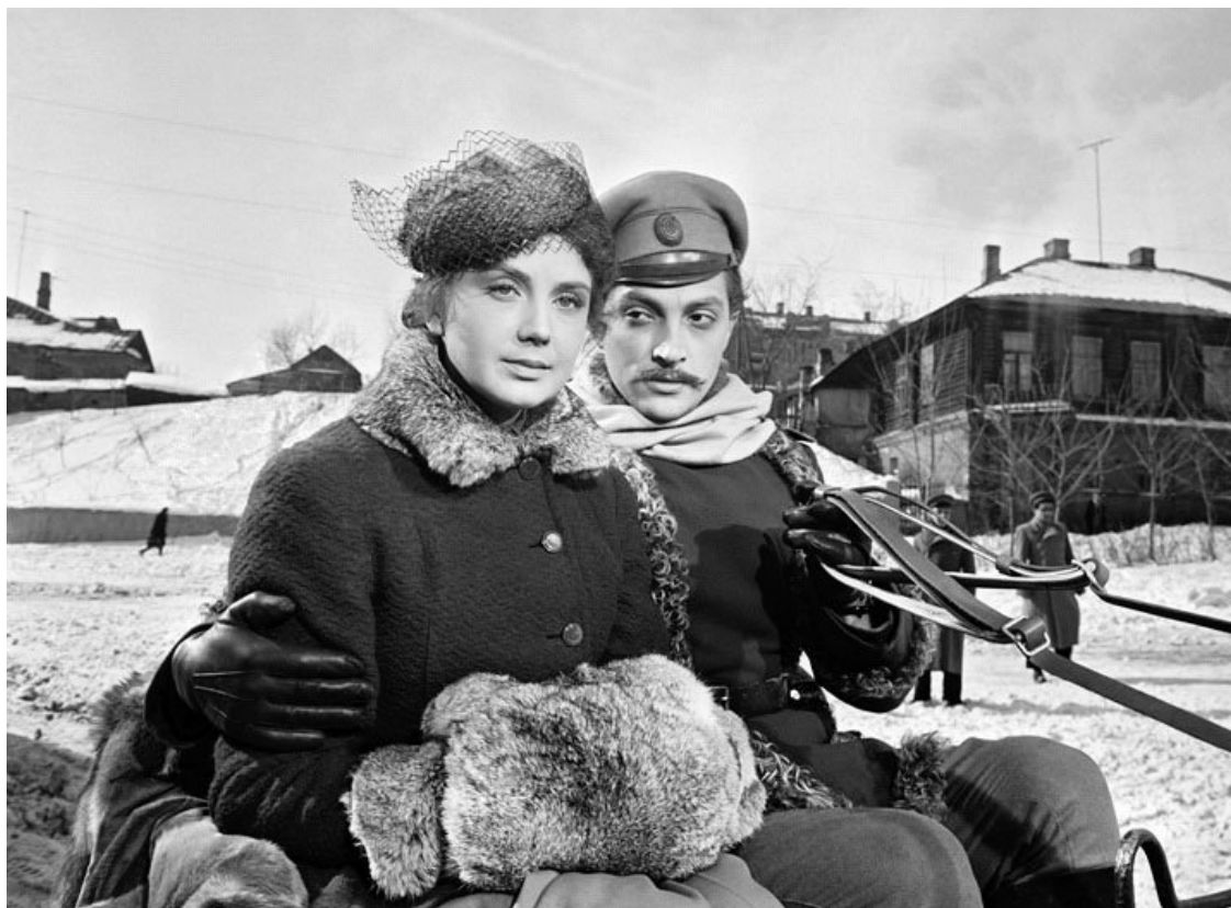
С Михаилом Козаковым в фильме «Золотой эшелон»