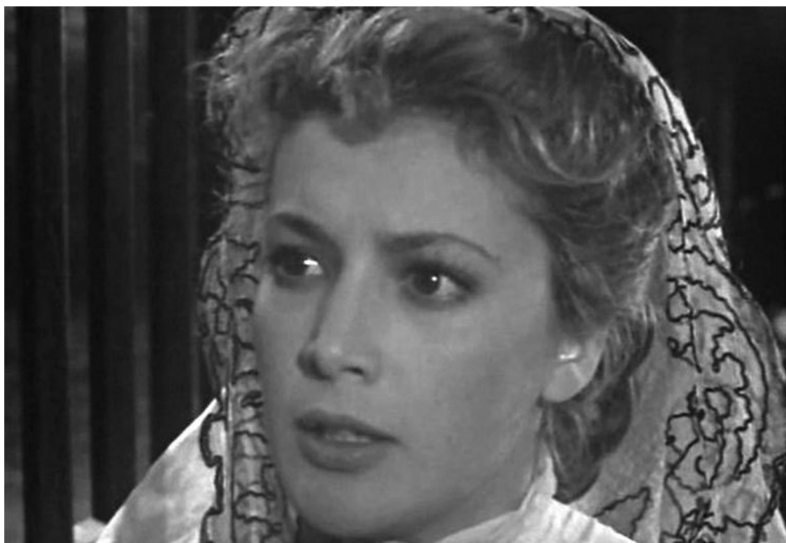
К/ф «Долгий путь»