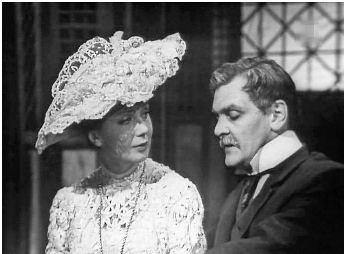
С Юрием Яковлевым в телеспектакле «Портрет Дориана Грея»