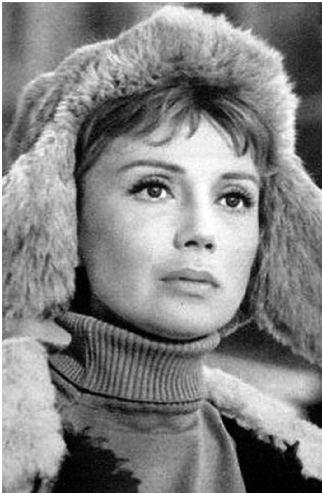
К/ф «Командир счастливой “Щуки”»

Добронравова становится главной претенденткой на роль Вероники, Розов видел именно Добронравову в заглавной женской роли, но режиссер фильма Михаил Калатозов посчитал иначе. Он счел Добронравову слишком солидной для этой роли, и Веронику сыграла юная Татьяна Самойлова, которой эта роль принесла всемирное признание и славу. Чего это стоило Елене Борисовне, знала только она. Это была ее незаживающая рана, но зависти, злобы