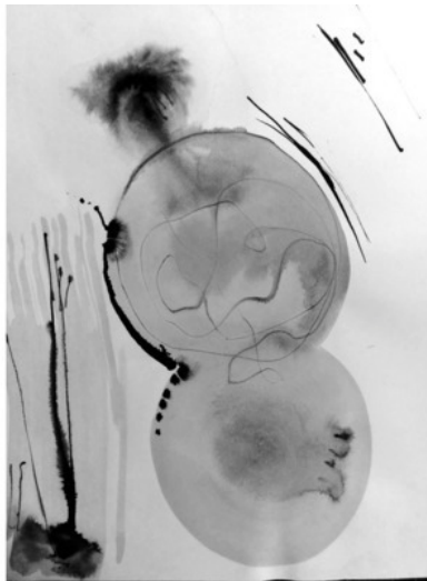
Рис. Ирины Соловых

Много сказал, да только о себе хорошее. О других – с критикой. А третья страдала, слушая этих двоих. Глаза её светились бликами из солнечной чашки. Ей всё время было больно. Она радовалась всегда в одиночестве, грустила в толпе.