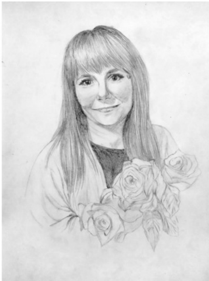
Рис. Марии Шмелевой

Поэт смотрел во все глаза. Он не замечал, что певица не особенно красива, с лишним весом, костюм совсем не украшал ее. Поэт сиял: «Как она поет!» Он дарил ей цветы, встречал и провожал. Прекрасная Лаура принимала ухаживания и вскоре переселилась к Поэту. Он продолжал писать стихи, вздыхать и слушать арии.