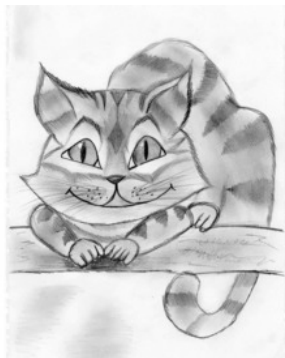
Рис. Софии Ледин

Епифан Фадеич – это мое имя. Звучит, согласен. Правда, она меня редко так называет. В основном, Пинькой кличет. Пинька... Как можно было додуматься до такого? Хотя раньше мне это нравилось. Пока не обнаружил по соседству такую красотку.