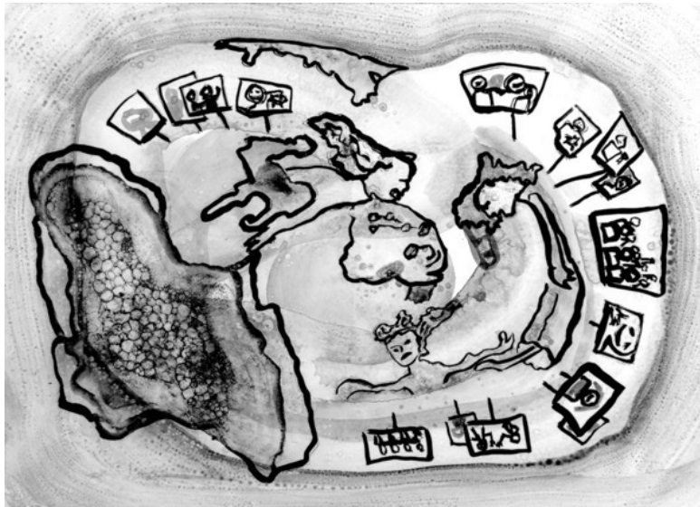
Рис. Ирины Соловых

Короче, Прошка просидел всю ночь за варочной плитой в голодном одиночестве. Ему было обидно и скучно. И он нарушил первую заповедь – вылез из своего угла, залез на стол, отхлебнул водочки из графина, подтащил к себе вазочку с салатом оливье и стал праздновать.