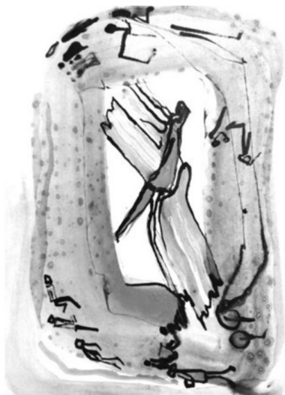
Рис. Ирины Соловых

– Опять к нам никто не придёт. Все друзья боятся намусорить и нашуметь у нас в квартире. Музей какой-то, – он опустил голову и посмотрел на свои наглаженные шнурки на ботинках. – Ну, прямо, совсем чересчур.