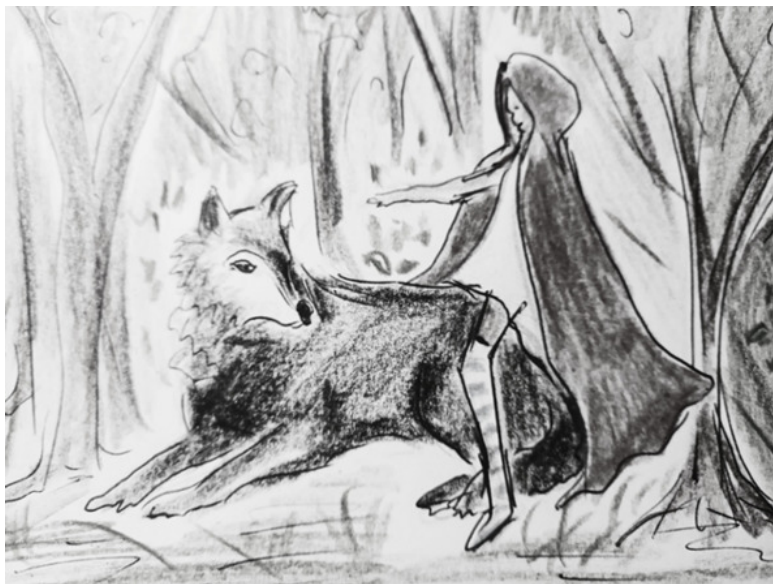
Рис. Марины Крук

опаздываю. Боюсь, принц не дожидется. В долгу не останусь.