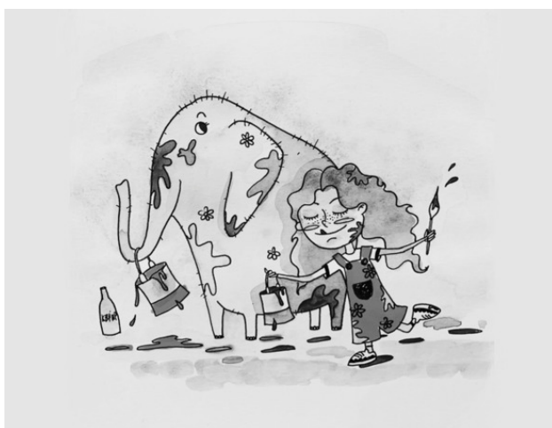
Рис. Анастасии Крук

Маша краски вдруг берет: «Сделаю наоборот.