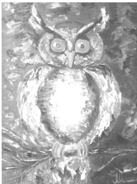
Рис. Елены Шмелевой

– Я тебе задания дам. Только ты их должна будешь выполнять каждый день. Деревья различать не может? Мы его научим. Ты вот что сделай. Возьми кору берёзы, дуба и осины и дай эти кусочки медвежонку, пусть нюхает их и лижет. Все деревья на вкус разные. Конечно, пока малыш от одного дерева к другому дойдёт, он уже забывает про первое. Деревья обнюхивать сейчас бесполезно, не запомнит. А кора, она под лапой всегда. Запомнит. Когда будет самая тёмная часть ночи, опять дай медвежонку кору. Видеть он её не сможет, а на вкус и запах определит. Потом любое дерево узнавать в лесу будет.