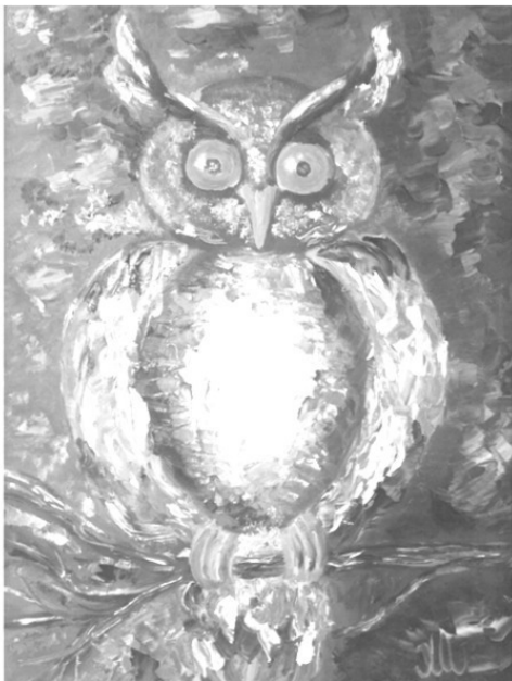
Рис. Елены Шмелевой

Медведица играла с медвежонком в кору, и малыш запомнил деревья.