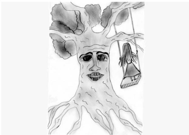
Рис. Софии Ледин

Качелька раскачивалась всё сильнее: вверх-вниз, вверх-вниз. Ветка поскрипывала: «фьюить, фьюить». Листья на ветру шелестели: «шух, шух». Девочке так нравилось качаться, стоя на ножках! И вдруг... Обутые в скользкие туфельки ножки поехали, дощечка взметнулась вверх, и девочка с ужасом полетела вниз!