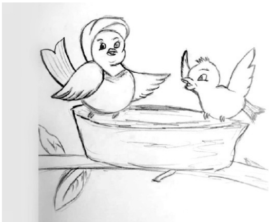
Рис. Юлии Веретенниковой

– Почему ты не летишь? – удивилась мама Воробьяха. – У тебя уже выросли крылья.