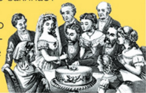
Рис. 1. Кстати, так называемые «Аткрытки» показывают феноменальную живучесть – такой формат контента уже несколько лет хорошо воспринимается аудиторией

Когда я пишу «по возможности оригинальная», это не обязательно означает «нигде, никогда и никем не опубликованная ранее». Все далеко не так. «Оригинальная» в данном случае – это скорее «вписанная в ваш поведенческий почерк». К примеру, если вы написали статью и опубликовали ее, а потом (через несколько месяцев) ее повторяете – это все равно оригинальный контент в определенном смысле. Даже если вы просто публикуете тематические цитаты из книг классиков, но оформляете их особым узнаваемым образом (к примеру, на картинках с ватермаркой), то подходит