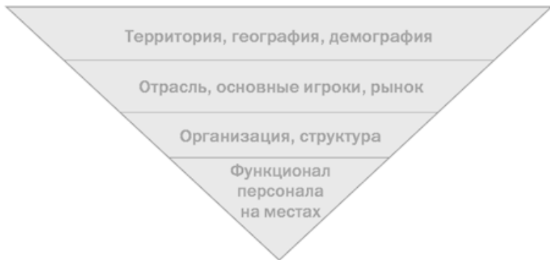
Схема «Контекстный анализ»

Обычно основные усилия по укреплению личной эффективности руководителя сосредоточены вокруг инструментария, который обеспечивает решение функциональных задач. Казалось бы, самое важное для руководителя – четко представлять задачи, для выполнения которых он работает.