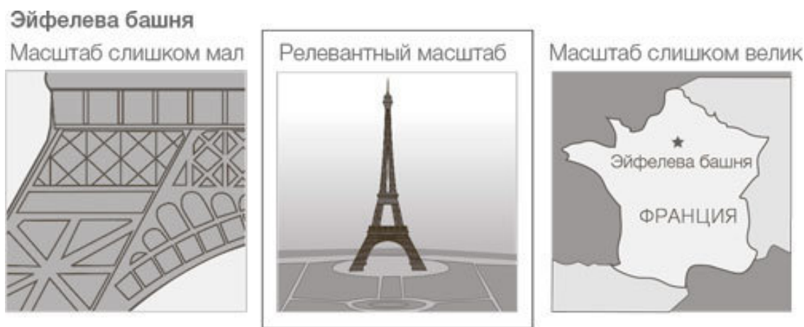
РИС. 3. В разных масштабах видна разная информация

кажется нам твердой – она и есть твердая, – но на самом деле она состоит из атомов и молекул; именно они все вместе действуют как твердая непроницаемая поверхность, с которой мы каждый день имеем дело. Но сами атомы и молекулы тоже не представляют собой неделимую сущность; в каждом атоме есть ядро и электроны. А ядро атома состоит из протонов и нейтронов, которые, в свою очередь, суть более фундаментальные объекты, известные как кварки. И все же не обязательно знать о кварках, чтобы разобраться в электромагнитных и химических свойствах атомов и химических элементов (этим занимается атомная физика). Люди много лет изучали атомную физику, прежде чем появились первые намеки на наличие так называемых элементарных частиц внутри атомов. И биологам при изучении клетки тоже не нужно знать о кварках внутри протона.