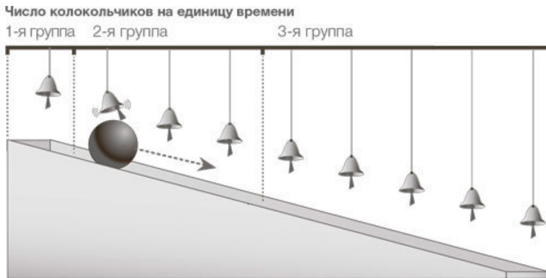
РИС. 7. При помощи колокольчиков Галилей измерял скорость движения шарика по наклонной плоскости

поставить. Возможно, самое знаменитое из его предсказаний говорит о том, что все объекты при отсутствии сопротивления падают с одинаковой скоростью. Он не мог реализовать эту идеализированную ситуацию, но предсказал, что произойдет. Галилей понимал, какую роль при падении предметов на землю играет тяготение, как и то, что сопротивление воздуха замедляет их движение. Качественная наука означает учет всех факторов, которые могут повлиять на то или иное измерение. Мысленные эксперименты и настоящие физические опыты помогли ученому лучше понять природу тяготения.