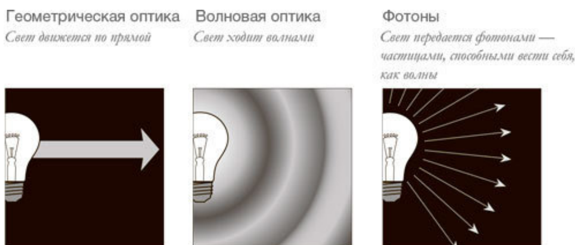
РИС. 5. Современной концепции света предшествовали геометрическая и волновая оптика. Они до сих применимы при определенных условиях

Позже развитие квантовой теории показало, что Ньютон в каком-то смысле тоже был прав. Согласно идеям квантовой механики, свет действительно состоит из отдельных частиц, получивших название фотоны и ответственных за передачу электромагнитного излучения. Но современная теория фотонов базируется на понятии квантов света – отдельных частиц, из которых состоит свет и которые обладают уникальными свойствами. Даже одна частица света – фотон – ведет себя, как волна. Эта волна определяет вероятность нахождения фотона в каждой конкретной точке пространства (рис. 5).