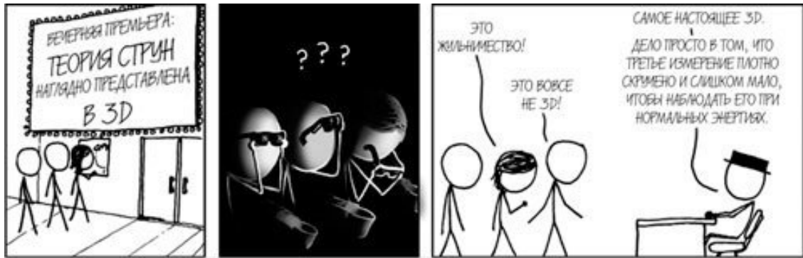
РИС. 1. Так в комиксе представлена скрытая природа свернутых измерений

виях, далеких от параметров нашей повседневной земной жизни, они тем не менее представляют собой существенную часть описания физического мира, но вряд ли попадут в фильм.