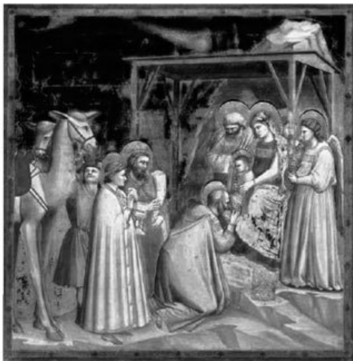
РИС. 6. Джотто изобразил эту сцену на стене капеллы Скровеньи в начале XIV в., когда комета Галлея была видна невооруженным глазом

До Галилея наука полагалась только на непосредственные наблюдения и чистые размышления. Образцом для всех желающих разобраться в устройстве мира служила аристотелева наука. Математику можно было использовать для дальнейших умозаключений, но базовые положения принимались на веру или со ссылкой на прямые наблюдения.