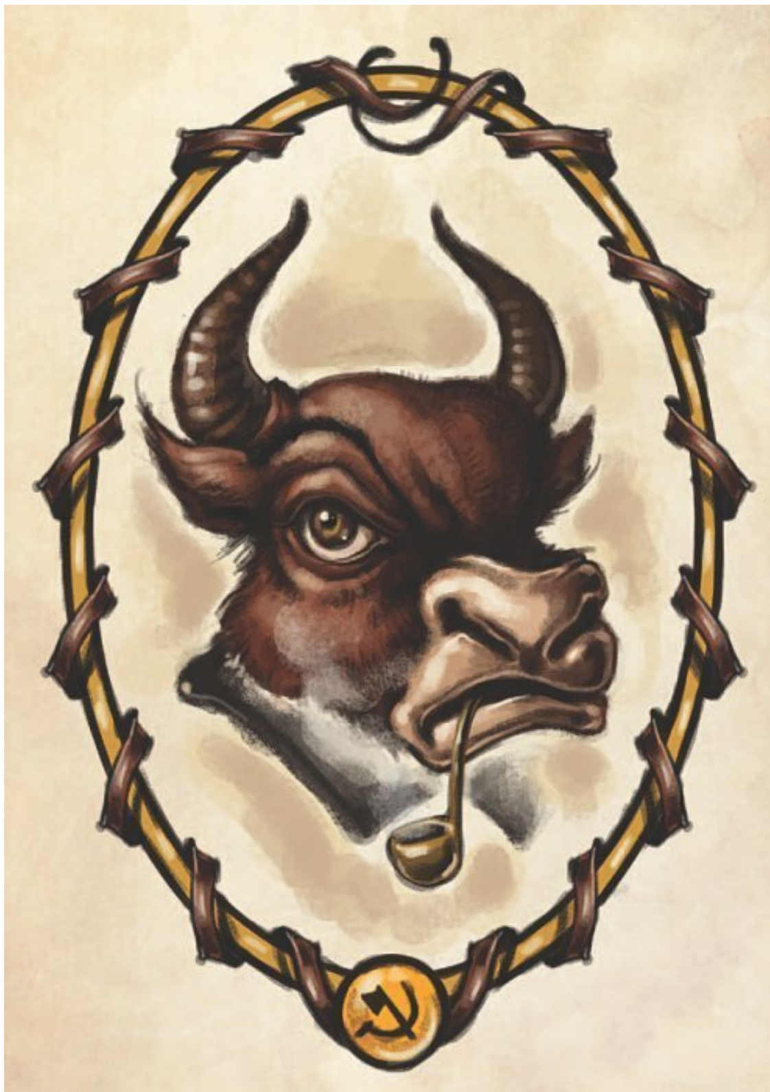
Великий бык Зебу-основатель, мудрый отец трудового народа.

Быки распределяли себе лучшие пастбища, но, будучи бесконтрольными и не задумываясь о будущем, сами же безжалостно вытаптывали эти поля. Остров пустел, количество жителей уменьшалось, но если появлялись несогласные, их били, лягали, пинали, бодали, из страны выгоняли, на исправительные работы отправляли.