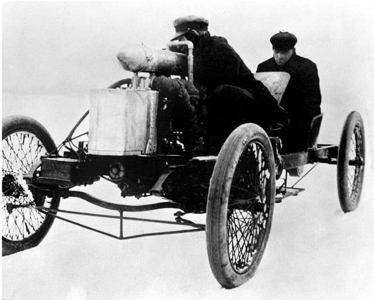
Первый гоночный автомобиль Форда