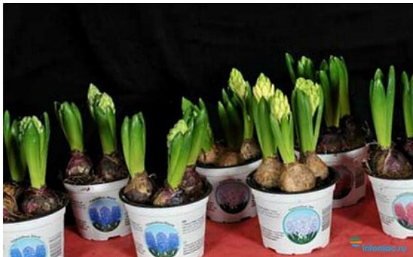
Рис. 9. Гиацинты по три луковицы в горшке при предварительной посадке

Для того, чтобы в почве поддерживать влажность, следует иногда поливать грунт. За это время ваши луковички хорошо укоренятся и позже выпустят цветоносы. Когда на растении появится несколько, как правило, парочка листьев, цветок следует перенести в теплое (+15 гр.) и светлое место.