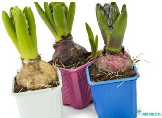
Рис. 10. Персональная посадка в отдельные формы

Самой лучшей водой для полива растения является дождевая или талая вода, которая постояла в помещении какое-то время и нагрелась до комнатной температуры.