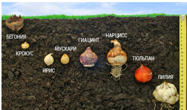
Рис. 4. Сравнение глубины посадки разных луковичных