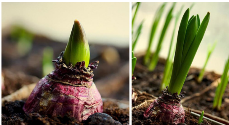
Рис. 8. Расположение верхушки гиацинта при выгонке

При выгонке луковицы гиацинты сажают так, чтобы верхушка проступала из-под земли