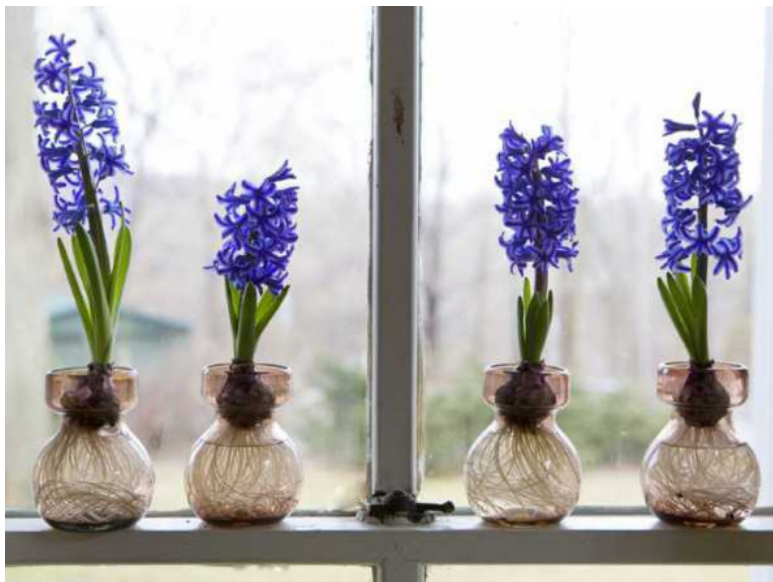
Рис. 11. Гиацинты в водной среде