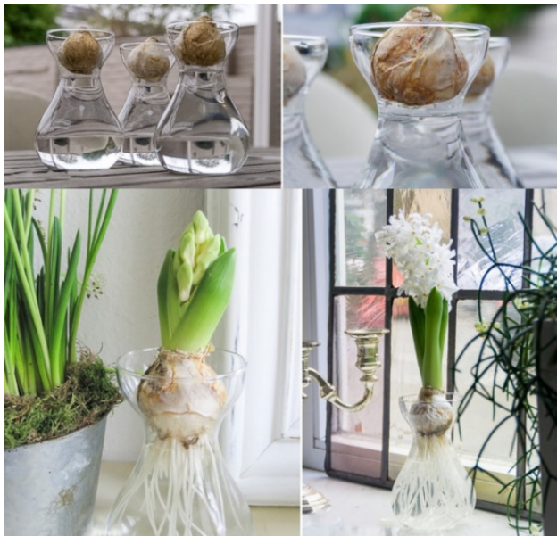
Рис. 12. Гиацинты в водной среде

Выгонку гиацинта можно производить в воде. Для этого луковица погружается не в грунт, а в воду. Делается это так, чтобы ее нижняя часть едва касалась поверхности воды. Сосуд с луковицей помещают в темное место или обматывают бумагой. Уход за гиацинтом заключается в подливании в сосуд воды, с добавлением удобрений. При появлении ростков растение высаживают в грунт, и все остальные этапы совпадают с выращиванием в горшке.