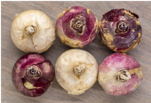
Рис. 5. Луковицы гиацинтов, пригодные для посадки

Под выгонку используются специальные сорта. Среди них наиболее популярны ранние – Бисмарк, Женераль, Ян Бос, и поздние сорта – Виктоуар, Мадам Софи, Сити оф Гарлем и др.