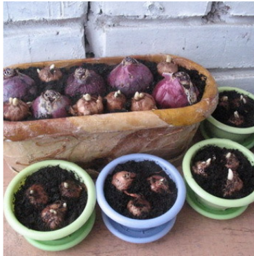
Рис. 6. Посадка гиацинтов в горшки и формы

ся солнечными лучами, гиацинты зацветают гораздо раньше.