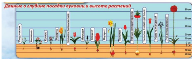
Рис. 3. Сравнение глубины посадки разных луковичных цветов

Укрывать гиацинты в саду перед морозами можно сухим торфом, опилками, лапником, перегноем. Ранней весной, укрытие снимайте, так как ростки цветов появляются очень рано.