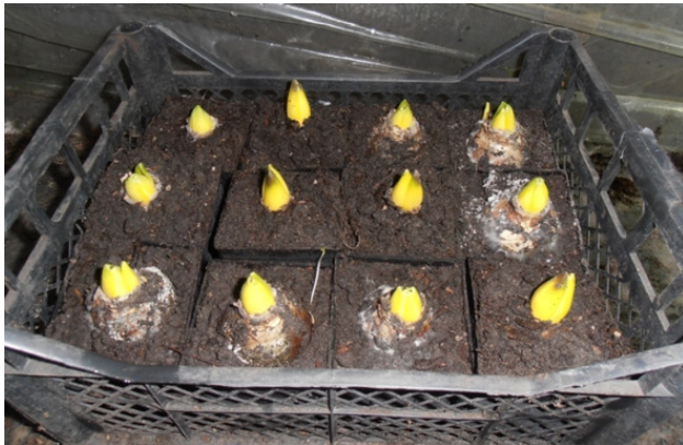
Рис. 7. Переносная предварительная форма для выгонки