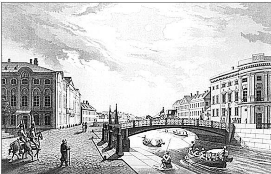
Полицейский мост. 1700-е гг.

В 1735 г. деревянные мосты на Мойке покрасили, и мост на продолжении Невского проспекта получил название «Зеленый». Позже он стал носить другое имя – Полицейский. О происхождении такого названия существуют две разные версии. По одной из них, мост называли из-за находившегося рядом Управления городской полиции (позже этот дом занимал Придворный госпиталь), по другой, – из-за располагавшегося недалеко от моста дома петербургского генерал-полицмейстера Н. И. Чичерина. В 1806 г. деревянный мост заменили чугунным.