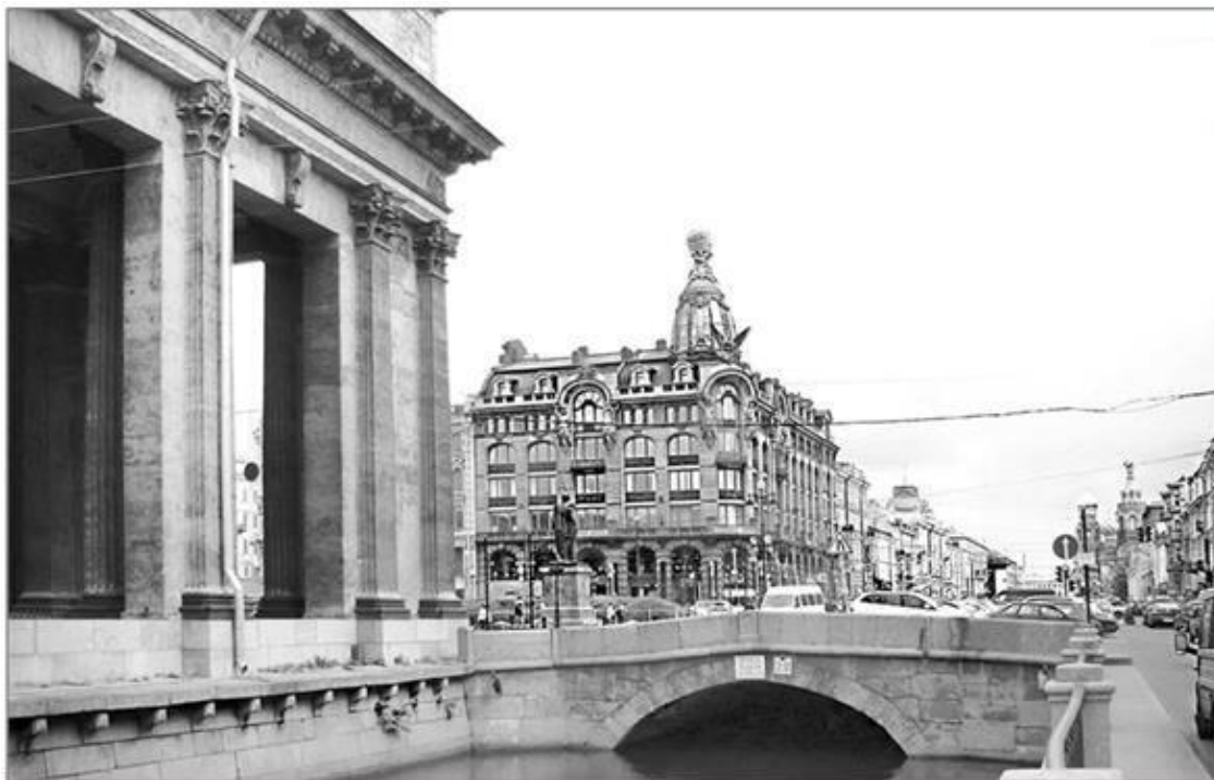
Каменный Казанский мост. Современное фото

и закончились только в 1783 г., во времена Екатерины II, и речка Кривуша стала называться Екатерининским каналом.