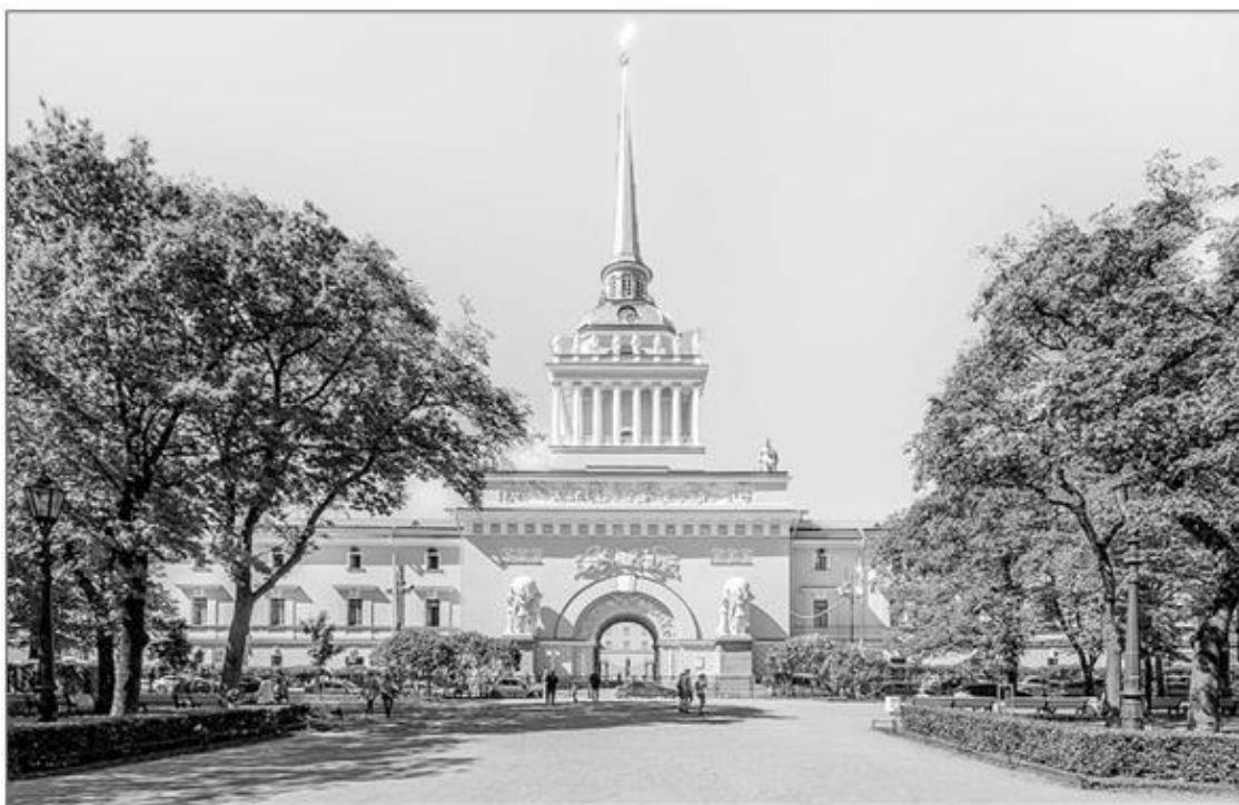
Адмиралтейство. Современное фото

На противоположном берегу реки возвели еще одно укрепление – Адмиралтейство, в котором строились корабли. Вокруг него быстро росла слобода мастеровых людей (район современных Морских улиц). Дома были в основном мазанковыми или землянками, дерево и камень в новом городе находились в большом дефиците, их приходилось привозить по воде, и они редко использовались для частного строительства. Исключением стал каменный особняк первого губернатора нового города Александра Даниловича Меншикова, который возводился на набережной Васильевского острова, где Петр планировал организовать центр города. Рядом с ним вырастал деревянный Посольский дворец, предназначенный для приемов и праздников.