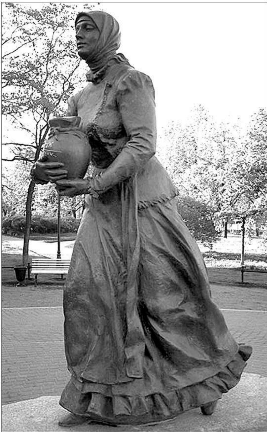
Памятник Охтинке-молочнице. Современное фото