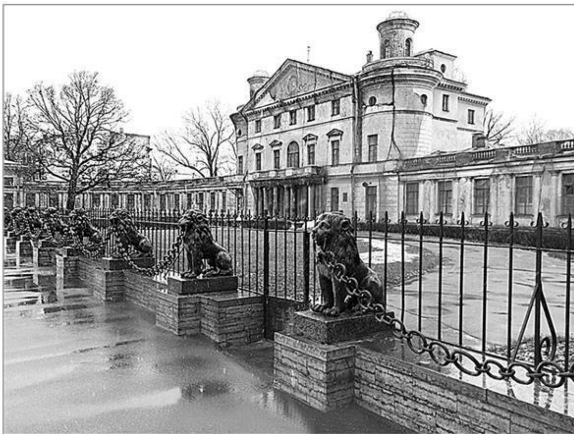
Дача А.А. Безбородко. Современное фото