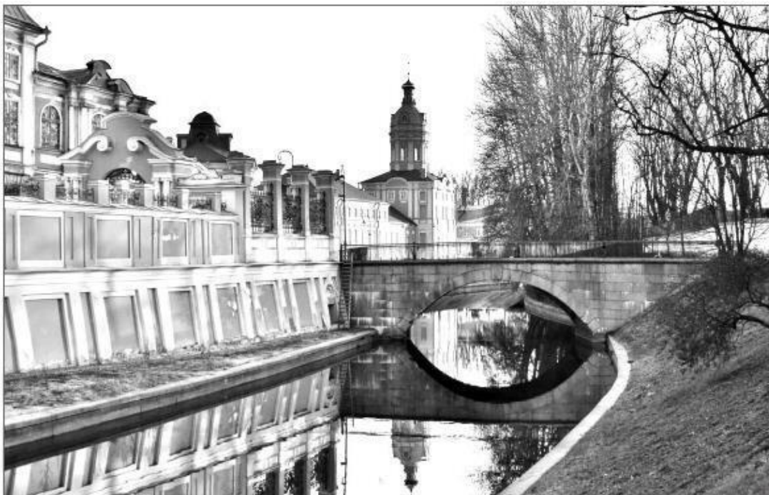
1-й Лаврский мост. Современное фото

вполне боеспособные крепости. Новый же монастырь выходил к Неве, его фасад украшала балюстрада с вазами и цветником.