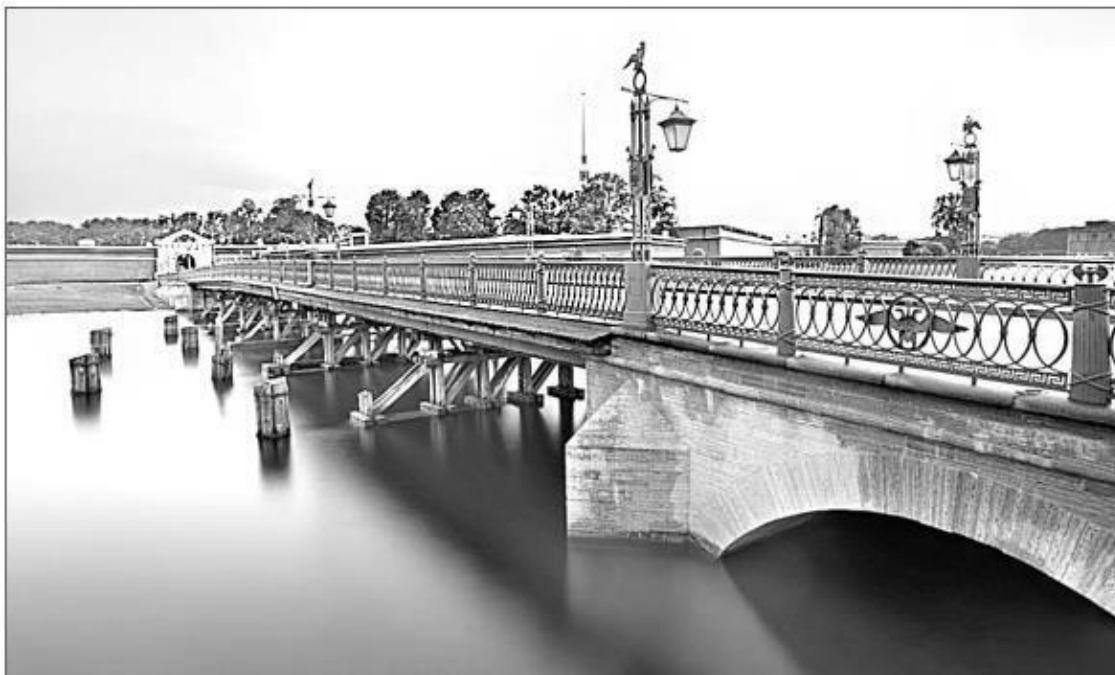
Иоанновский мост Петропавловской крепости. Современное фото

Через узкий канал, отделявший Заячий от будущего Петербургского острова, напротив Меншикова бастиона, построили плашкоутный мост, настил которого помещался на плавучих опорах – широких плоскодонных лодках (плашкоутах), закреплявшихся на месте якорями или специальными оттяжками с берега. Такая технология будет широко применяться для строительства мостов в первые годы существования Петербурга и вплоть до начала XX в.