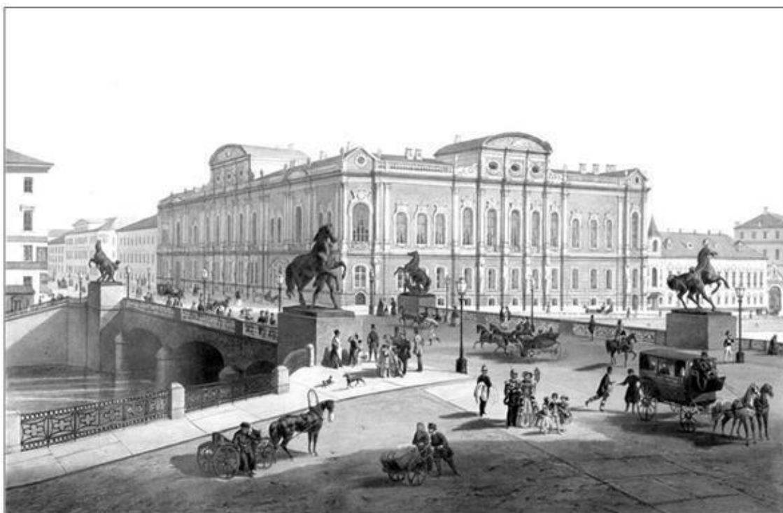
Аничков мост. XIX в.