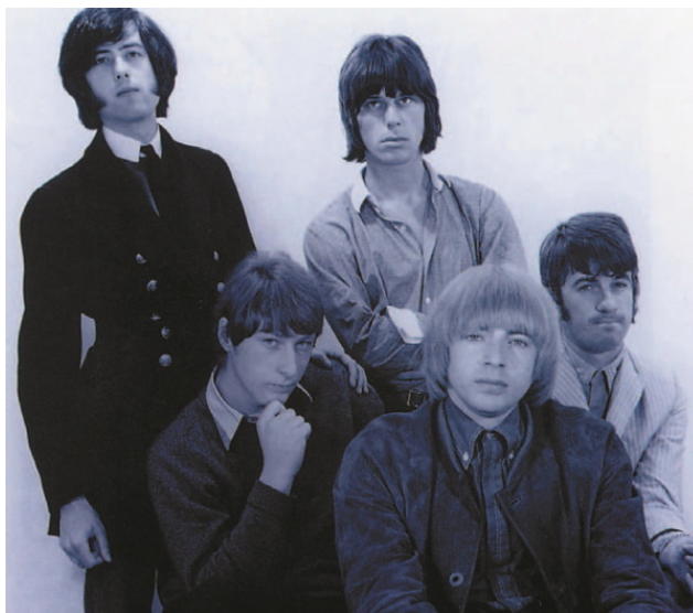
The Yardbirds в 1967 г.

Пейдж ожидал, что юношеский энтузиазм новых коллег распалит внутри группы пламя, и он не разочаровался. Когда эти четверо вздорных ребят впервые оказались в маленьком репетиционном зале в Сохо, вся их энергия высвободилась, как только они начали играть Train Kept A-Rollin . «Сильная штука была», – вспоминает Планта.