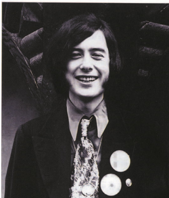
Справа: Джимми Пейдж в галстук-«селедке»

Бывало, что ошибались и спотыкались, но, по сравнению с современниками, их результат был почти всегда на высоте. Иногда их обращение к блюзовым корням заканчивалось обвинениями в плагиате, но в рок-н-рольных кругах это привычная игра. Наверное, достаточно сказать, что до 1968 года просто не существовало ни одной группы, чей саунд хоть чем-то напоминал цеппелиновский.