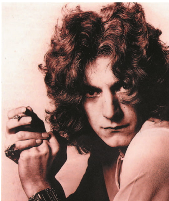
Слева: Роберт Планта, поэт и вокалист

Все эти элементы были предусмотрительно продемонстрированы публике уже в самом начале карьеры группы. От Black Mountain Side из дебютного альбома 1969 года до Gallows Pole ( Led Zeppelin III , 1970 г.), от Stairway to Heaven с безымянного четвертого альбома 1971 года до Kashmir ( Physical Graffiti , 1975 г.) группа занималась музыкальной алхимией.