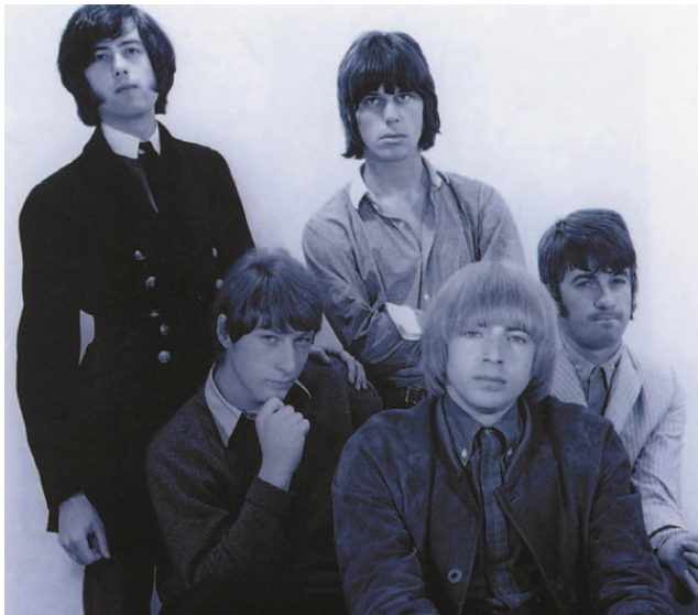
The Yardbirds в 1967 г.

на то, чтобы уговорить Бонэма присоединиться к новой группе: Бонэму казалось, что с Роузом у него «постоянная» работа. Но Пейдж не отступал: «Он оказался именно тем мощнейшим барабанщиком, которого я искал. В конце концов мы, все четверо, собрались в одной комнате, и все сложилось. Мы просто взорвались». The New Yardbirds , как им пришлось назваться из-за контрактных обязательств, собрались и приготовились к десятидневному туру по Скандинавии в сентябре 1968 года.