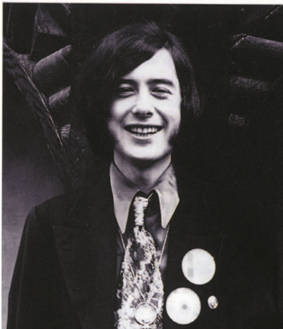
Справа: Джимми Пейдж в галстукe-«селедке»

Бывало, что ошибались и спотыкались, но, по сравнению с современниками, их результат был почти всегда на высоте. Иногда их обращение к блюзовым корням заканчивалось обвинениями в плагиате, но в рок-н-рольных кругах это привычная игра. Наверное, достаточно сказать, что до 1968 года просто не существовало ни одной группы, чей саунд хоть чем-то напоминал цеппелиновский.