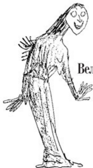
Величайшая Самая Главная Ведьма