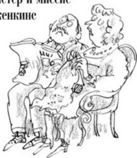
Мистер и миссис Дженкинс