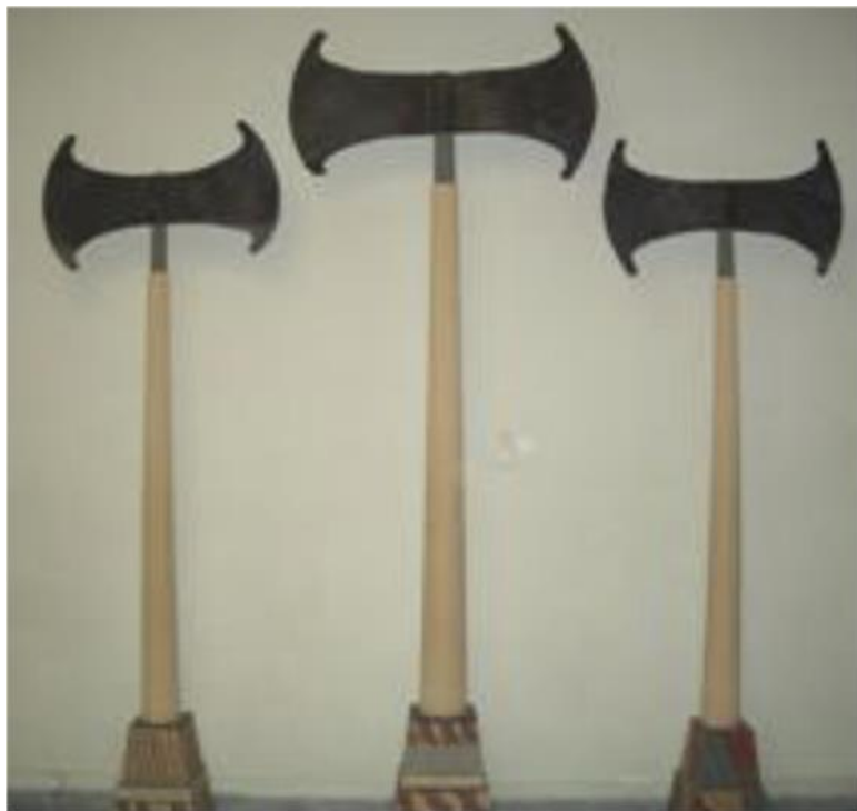
Рис. 11. Лабрисы

хи неолита. Другой образ – это образ могучего и свирепого бога-быка. Определенную роль играли священные символы вроде бычьих рогов или двойного топора – лабриса. В религии минойского периода тесно переплелось «божеского и человеческого», что было ее отличием от позднейшего времени.