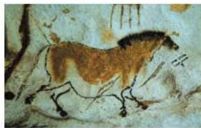
Рис. 1. Пещера Альтамира

Второй вид первобытного искусства – произведения из рога, кости и камня. Это – малые формы и первое появление декоративного искусства. Например, женские фигурки высотой от 12 до 25 см из бивня мамонта, найденные на территории Франции, Италии, Австрии и др.