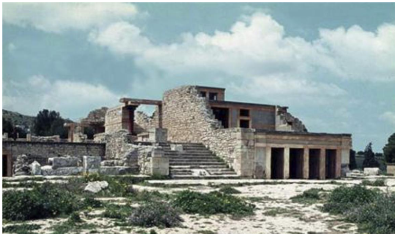
Рис. 9. Внешний вид дворца в Кноссе