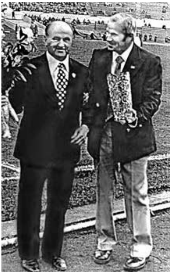
1976 г. Поздравление с 70-летним юбилеем С.С. Ильина проводит один из лучших вратарей советского футбола Алексей Петрович Хомич