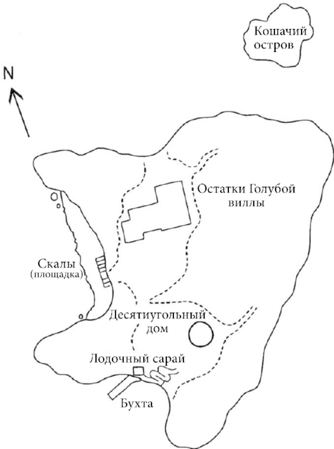
Рис. 1. План Цунодзимы

Выкрашенная голубой краской двустворчатая дверь, видимо, и служила главным входом и вела в прихожую. Чтобы попасть в дом, надо было подняться по ступенькам.