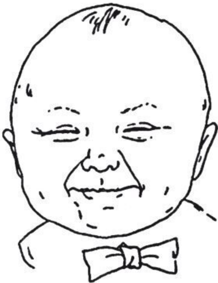
Мирзакарим Санакулович Норбеков