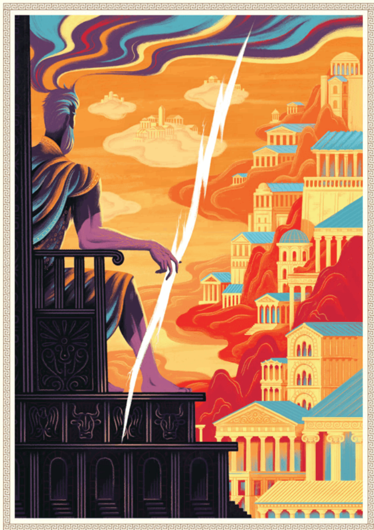
ГРАВЮРА I. Зевс сходящий на Олимп