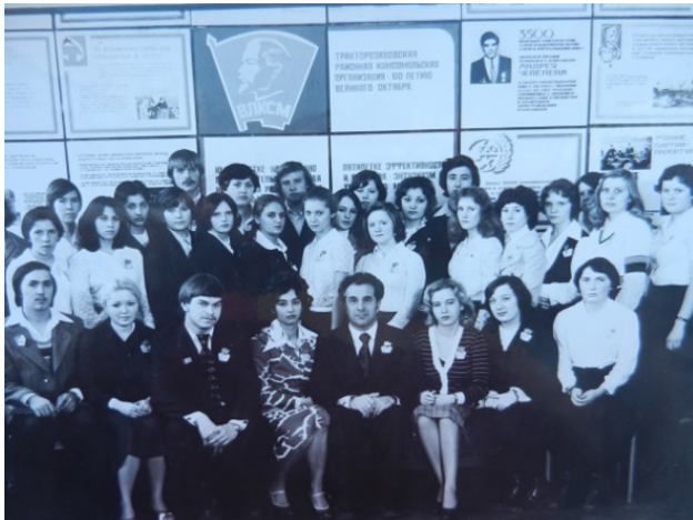
Комсомолцы машиностроительного техникума на очередной комсомольской.. районной конференции.