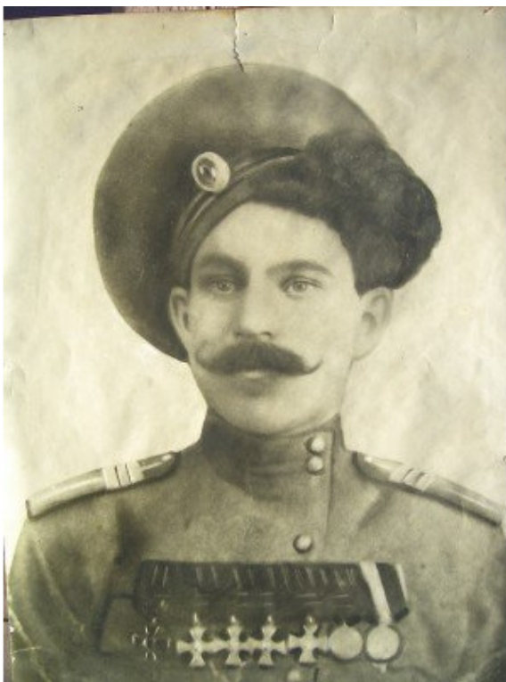
АРЬКОВ Леон Семенович.