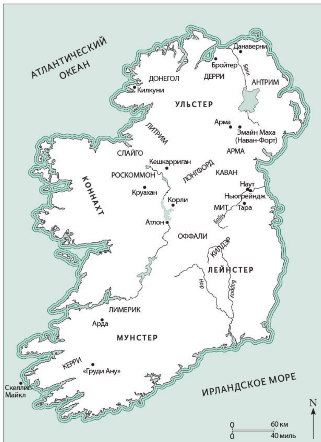
Рис. 1. Карта Ирландии с регионами и местами, упоминаемыми в тексте