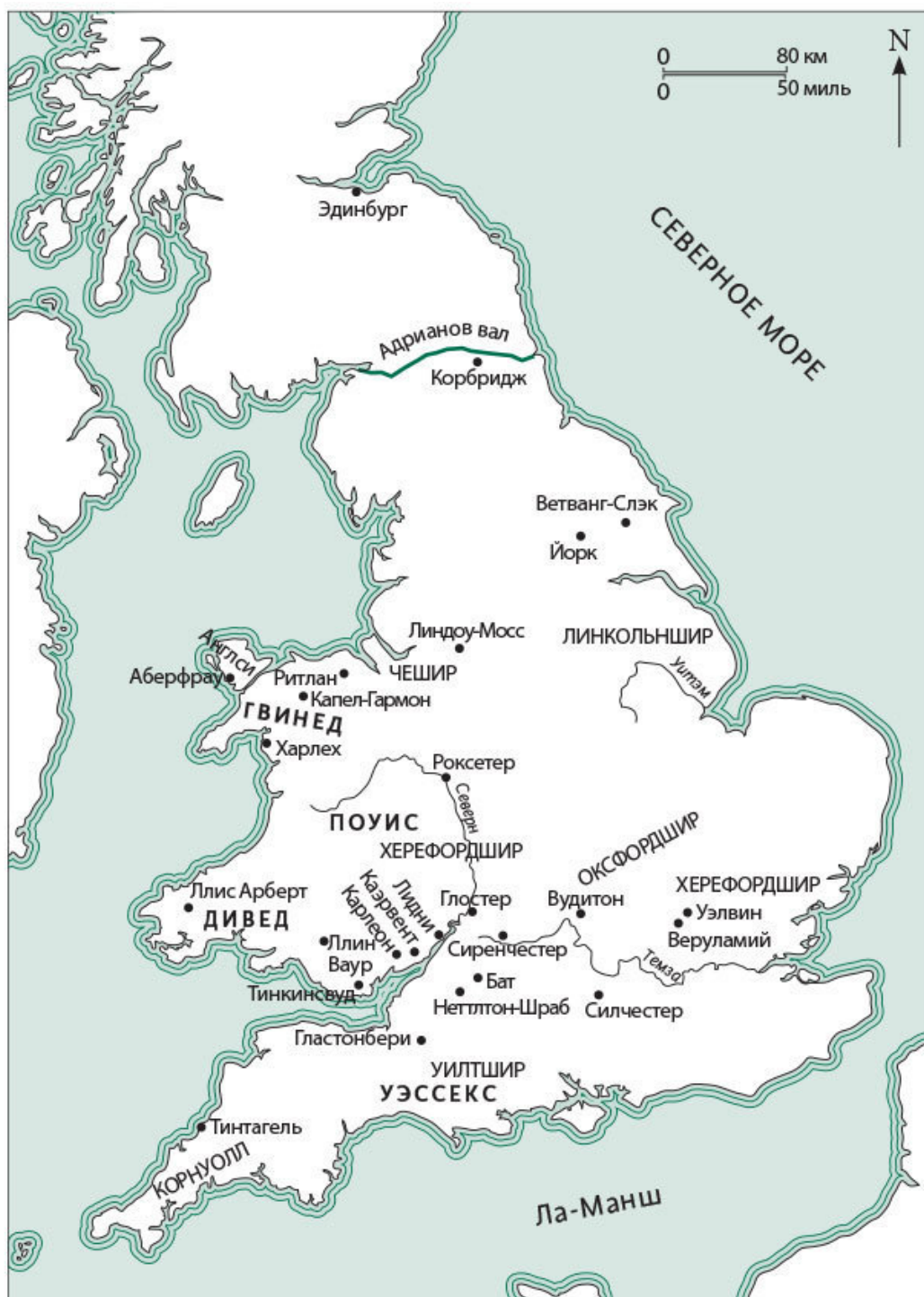
Рис. 2. Карта Англии и Уэльса с регионами и местами, упоминаемыми в тексте

Основное внимание в этой книге уделяется мифам, сохранившимся в раннесредневековой литературе Ирландии и Уэльса и зафиксированным в письменном виде между VIII и XIV веками н. э. С большим трепетом я бралась за создание книги с определением «кельтский» в названии. С начала 1990-х годов археологи серьезно сомневаются в уместности использования этого термина для описания древних народов железного века Западной и Центральной Европы. Особо неприличным стали считать употребление понятия «кельты» применительно к древней Британии. В то время как множество античных авторов упоминают народ, называемый галлами и кельтами (грубо говоря, подразумевая территорию современных Франции,