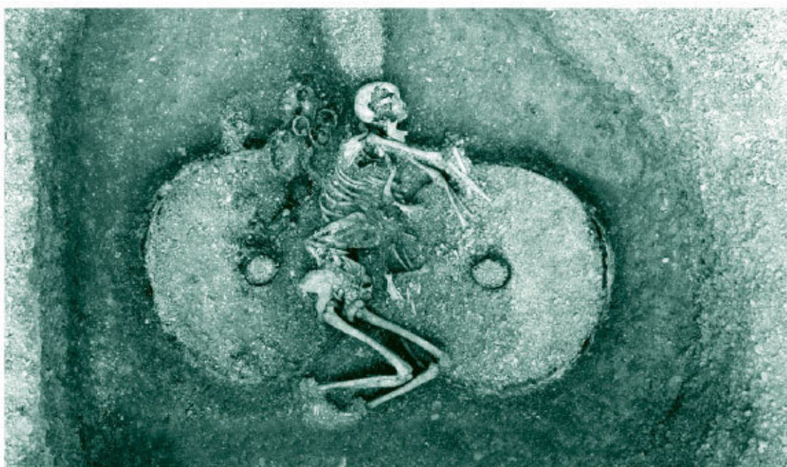
Рис. 3. Захоронение молодой женщины, относящееся к железному веку, в Ветванге, Восточный Йоркшир, найдено в 1984 году

Хотя эта книга о мифологической литературе, тексты, о которых пойдет речь, необходимо помещать в исторический контекст. А посему там, где это уместно, мы даем ретроспективные обзоры наиболее ранних свидетельств, предоставленных археологией, и отклоняемся на восток за пределы границ кельтского Запада, чтобы рассмотреть возможные источники про-