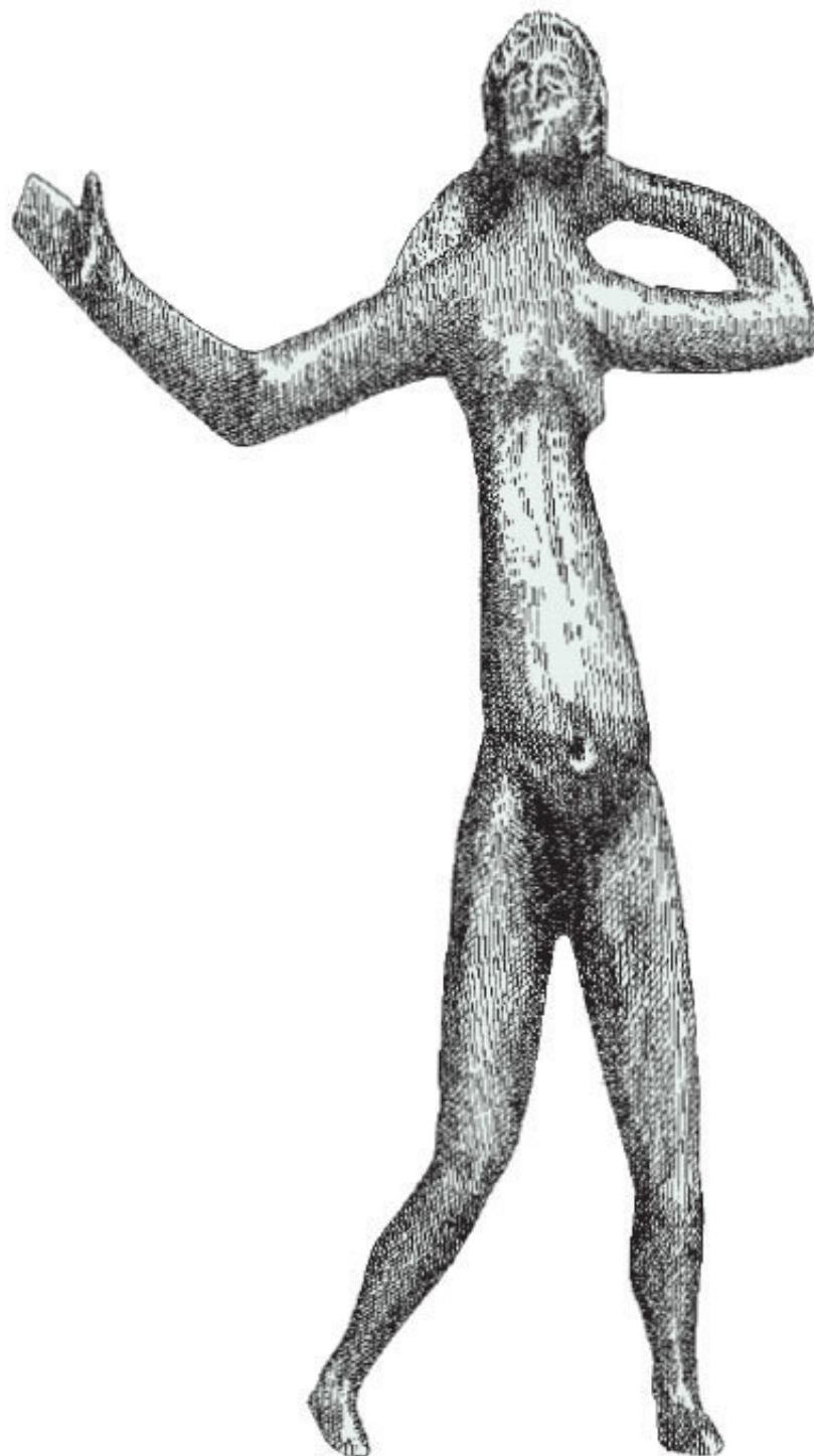
Бронзовая фигура танцовщицы, поздний железный век, Нейи-ан-Сюльяс, Франция