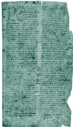
Рис. 5. Страницы из самых ранних рукописей ирландских и валлийских мифов. Слева: из Книги Бурой Коровы,