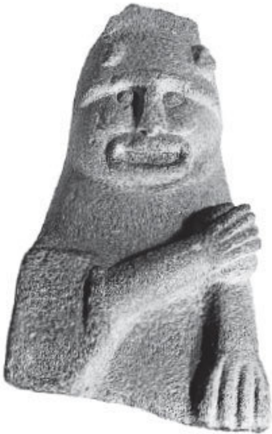
Рис. 6. Каменная фигурка железного века, известная как идол из Тандераги; вероятно, изображение раннего ирландского сказителя из графства Арма