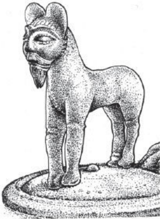
Рис. 8. Бронзовая фигурка лошади с человеческой головой, IV век до н. э., фляжка для вина из погребения в Ремхайме, Германия

На валлийском средневекового сказителя называли «киварвит» (cyfarwydd). Значение этого термина является клю-