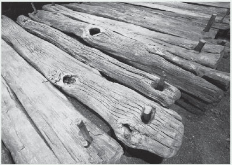
Рис. 4. Деревянная тропинка через ирландское болото, построенная в 148 году до н. э. в Корли, графство Лонгфорд

Археологические находки помогают связать мифологические циклы с их древним происхождением. В середине II века до н. э. община, проживавшая в Корли в современном графстве Лонгфорд в Центральной Ирландии, построила длинную деревянную дорогу через болото к суше. Датирование по годичным кольцам деревьев позволило установить, что дубы, использованные для строительства этого пути, были срублены в 148 году до н. э. Под опорами было захоронено странное изображение получеловека-полуживотного, вырезанное из ясеня, – вероятно,