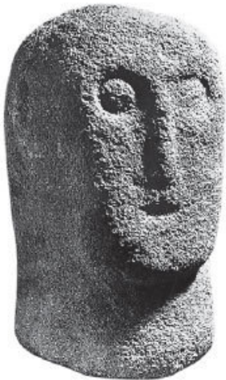
Рис. 7. Позднеримская британская вырезанная из песчаника голова с открытым ртом, найденная в Южном Уэльсе, в Каэрвенте; вероятно, каменный оракул

«Господин, у нас есть обычай, — ответил ему Гвидион, — в первый вечер, когда нас принимают во