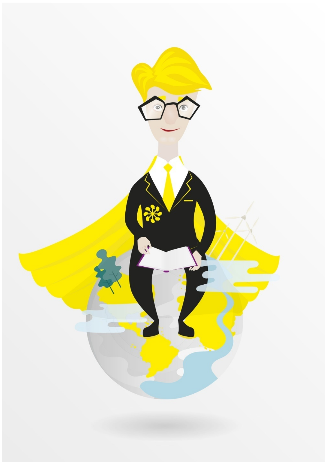
Иллюстрация создана по заказу ООО «Аривист». Художник: Полевая В.Т.