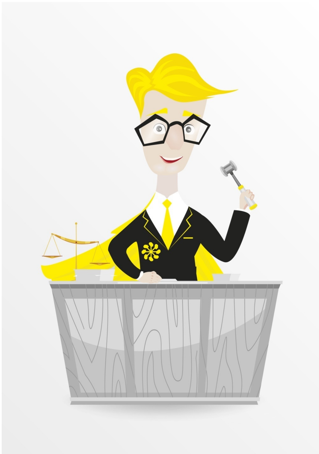
Иллюстрация создана по заказу ООО «Аривист». Художник: Полевая В.Т.

хода от редакции номенклатуры ГС, изданной в 1996 г., к последующей редакции и далее СТС (он же ВТамО) разрабатывает переходные таблицы, которые рассылаются в печатном, а в последнее время и в электронном виде сторонам Конвенции.