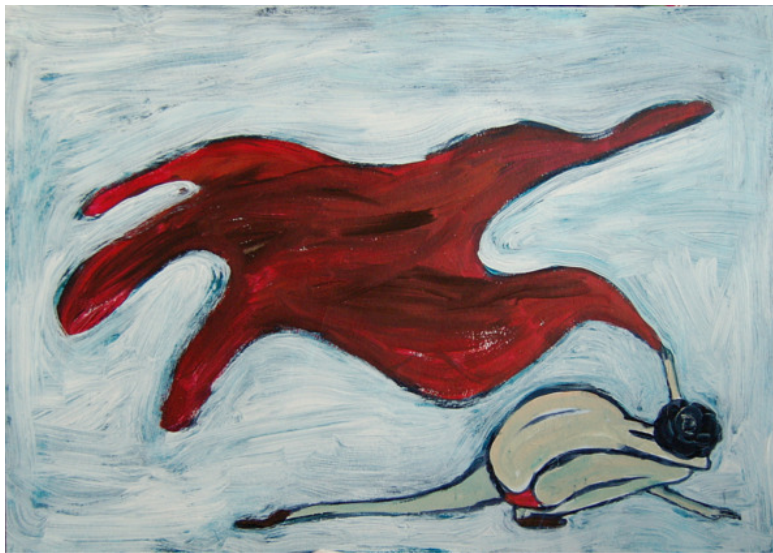
Менструация. Без сил

дами, которые подходят именно вам, а не: «Что ты выдумываешь, все пьют и всем помогает!» А зачастую никакого лечения не нужно, нужно (всего лишь) оставить женщину на денёк в покое, вспомнив, что она не ломовая лошадь, а человек со своими потребностями. А на ухмылочку: «Что ты такая дёрганная, у тебя ПМС, что ли?» не хихикать, а ответить что-то вроде: «О, просто у меня аллергия на мудачество, а от неё таблеток ещё не изобрели, как жаль».