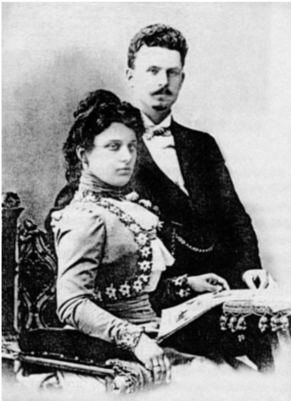
Г.Я. Извеков (церковный композитор) с супругой Софьей Андреевной. 1902 г. «Московский журнал». 2004, № 2

Как смотрит христианство на брак, об этом можно судить по следующему.