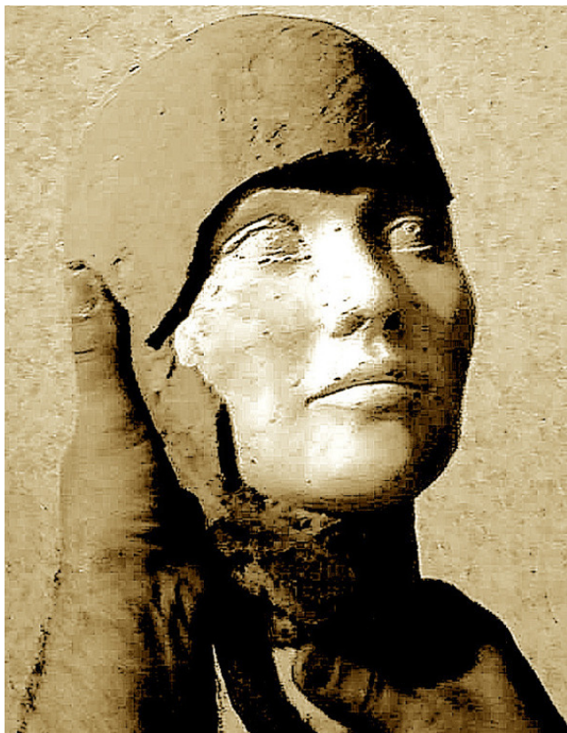
Портрет в процессе отливки из гипса.

Автопортрет – всегда эксперимент по выявлению и познанию, определению и развитию, выражению и утверждению личности. Но он не дает автору до конца предвидеть результат творчества.