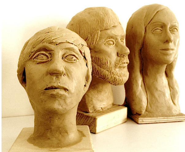
Скульптурные автопортреты на этапе признаков рода

В маскотерапии чаще всего применяется скульптурный портрет (или автопортрет) обладающий неоспоримым преимуществом по сравнению с живописным или графическим. Он позволяет полностью воссоздать лицо, тогда как живопись или графика только имитируют объемные изображения и затрудняют процесс отождествления пациента со своим портретом и лицом.