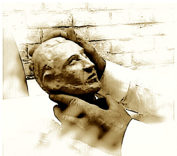
Портрет пациента в руках терапевта.

Данный рассказ ярко свидетельствует нам о том, что портрет по непонятным на первый взгляд причинам может быть ценным даже для такого человека, который совершенно потерял интерес к миру и к другим людям. К самому же себе, к тому, кого он не знает до конца, но хотел бы узнать, любопытство сохраняется: портрет-двойник может быть такой подсказкой.