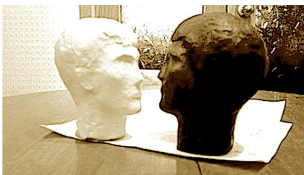
Два портрета одного пациента

Есть и такие клиенты, которые с опаской берутся за любое новое дело. Они к пластилину относятся как к чему-то такому, что можно испортить, за что можно получить плохую оценку. Но если маскотерапевт лепит синхронно с портретируемым точно такой же портрет, то на любом затруднительном этапе можно обменяться изделиями, передав пациенту более совершенную форму, тем самым помогая ему продвинуться в работе. Через некоторое время маскотерапевт из менее худшего делает более совершенное, и обмен происходит вновь. Создается сразу два портрета. И сложно сказать, кто что лепит. Клиент принимает участие в обоих автопортретах. Чтобы они не путались между собой, лучше создавать портреты из пластилина разных цветов, например, основной – из пластилина телесного цвета, а дополнительный – из более темного оливкового.