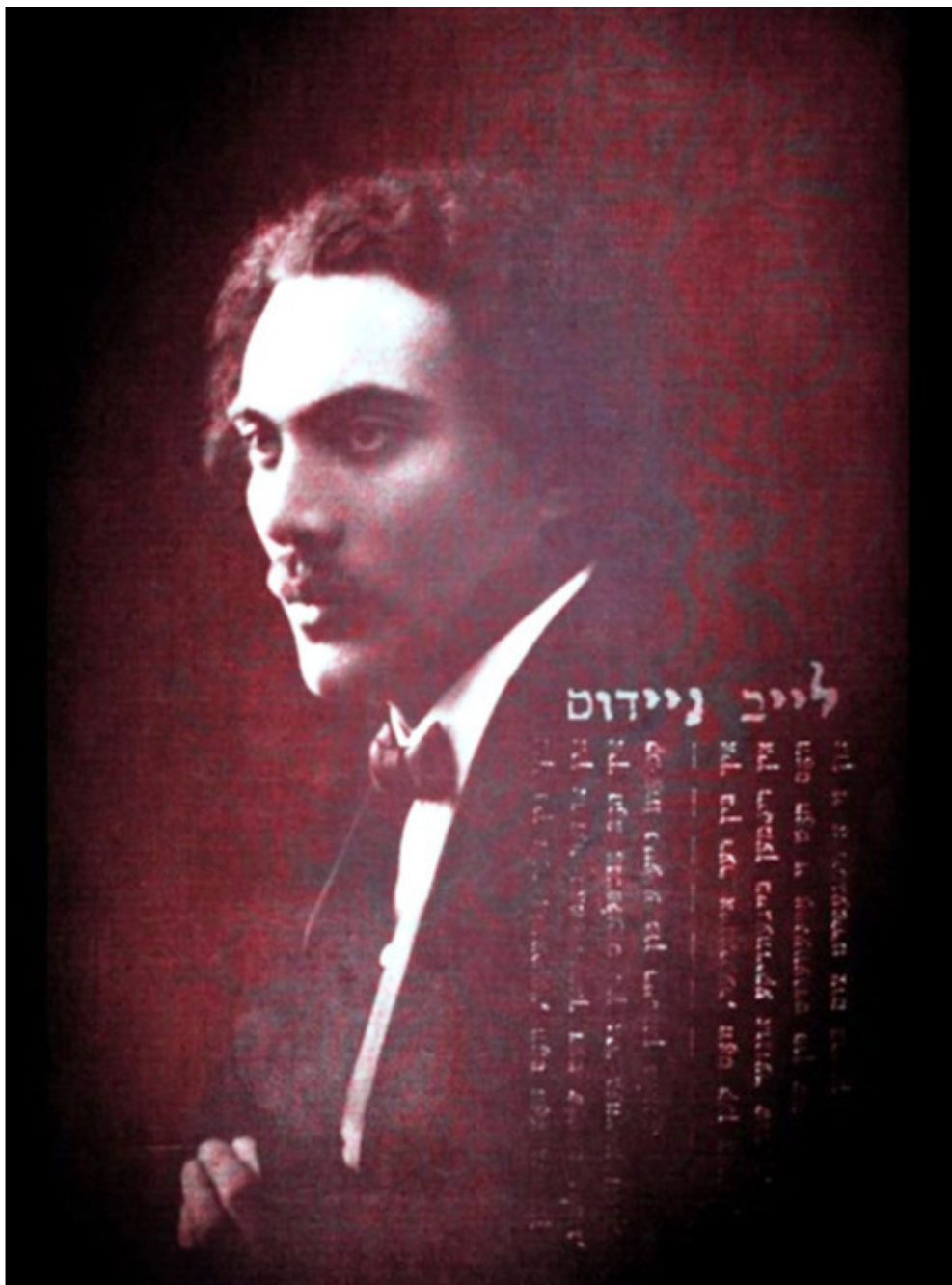
Лейб Найдус. Фото из источника в списке литературы [4]

Лейб Найдус смело заявил: «Я единственный, кто нашел на нашем родном языке прекрасный звук».