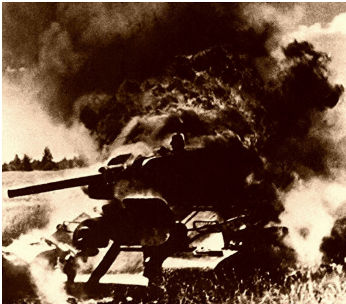
Горящий танк Т-34

От сумасшедшего удара в ушах поднимается гул. Он все нарастает и нарастает, превращаясь в душераздирающий стон и вой, металл рвется как бумага. Все вокруг горит.