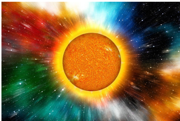
ЗВЕЗДА – СОЛНЦЕ

Однажды в Космосе появилась звезда. И не было вокруг неё ни одной планеты, которая могла бы составить ей компанию. Зато мимо пролетали невоспитанные кометы, которые то и дело показывали звезде яркие языки пламени, раздували горделиво хвостики и улетали в космические дали. Потом они снова возвращались, чтобы подразнить звезду. И однажды звезде стало так обидно, что она заплакала. Её слёзы превращались в облака и постепенно окутывали со всех сторон. От этого звезда даже потемнела. Может быть, она и погасла бы, если бы на ней однажды не поднялся сильный ветер. Он-то и сдул со звезды все облака вместе с космической пылью, которые осели на неё за время жизни в Космосе.