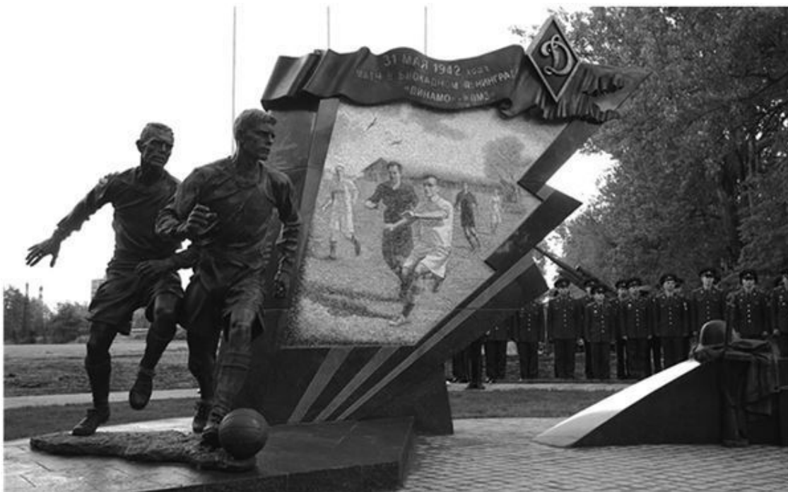
Памятник участникам блокадного матча на стадионе «Динамо»

Сегодня очень многим известна история проведения первого футбольного матча в блокадном Ленинграде. Более того, на стадионе «Динамо» установлен памятник, посвященный игре, состоявшейся 31 мая 1942 года, а у входа на стадион привлекает внимание мемориальная доска с именами участников первой игры. Написаны статьи, сказано множество слов, а возложение цветов к памятнику стало традицией. Однако вокруг вопроса о дате проведения первого блокадного матча до сих пор продолжается дискуссия. Она то затихает, то вспыхивает вновь, и вряд ли можно утверждать, что в дальнейшем она прекратится.